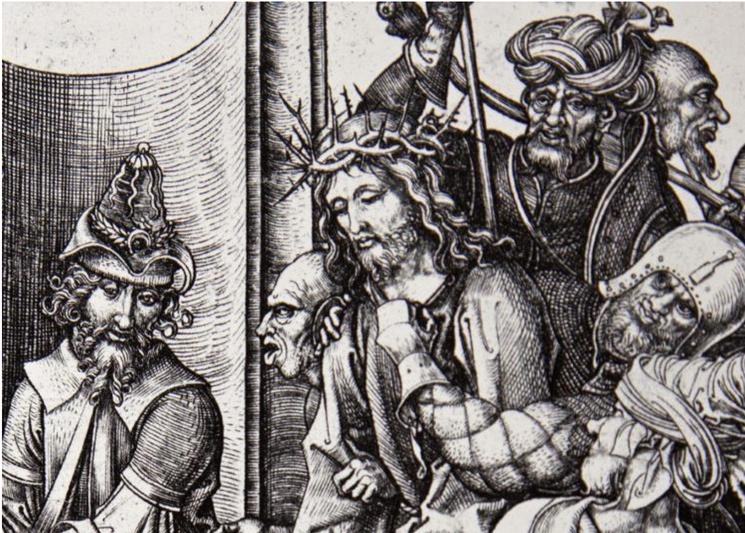
Martin Schongauer, Pilato che si lava le mani, ottavo decennio del 1400. Dettaglio.

induce il sospetto che questa non sia solo misura e proporzione, anche se è proprio in questi termini che si esprime nei suoi trattati ispirati alle teorie di Leon Battista Alberti. D'altro canto il concetto di grazia svolto da Giorgio Vasari, sulla traccia del libro di Baldesar Castiglione, si forma appunto per reazione a una concezione della bellezza determinata da canoni formali e razionali, come quelli teorizzati dall'Alberti, inadeguati per esprimere quella "concordanza di grazia nel tutto" di cui Vasari scriveva nelle Vite .