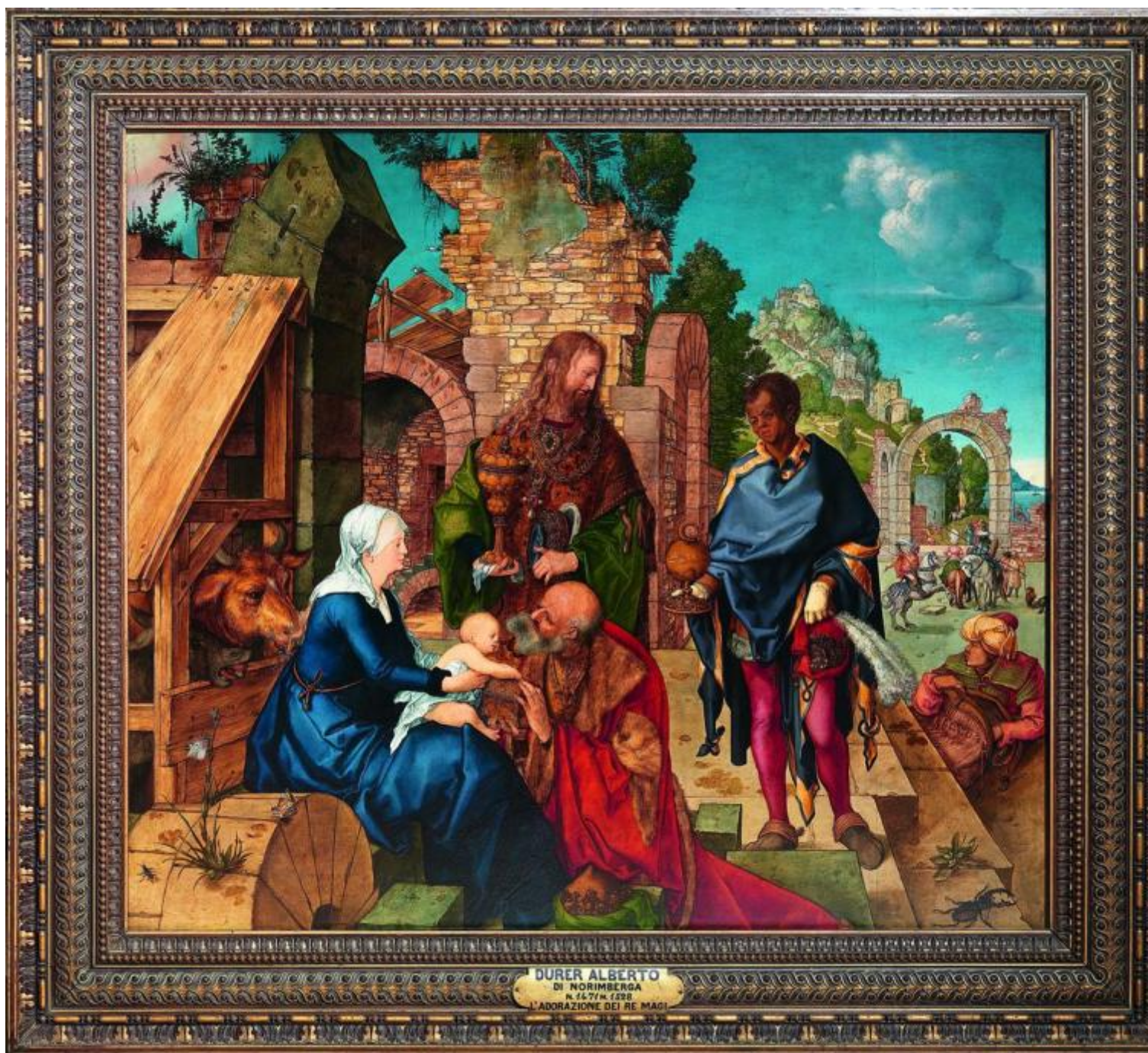
Albrecht Dürer, Adorazione dei magi, 1504. Olio su tavola. Firenze Galleria delle Statue e delle Pitture.

La mostra è dedicata all'influenza esercitata dallo stile all'antica dell'arte rinascimentale sulla cultura visiva della Germania del sud, verso la fine del Quattrocento. Nello scambio culturale e artistico tra il sud della Germania e il nord dell'Italia Dürer ebbe un ruolo di primo piano. L'artista soggiornò a Venezia dove studiò alcune opere che lo ispirarono, tra queste Il Trionfo della Fede di Tiziano Vecellio stampato nel 1517, modello compositivo al quale Dürer s'ispirò per la realizzazione dei fogli a stampa xilografica della serie Il grande carro trionfale dell'imperatore Massimiliano I . In queste xilografie le grazie delle lettere si separano dai segni alfabetici per volteggiare nel cielo come le nuvole vaganti disegnate da Vecellio nel suo Trionfo . A dispetto del primato della parola sull'immagine rivendicato da Martin Lutero, questi decori alfabetici si prendono la libertà di andare a spasso da soli rivendicando il diritto di costituirsi come immagini indipendenti dalla parola, penso tra me e me ammirando le bellissime xilografie. Ciò che colpisce in queste opere è la