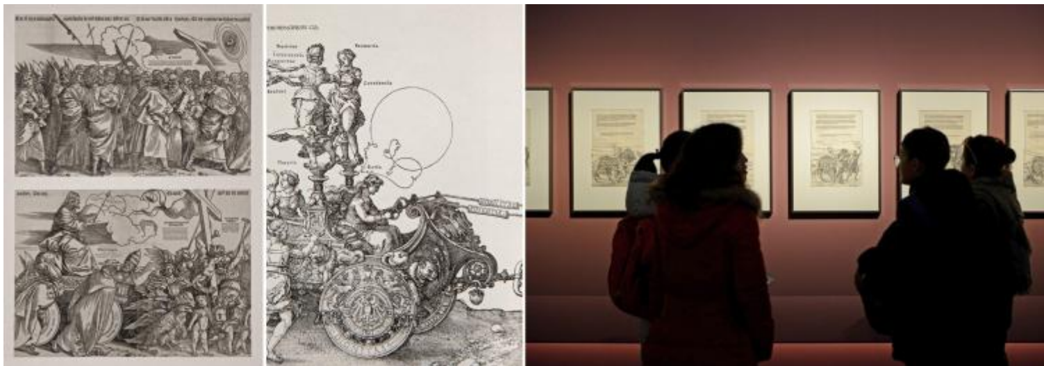
Tiziano Vecellio, Il Trionfo della Fede , 1517 (edizione francese post 1543). Xilografia in 5 fogli. Staatliche Museen, Berlino - Albrecht Dürer Il grande carro trionfale dell'imperatore Massimiliano I , 1522. Xilografia in 8 fogli. Schweinfurt, Collezione Schöfer – Paolo Poce, fotografia dell'allestimento della sala 2 – Geometria, misura, architettura con i fogli a stampa xilografica della serie Il grande carro trionfale dell'imperatore Massimiliano I .

scioltezza del gesto che con grazia e quindi con naturalezza e apparente noncuranza lascia una traccia.