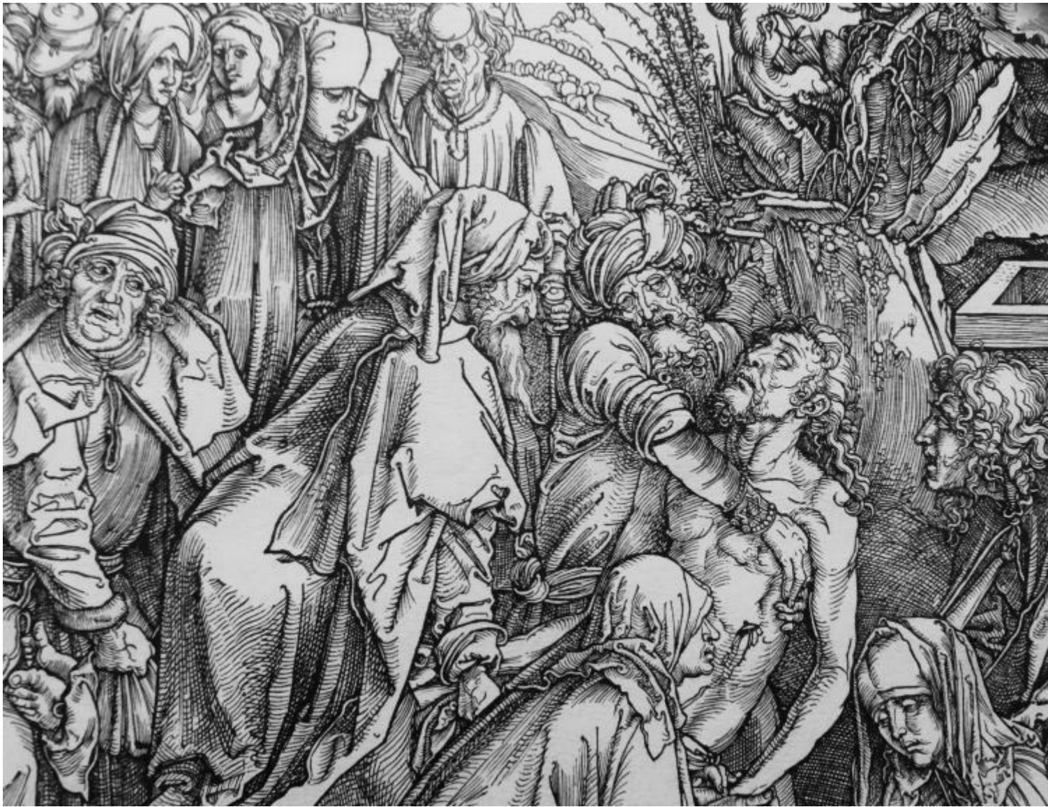
Albrecht Dürer, Grande Passione, 1496-1511. Xilografia in 11 fogli, dettaglio del foglio Seppellimento. Schweinfurt, Collezione Sch?fer.

Brutto? No, sgraziato! Nella caricatura disegnata da Albrecht Dürer in una lettera indirizzata all'umanista Willibald Pirckheimer, il sorriso idiota e sgangherato di una donna si fa largo tra le parole con lo stesso tratto sciolto e sicuro usato per scrivere. In molti altri disegni, xilografie, incisioni a puntasecca e ad acquaforte esposte nella mostra milanese Dürer e il Rinascimento tra Germania e Italia in corso a Palazzo Reale (fino al 24 giugno), lo stesso tratto svolge elegantemente le grazie delle lettere oppure delinea figure e ornamenti prolungando e aggrovigliando lo svolazzo, sdoppiando il viticcio (Henri Focillon, Albrecht Dürer , Milano, 2004, p.16).