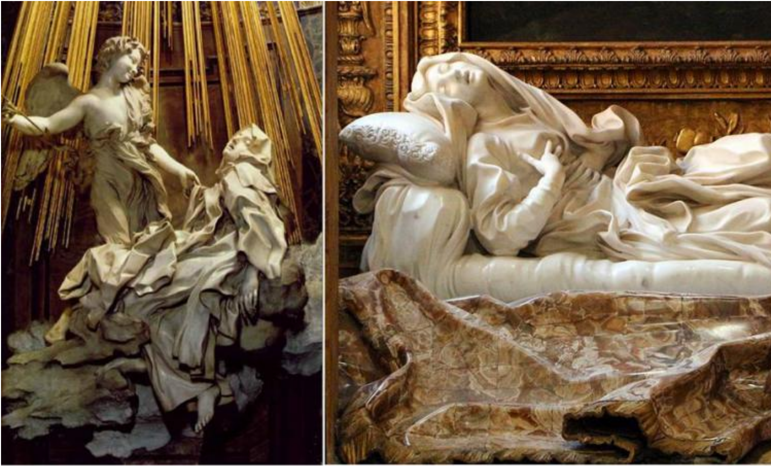
Gian Lorenzo Bernini, Transverberazione di Santa Teresa d'Avila, 1647-1652. Roma, Santa Maria della Vittoria – Gian Lorenzo Bernini, Estasi della beata Ludovica Albertoni, 1674. Roma, San Francesco a Ripa.

Dafne , corredato da un distico, intorno al quale sto girando ammirando stupefatto la maestria con la quale Bernini rende la carne, i capelli che mutano in foglie di alloro e anche l'aria che le figure sembrano spostare fuggendo l'una dall'altra.