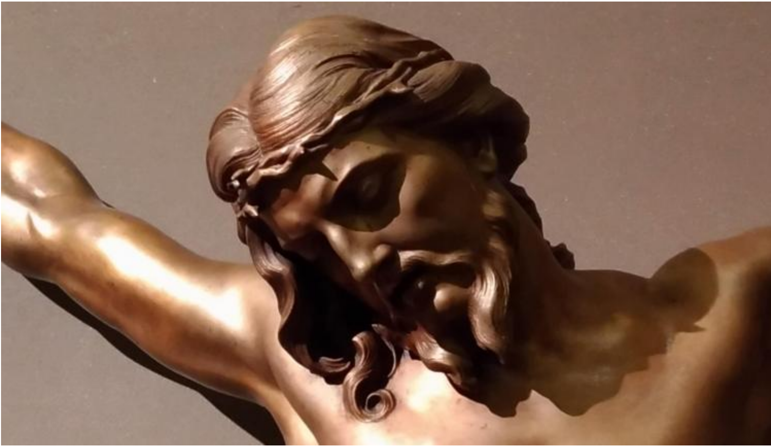
Gian Lorenzo Bernini, Cristo crocifisso, 1654-1656. Madrid, San Lorenzo de El Escorial, Real Monasterio.

Oltre ad essere uno scultore, Bernini è anche architetto e scenografo. Il colonnato ellittico della basilica di San Pietro, che chiama a raccolta per unire in un abbraccio, è una straordinaria invenzione insieme architettonica e scenografica collegata all'idea che sia possibile tenere tutto insieme in una sola forma. Il tradurre tutto in un'immagine, in uno schema, in un diagramma è l'ideale culturale del tempo. Il Teatro del Mondo di Athanasius Kircher ne costituiva un formidabile esempio. Allestito dal padre gesuita presso il palazzo dei Gesuiti o Collegio Romano era costituito da una raccolta di statue antiche, strumenti matematici, coccodrilli, reperti naturalistici, strumenti ottici e musicali, monete, lucerne, prodigi naturali e una biblioteca, una raccolta eterogenea che rispecchiava l'aspirazione gesuitica alla conoscenza totale del mondo. Il palazzo dei Gesuiti, ora sede del Liceo Classico Visconti, conserva una piccola raccolta del disperso Museo Kircheriano. Si può visitare il giovedì dalle ore 14:30 su prenotazione (Wunder Musaeum c/o Liceo Classico Statale Ennio Quirino Visconti).