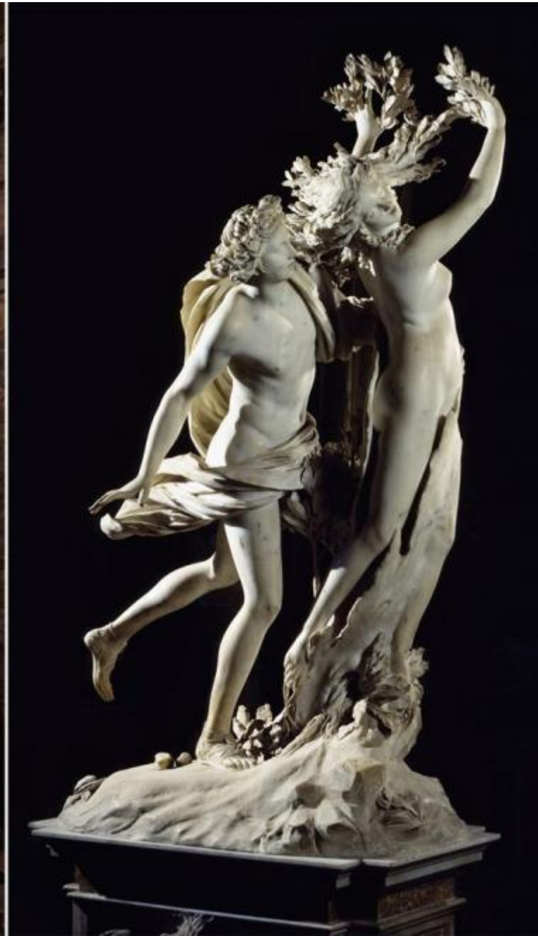
Gian Lorenzo Bernini, Ratto di Proserpina, 1621-1622. Roma, Galleria Borghese. – Gian Lorenzo Bernini, Apollo e Dafne, 1622-1625. Roma, Galleria Borghese.

La mostra valorizza la Galleria Borghese come teatro delle sculture di Bernini alcune delle quali concepite appositamente per dare “figura d’immaginazione” alle stanze su commissione del cardinale Scipione Borghese. Tra queste anche il Ratto di Proserpina dove la mano di Plutone che tocca e preme non lo fa per scaramanzia come quella del turista, ma per rapire la figlia di Cerere. Le dita di Plutone affondano nella carne della fanciulla con una verosimiglianza da far accapponare la pelle. Osservo con attenzione. Il dettaglio visivo trasmette una sensazione tattile se pur non stia toccando la scultura, cosa assolutamente proibita nei musei. Vedere e non toccare, come si dice, ma in questo caso tocco vedendo, cosa che è nei sogni di molti maschi italiani, almeno a credere agli stereotipi.