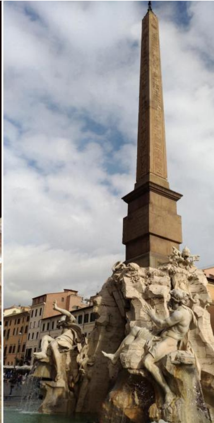
Gian Lorenzo Bernini, Fontana dei Quattro Fiumi, 1649-1650, modello in legno, terracotta e cera. Bologna, Accademia di Belle Arti - Gian Lorenzo Bernini, Fontana dei Quattro Fiumi, 1648-1651. Veduta parziale. Roma, piazza Navona.

Nel frattempo ho raggiunto piazza Navona, affollata come sempre. Sono pronto per goderne appieno la visione. Il Rio della Plata, uno dei quattro fiumi della fontana monumentale, è rappresentato in forma di figura colossale con la mano sinistra protesa, secondo i maligni, per difendersi dal crollo della prospiciente