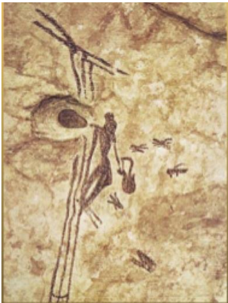
Cueva de la Arana, Bicorp, Spagna. Pittura rupestre di 8000 anni fa. Un uomo raccoglie il miele.