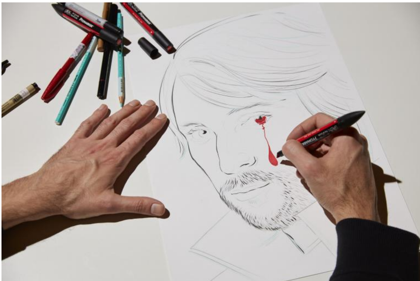
“Take Me (I’m Yours)”, veduta della mostra, Pirelli HangarBicocca, Milano, 2017.

Superando la soglia della Sequenza , opera ambientale di Fausto Melotti – mi appare sempre maestosa, e magnifica con ogni condizione atmosferica e di luce – ed entrando così nell'atrio dell'Hangar, si ha subito accesso al giardino dei desideri di Yoko Ono : due Wish Trees – piante di limone Madernino – attendono di essere incoronate da desideri, sogni, pensieri, goliardie e disegni dei visitatori. Nell'incertezza, l'artista offre indicazioni e mette a disposizione penne, cartoncini e cordoncini per annodarli alla chioma verde, speranza . Dopo la chiusura dell'esposizione, ogni biglietto sarà raccolto da Mother Superior e prontamente conservato insieme a un milione d'altri (e più), sotterrati insieme sotto l' Imagine Peace Tower creata proprio da Yoko a Reykjavík.