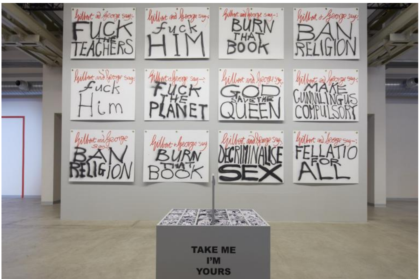
"Take Me (I'm Yours)", veduta della mostra, Pirelli HangarBicocca, Milano, 2017.

Non sono forse le esperienze che facciamo, come le viviamo, a renderci quello che siamo?