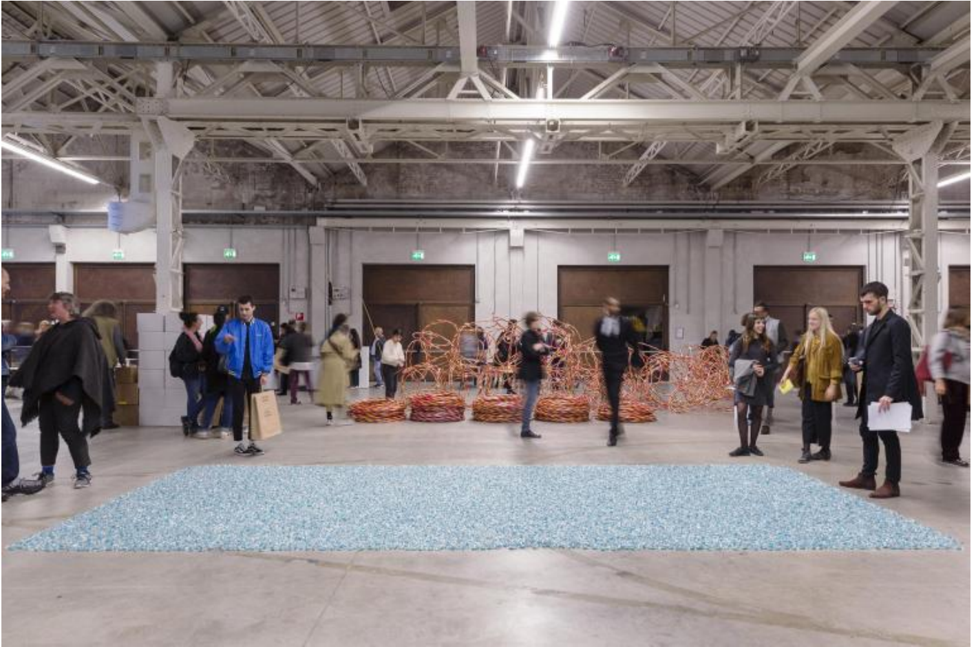
“Take Me (I’m Yours)” , veduta della mostra, Pirelli HangarBicocca , Milano, 2017.

James Lee Byars nel 1976 ( video della performance alla Peder Lund Gallery , Oslo, 2016), che ha come riferimento l'estetica orientale, in particolare la scarna e quieta essenzialità del movimento degli spettacoli N? del teatro giapponese lungo il XIV secolo. Non suona come un rimprovero, anzi, ha un certo potere calmante, nella frenesia dell'evento: costringe a fermarsi un momento, incontrare lo sguardo di un'alterità, riconoscere, ancora una volta, la benedizione dell'incontro.