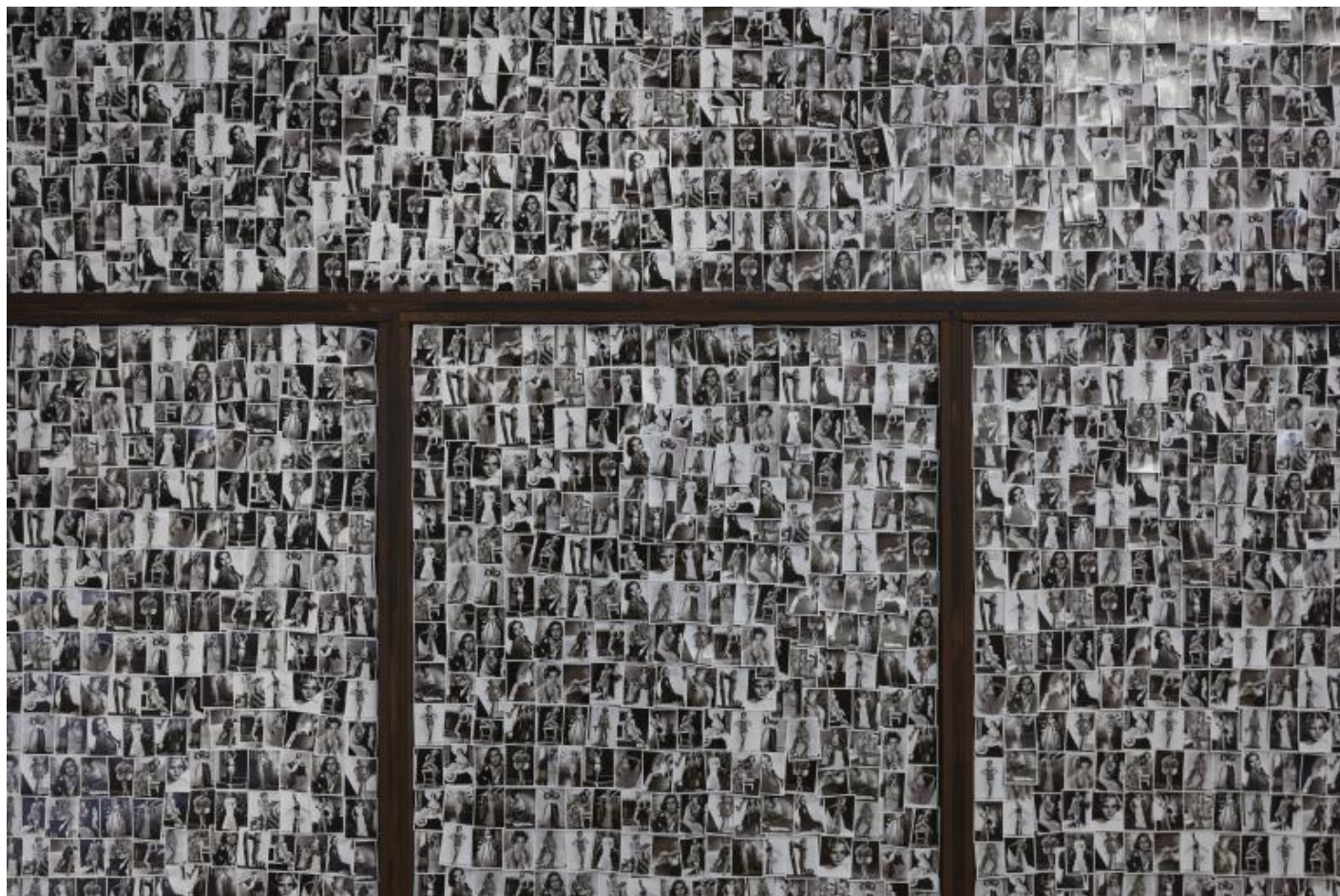
“Take Me (I’m Yours)”, veduta della mostra, Pirelli HangarBicocca, Milano, 2017.

La mostra è accessibile gratuitamente , ma per interagire attivamente e poter «comporre la propria collezione» è necessario acquistare qui o all'ingresso (per la cifra simbolica di € 10) un shopper di carta firmata Boltanski – dovrebbe essere la prima opera conquistata da portare a casa – che permetterà, altresì, di intervenire e modificare alcune altre opere , e in molti casi persino di appropriarsene. Il titolo è programmatico; e in fondo, parla chiaro: « Prendimi (sono tuo, tua)».