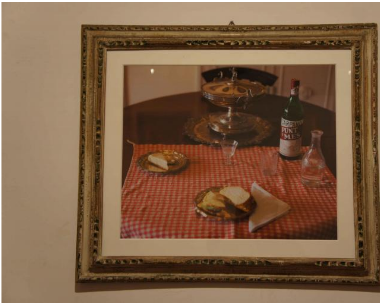
Natura morta con Punt&Mes, 2012. Fotografia a colori in cornice di legno d'orato 55 x 65 cm.

da Vinci a Julio Cortazar. Infine, gli otto ambienti del PAC, che completano idealmente il viaggio nei trent'anni di produzione, proponendo due opere inedite e una serie di lavori ripensati specificamente per gli spazi del museo. Una mostra che accoglie alcuni tra i progetti più significativi della carriera di Vitone, accolti nel padiglione che, per l'occasione, viene trasformato in un contenitore da manipolare, una sorta di scatola scenica.