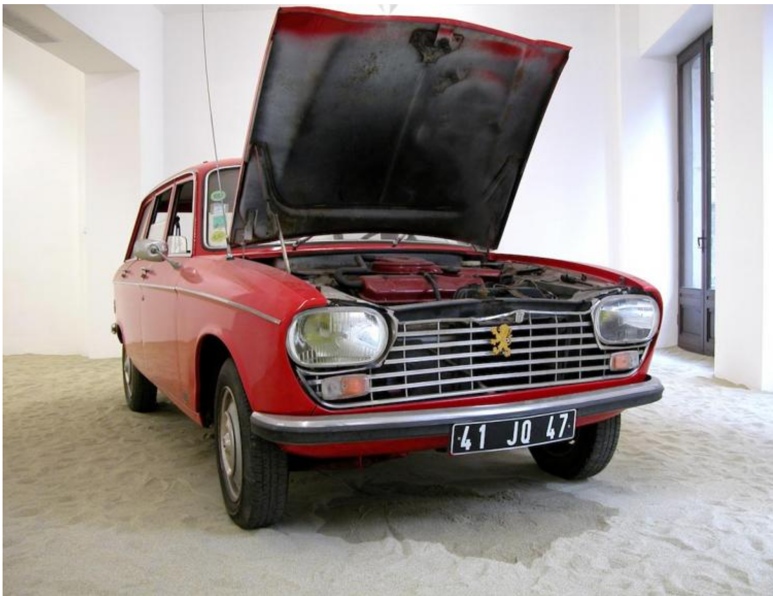
Ultimo Viaggio, 2005. Automobile, sabbia, 8 oggetti, mensola, 5 fotografie a colori 50 x 77 cm ciascuna, 1 fotografia in bianco e nero 50 x 77 cm. Dimensioni ambientali, Collezione Nomas Foundation, Roma.

La permanenza e la scomparsa della memoria tornano anche nell'opera Corteggiamento (2003-2004), composta da nove sculture musicali intitolate alle Muse. Vitone recupera strumenti musicali della tradizione e li decora con le luci di una festa di paese, poggiandoli su mobili ormai desueti, sonorizzando l'installazione con musiche del repertorio popolare. Attraverso una ricognizione etnografica in forma poetica, l'artista richiama l'attenzione su un patrimonio culturale che si dissolve e che, ancora una volta, lega assieme con un doppio filo le nostre storie private, i ricordi familiari, il passato e il presente della storia a cui, consapevolmente o no, tutti noi partecipiamo. Ad essa fa da controcanto il video Trallallero nei giardini di Villa Reale (2017), dove viene ripresa la performance di un gruppo di canto polifonico genovese, e Sonorizzare il luogo. Europa (1989-1993), costituita da quindici stazioni sonore che rappresentano altrettante regioni europee abitate da minoranze etniche o culturali. Passeggiando nel corridoio si è immersi in una cacofonia di suoni che diventano distinguibili solo avvicinandosi alle singole stazioni, metafora quanto mai attuale della confusione in cui versa l'Europa, oggi ancor più di quando l'opera fu concepita.