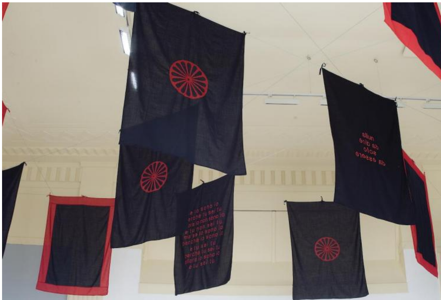
Nulla da dire solo da essere, 2004. Particolare dell'installazione 21 bandiere in tessuto di lana, tiranti in acciaio 180 x 130 cm ciascuna. Collezione Tullio Leggeri, Bergamo.