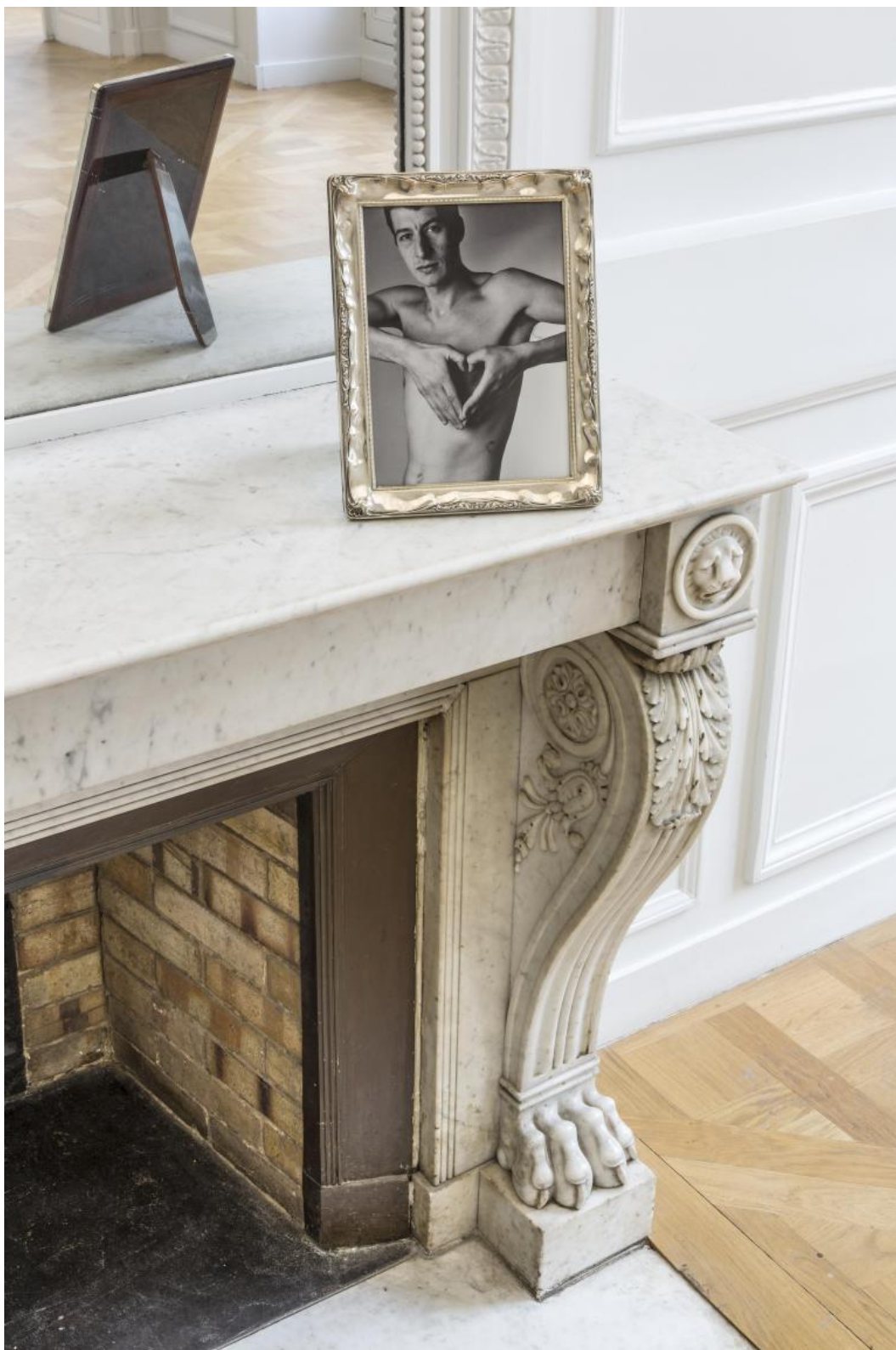
Maurizio Cattelan, Lessico familiare, ph Zeno Zotti.

Il film si apre e si chiude in modo circolare sulla mostra del Guggenheim. In apertura, si vedute di una New York innevata (è l'inverno del 2011), si sentono voci fuoricampo che fanno considerazioni sulla sua carriera: ha raggiunto notevole successo prima dei cinquant'anni; molti pensano che non sia altro che un truffatore esuberante con del senso artistico; la sua carriera si basa su aneddoti, bugie e storie inventate; in tutto quello che fa, c'è una base di verità e ci si chiede se si ritirerà per davvero... perché Maurizio non può smettere. E poi si susseguono immagini delle sue opere più provocatorie, su tutte La nona ora (1999), la famosa statua