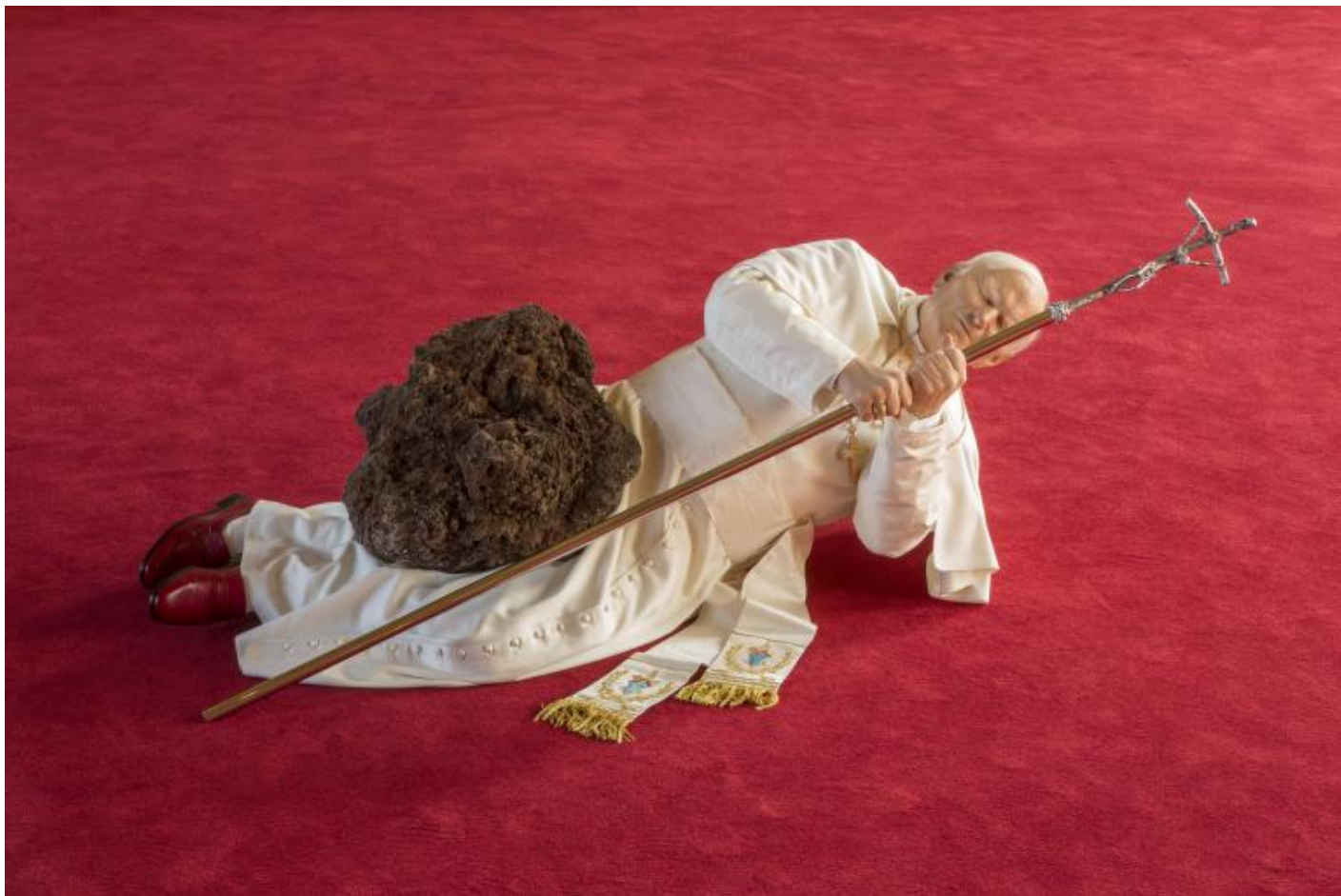
Maurizio Cattelan, La nona ora, 1999