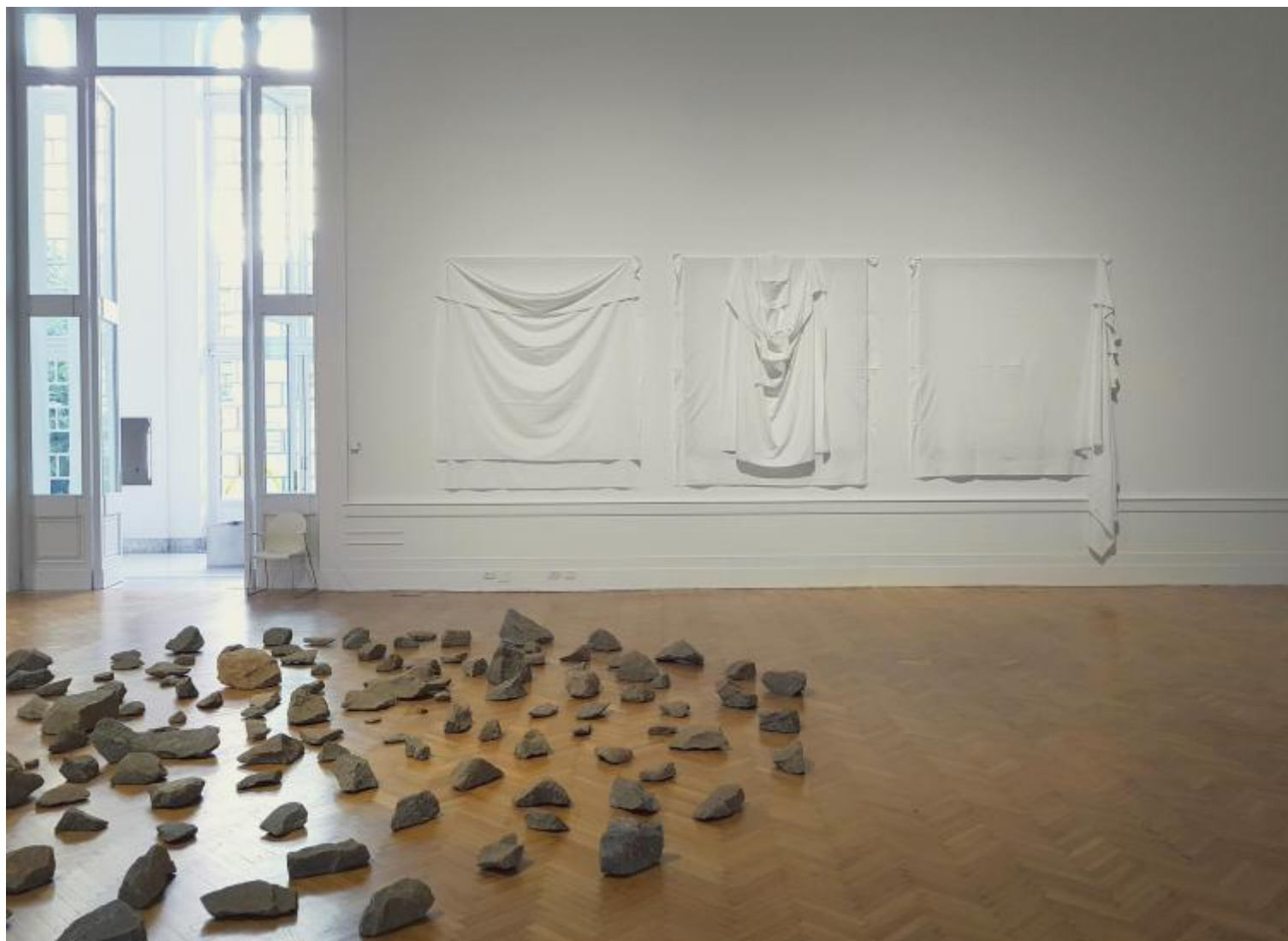
È solo un inizio. 1968, vista dell'esposizione

Le ricerche che tra Europa e America si diffondono alla fine dei Sessanta –solitamente rubricate sotto le etichette di post-minimalismo, di anti-form , di arte povera, concettuale o comportamentale – si presentano in effetti non solo come vittoriosi assalti alla presunta compattezza della narrazione modernista e formalista, al suo inflessibile appello alla specificità di segni, materiali, tecniche, ma anche come una rivendicazione di per sé politica che guardava alla ricomposizione della cesura arte-vita e alla possibilità di allineare le pratiche dell'arte a più ampi processi di trasformazione del mondo reale come a un orizzonte agibile e vitale per ogni operazione artistica.