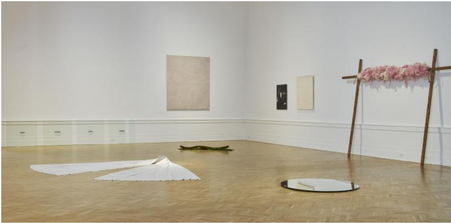
È solo un inizio. 1968, vista dell'esposizione

La deflagrazione di media e tradizioni espressive e l'avvento di un'arte risolta in "situazioni" e in processi di pensiero, nell'immateriale, nel performativo, può essere in effetti misurata nelle opere esposte alla Galleria Nazionale, tutte, per quanto diversi i loro contesti e motivazioni originali, scelte con evidente attenzione alla loro specifica qualità. Se ne possono ricordare qui solo alcune, tra cui quelle che in modi diversi riflettono sui dati plastici e fenomenici della scultura, come la struttura sospesa di Marisa Merz, Living Sculpture (1966), in cui tubi di alluminio sagomati e aperti compongono una forma sinuosa, organica, instabile, Tre modi di mettere le lenzuola (1968) di Luciano Fabro, che articola su tre identici telai altrettante e sottilmente evocative varianti sul tema del panneggio, o Fermacarte (con un passo) (1968) di Emilio Prini, che articola spazio concreto, tridimensionale, e spazio dell'"indice" evocato dalla fotografia posata a terra, o, a titolo ovviamente diverso, le opere di Eva Hesse, Joseph Kosuth e Hans Haacke (singolare invece, anche per la sua centralità nel periodo preso in esame, l'assenza in mostra di una figura quintessenziale come quella di Joseph Beuys).