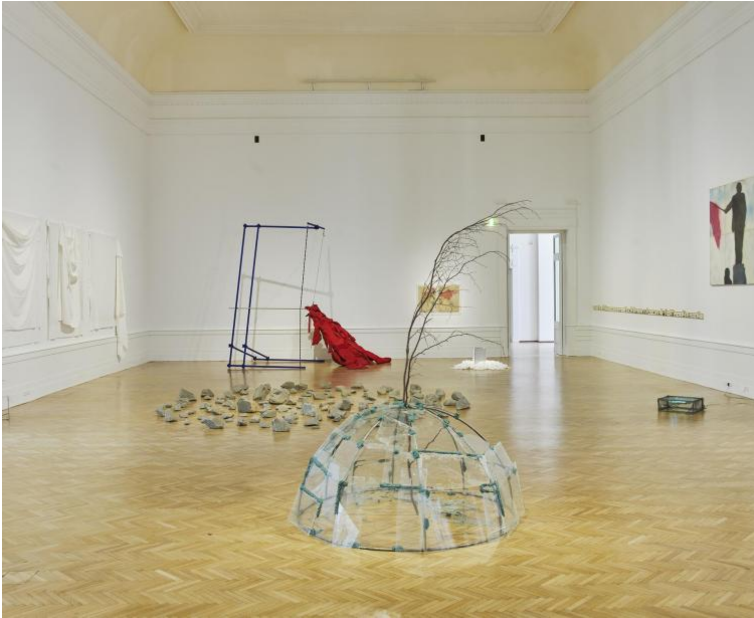
È solo un inizio. 1968, vista dell'esposizione

Questa scelta curatoriale, per molti versi controcorrente rispetto alla diffusa preferenza per ampie esposizioni tematiche dal ricco apparato storico-documentario, riflette almeno a prima vista la tonalità generale dell'attuale, controverso allestimento della Galleria nazionale inaugurato giusto un anno fa, Time is out of joint , in cui opere di collezione e prestiti compongono un mosaico che se appare agli antipodi del vecchio e polveroso ordinamento storico si dimostra sin troppo fiduciosamente affidato a superficiali corrispondenze tematiche o formali.