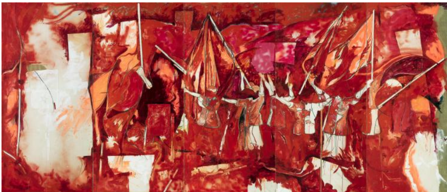
Mario Schifano, Festa cinese, 1968

Diversi sono i lavori iconici presenti nell'esposizione, alcuni dei quali diventati nei decenni successivi emblematici sia del momento storico che del percorso dei relativi autori, a partire da Festa Cinese (1968) di Mario Schifano, quadro sontuoso ed enigmatico dipinto per la casa romana dell'ineffabile Gianni Agnelli, all'ironica "scultura che mangia" (1968) di Giovanni Anselmo, due blocchi di granito tra cui è inserito un cespo di lattuga fresca, alla "carboniera" Senza titolo (1967) di Jannis Kounellis, con il suo contrasto tra la complessa stereometria del recipiente metallico e l'informe, sfaccettata e oscura potenza del carbone, al vertiginoso Autoritratto di Giulio Paolini nelle vesti di Nicolas Poussin citato attraverso un doppio riporto fotografico (1968), sino al fragile, straordinario Acqua scivola (Igloo di vetro) di Mario Merz (1969), una delle opere più emblematiche della mostra (fu presentata tra l'altro a When Attitudes... nel 1969), con le sue lastre di vetro precariamente saldate con mastice da vetraio il cui odore penetrante è forse una delle presenze più inattese e rivelatrici di tutta la mostra.