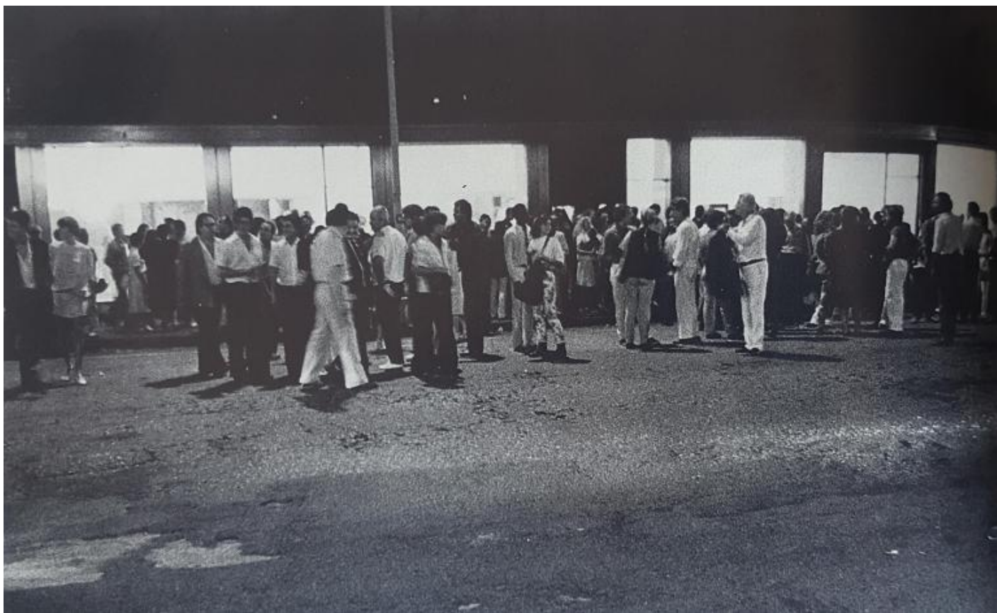
Inaugurazione della mostra Memphis, the New International Style, nello showroom Arc '74 di Mauro e Brunella Godani, Milano, Corso Europa, 2, 18 settembre 1981.

La piccola storia che ancora si ignora, perché rimasta nascosta tra le pieghe di quella più grande e più nota, concerne il luogo in cui questo manipolo di audaci sperimentatori dell'impossibile, del fantasioso e dell'inconsueto, del finalmente policromo dopo la monocromia razionalista, mise in atto materialmente molte delle proprie creazioni di Contro Design . A spiegare il concetto di Contro Design è lo stesso Sottsass nel catalogo della mostra allestita nel 1983 al Philadelphia Museum of Art, intitolata " Design since 1945 ":