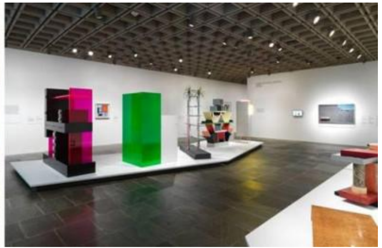
Ettore Sottsass: Design Radical, New York, Met Breuer.