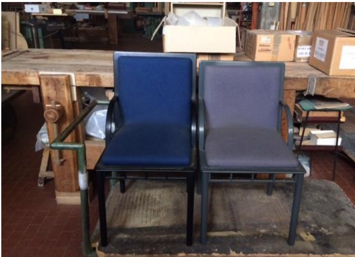
Nel laboratorio dei Pierluigi Ghianda: secondo e terzo prototipo della sedia Bridge di Ettore Sottsass (si notino le differenti altezze dello schienale).