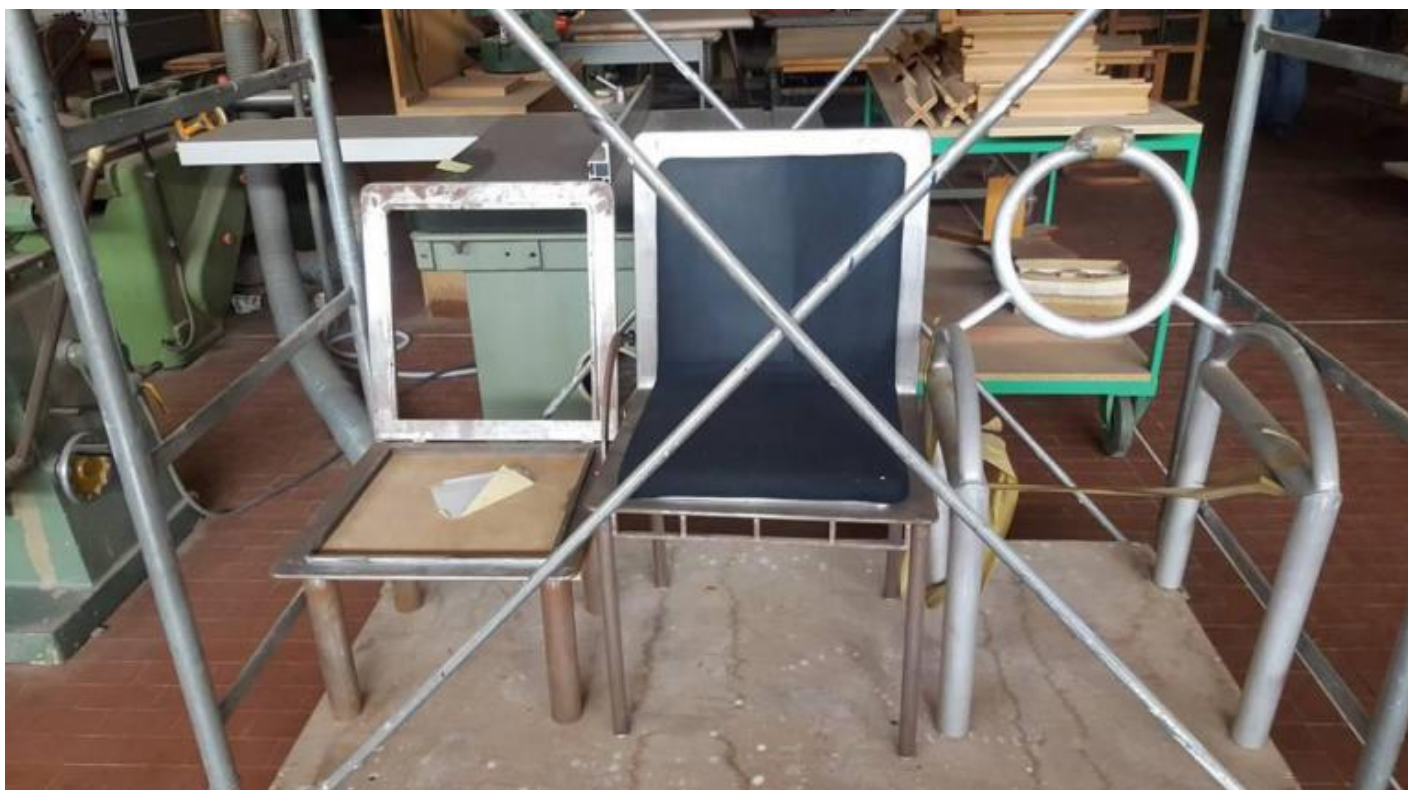
Nel laboratorio dei Pierluigi Ghianda: i primissimi prototipi di una sedia pieghevole di Marco Zanini (mai entrata in produzione); primo prototipo della sedia Bridge di Ettore Sottsass; primissimo prototipo della sedia First di Michele De Lucchi.