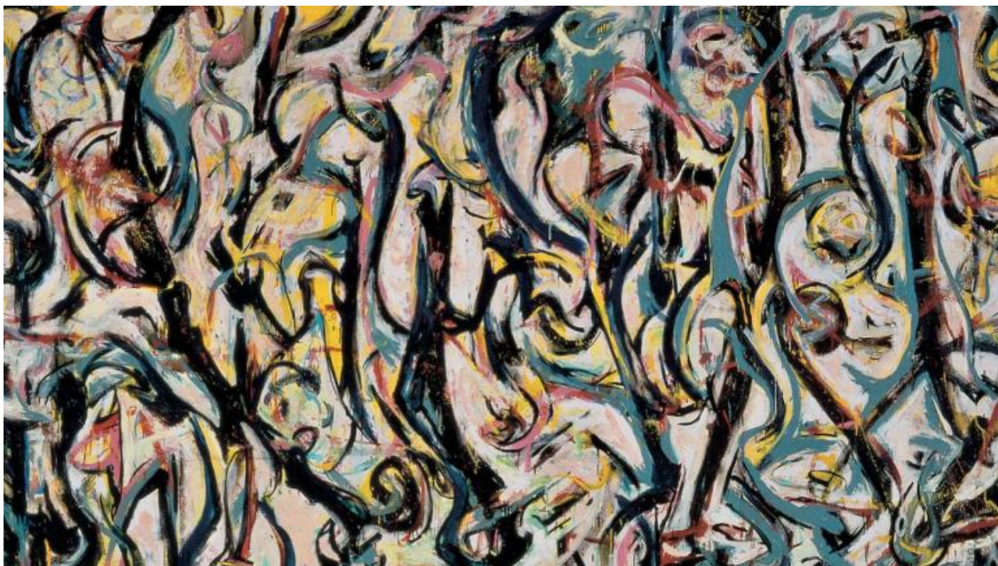
Pollock, Murale (1943).

Resta aperta la terza e ultima opzione. Forse il teatro è colto tramite l'azione congiunta dei sensi e della mente. Le considerazioni svolte prima circa l'esperienza sinestetica dell'immaginare che «gli occhi sono ora nella punta delle dita» alludono al fatto, del resto, che una qualche relazione deve instaurarsi tra sensazione e intellesione. Anche la constatazione che almeno la mente umana (forse non quella divina, se c'è) abbia bisogno dei sensi per poter operare in maniera speciale sembra indicare che è proprio qui che va cercata una soluzione al problema oggetto di questo studio. Ne segue, forse, che l'esperienza del teatro sia realmente un'esperienza sinestetica. È, forse, un processo guidato dalla mente che, tuttavia, non cerca concetti o la verità / la falsità di alcuni enunciati sul mondo, bensì consente di guidare e affinare i sensi in direzioni percettive inedite.