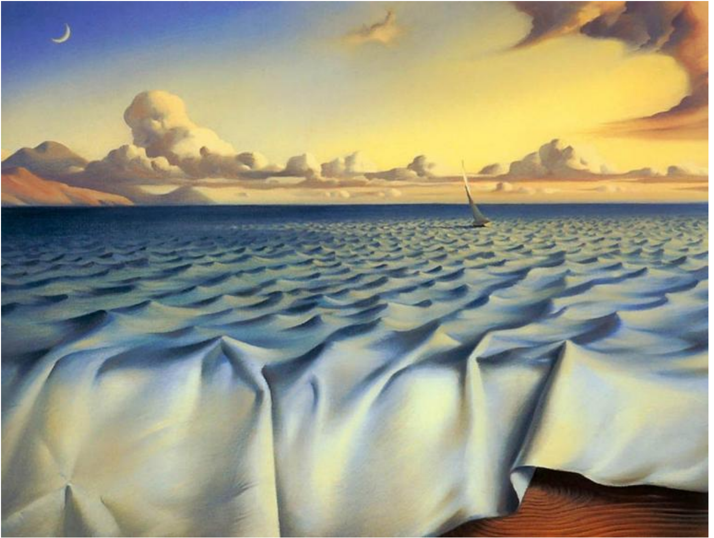
Kush, Ripples on the Ocean.

esempio, un gatto con le ali) e, al tempo stesso, crede con la mente di vedere questo stesso qualcosa (appunto, che un gatto con le ali esiste e vola di fronte a lui). La conseguenza di tale abbattimento di confini è che non è più possibile dire che sensi e intelletto entrino in una relazione particolare, quando ci immergiamo nell'esperienza teatrale. Queste nostre due parti semplicemente diventano una cosa sola, sicché il meccanismo di avvertimento del teatro – che pareva essere risultato comprensibile – ritorna di nuovo inesplicabile. Infatti, con questo paragone col fenomeno onirico, si ripete sotto altra forma la tesi che il teatro si coglie tramite una forma di percezione integrale, ossia si ricade in tutte le difficoltà prima ricordate.