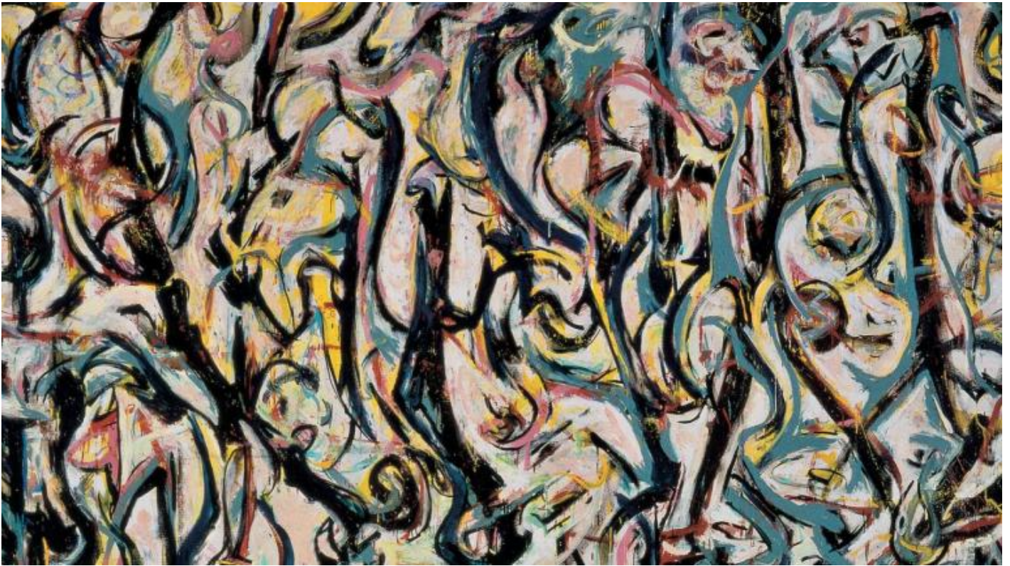
Pollock, Murale (1943).

Resta aperta la terza e ultima opzione. Forse il teatro è colto tramite l'azione congiunta dei sensi e della mente. Le considerazioni svolte prima circa l'esperienza sinestetica dell'immaginare che «gli occhi sono ora nella punta delle dita» alludono al fatto, del resto, che una qualche relazione deve instaurarsi tra sensazione e intellesione. Anche la constatazione che almeno la mente umana (forse non quella divina, se c'è) abbia bisogno dei sensi per poter operare in maniera speciale sembra indicare che è proprio qui che va cercata una soluzione al problema oggetto di questo studio. Ne segue, forse, che l'esperienza del teatro sia realmente un'esperienza sinestetica. È, forse, un processo guidato dalla mente che, tuttavia, non cerca concetti o la verità / la falsità di alcuni enunciati sul mondo, bensì consente di guidare e affinare i sensi in direzioni percettive inedite.