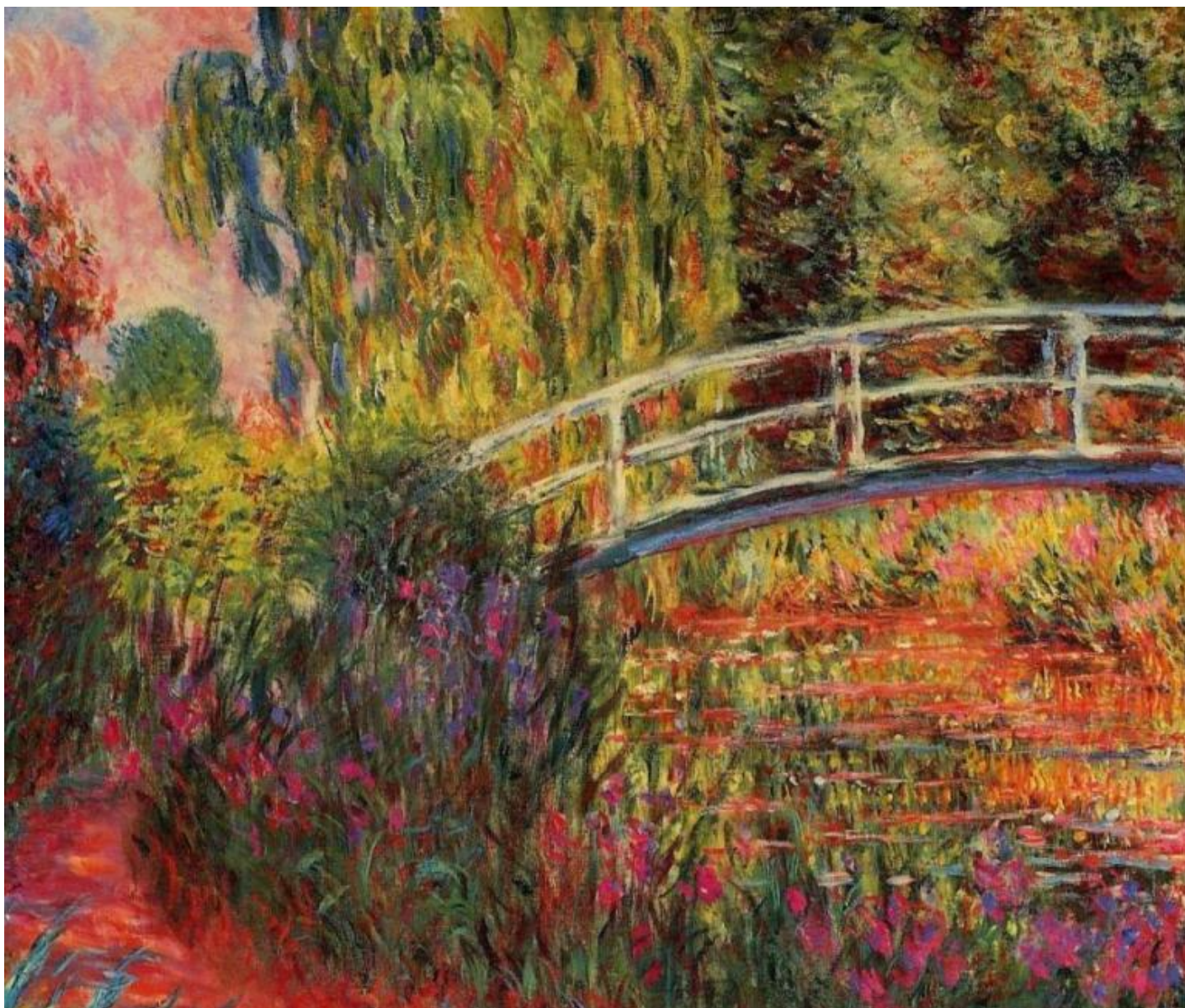
Monet, Ponte giapponese.

Il filo di Arianna di Vargas mette però in guardia dalla facile risposta che sia la pura sensazione a mettere in contatto con la bellezza dell'arte teatrale. Ciò può sembrare un'affermazione paradossale o persino errata, quando riferita a un artista fondatore di un "teatro dei sensi". Eppure, il punto emerge in modo piuttosto chiaro dalla semplice circostanza fisica in cui è calato lo spettatore dello spettacolo di Vargas. Esso si trova collocato nell'oscuro e silenzioso labirinto di Minosse, ricreato appositamente nelle sale del Centro Culturale Il Funaro di Pistoia. Ora, il contatto con il buio e con il silenzio comporta, nello spettatore coinvolto, una sospensione di vista e udito: il teatro nello spettacolo di Vargas non passa, pertanto, per il tramite esclusivo di questi due sensi. Ma una sorte migliore non arride nemmeno a gusto, olfatto, udito, che pure sono usati generosamente e con delicatezza in Il filo di Arianna . Vi sono momenti in cui essi dominano il mondo sensoriale dello spettatore.