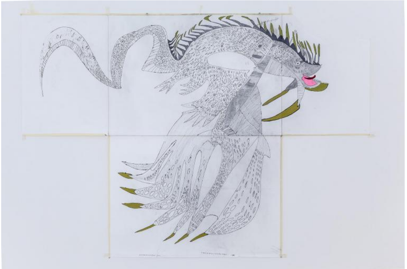
Drago medusa palline in testa, 140x200, 2015, Giorgia, Atelier dell'errore.

Il primo anno si sedeva e disegnava sempre e solo ciò che voleva lei, come diceva lei, per il tempo e con i materiali che decideva lei. La sua mano però, nel disegno è una mano assoluta , fin da quando l'ho vista all'opera la prima volta. Il suo enorme limite , tipico: un accanimento incontrollabile e irrefrenabile del segno fino a sfinire il foglio, in mesi e mesi di lavoro. Ricami che torcendosi su se stessi, alla fine cancellavano ogni forma, ogni intenzione.