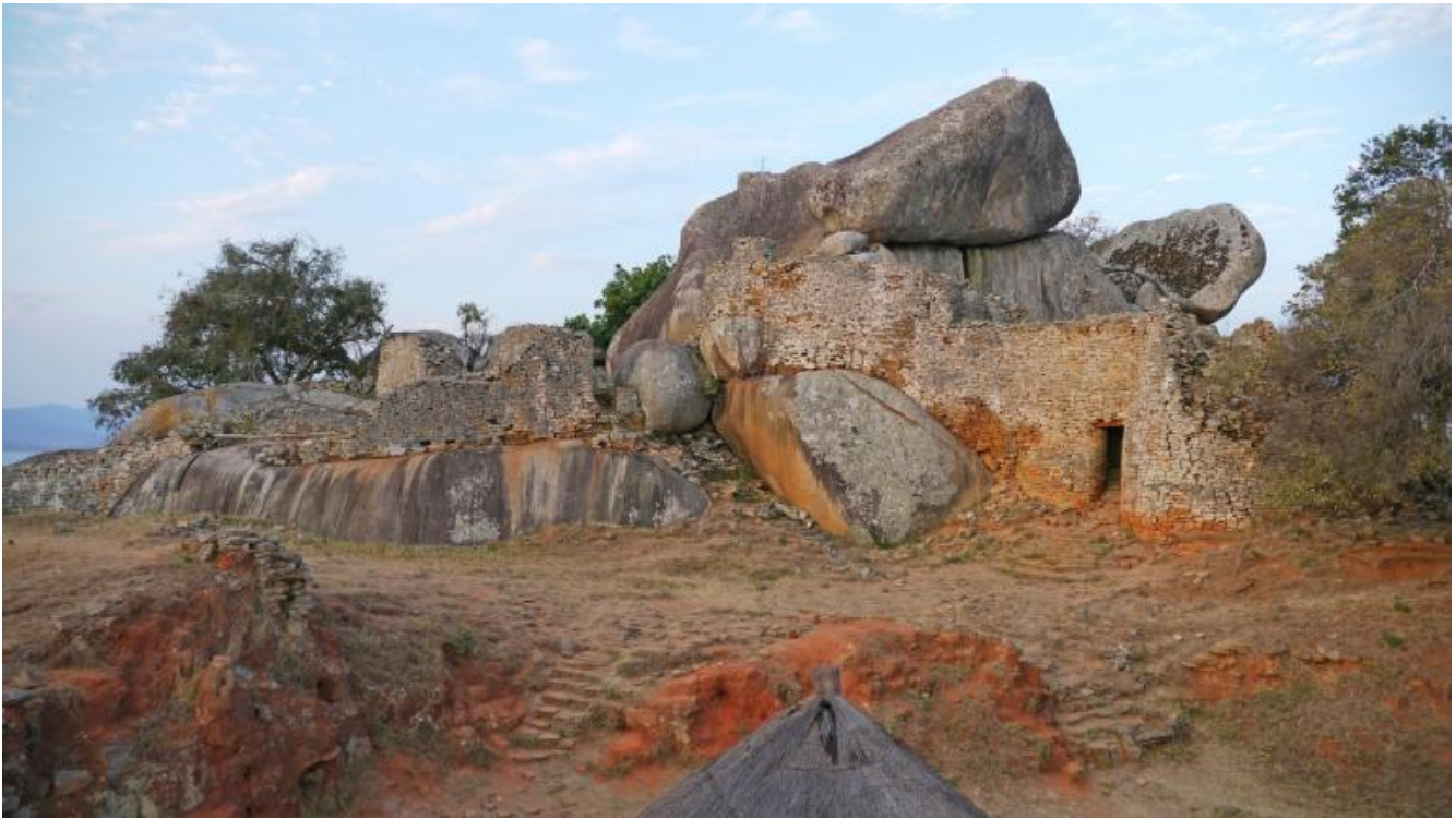
Great Zimbabwe, ph Simba Mafundikwa.

Gli ambulanti che su Robert Mugabe Road occupano un terzo della strada con i carretti della frutta sono solo uno degli ostacoli che i guidatori devono schivare alle 5 del pomeriggio, durante la terrificante ora di punta. Da qui la domanda: gli abitanti dello Zimbabwe possiedono un senso dello spazio?