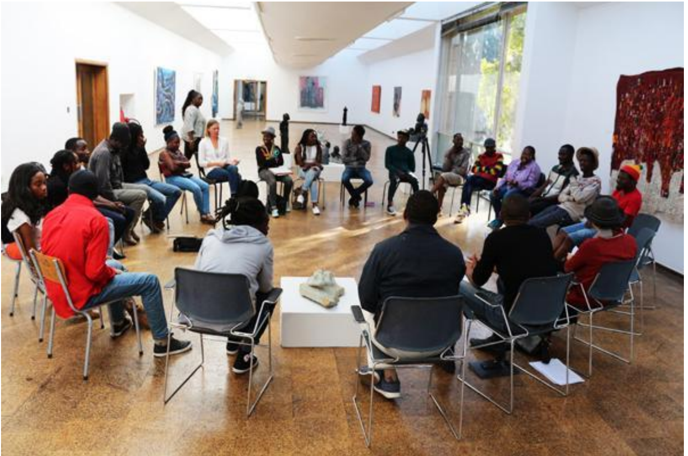
AtWork Harare, workshop at the National Gallery of Zimbabwe.

Non si contano le volte in cui, trovandomi in fila, ho avvertito il fiato di un altro sul collo, il suo petto contro la schiena. Di solito basta uno sguardo per farlo indietreggiare, ma quando invece ti fissa stupito con sguardo innocente, ti fa passare per strano solo perché non vuoi che il tuo spazio personale sia occupato da un perfetto sconosciuto.