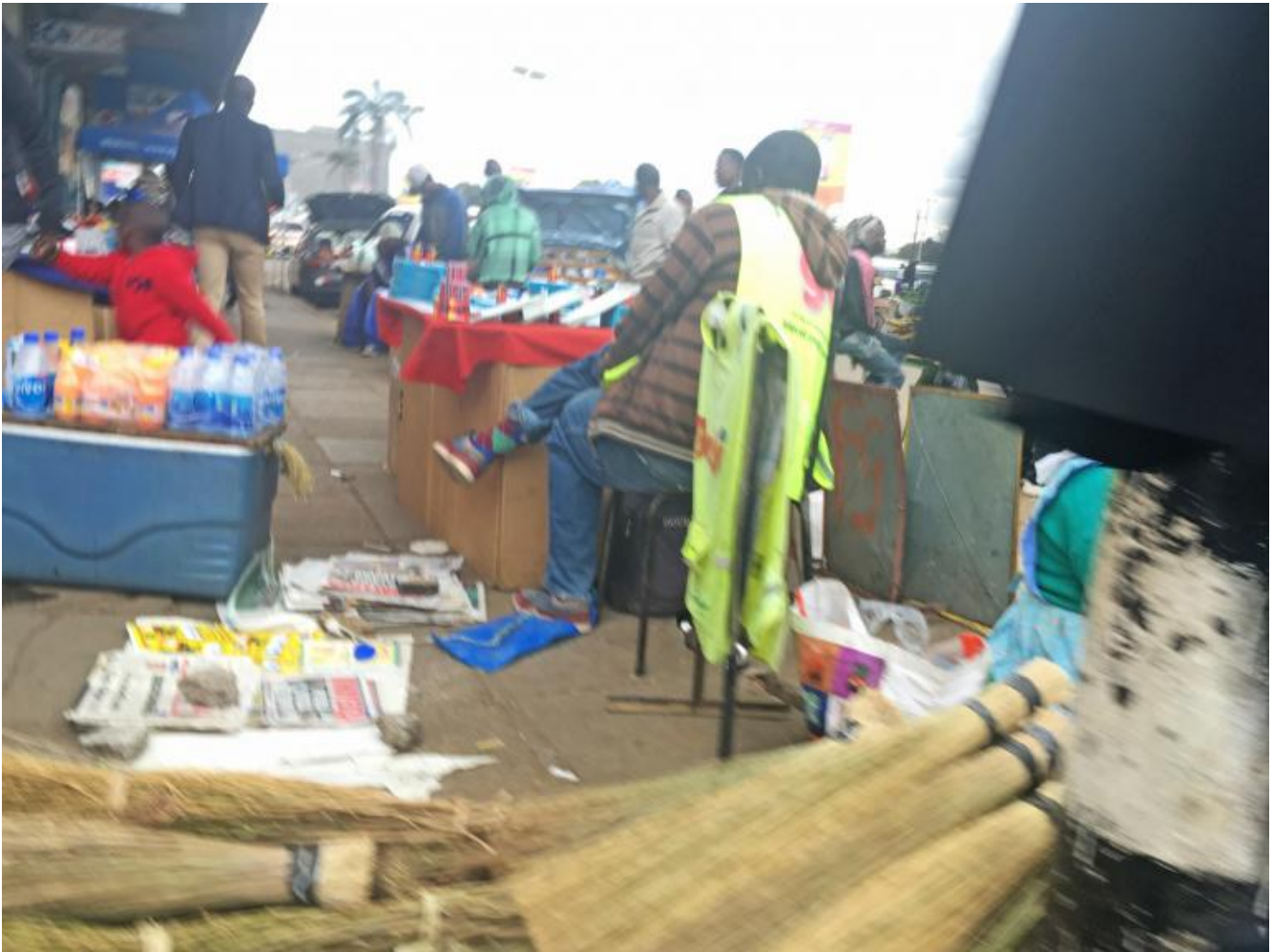
Harare city, ph Simba Mafundikwa.

Ciò che si vede oggi nel centro della città è una distorsione di questa concezione dello spazio. In una situazione economica in cui il denaro scarseggia, molti si sono dati al commercio, occupando spazi liberi, marciapiedi e strade. Se da un lato questo ha portato ad avere prodotti agricoli e vestiti a buon mercato, dall'altro ha generato una totale assenza di regole, per cui parcheggiare - ad esempio - può diventare un incubo. L'abbondanza di spazio si è trasformata in una forma di sfruttamento spaziale che è incompatibile con territori ad alta densità abitativa.