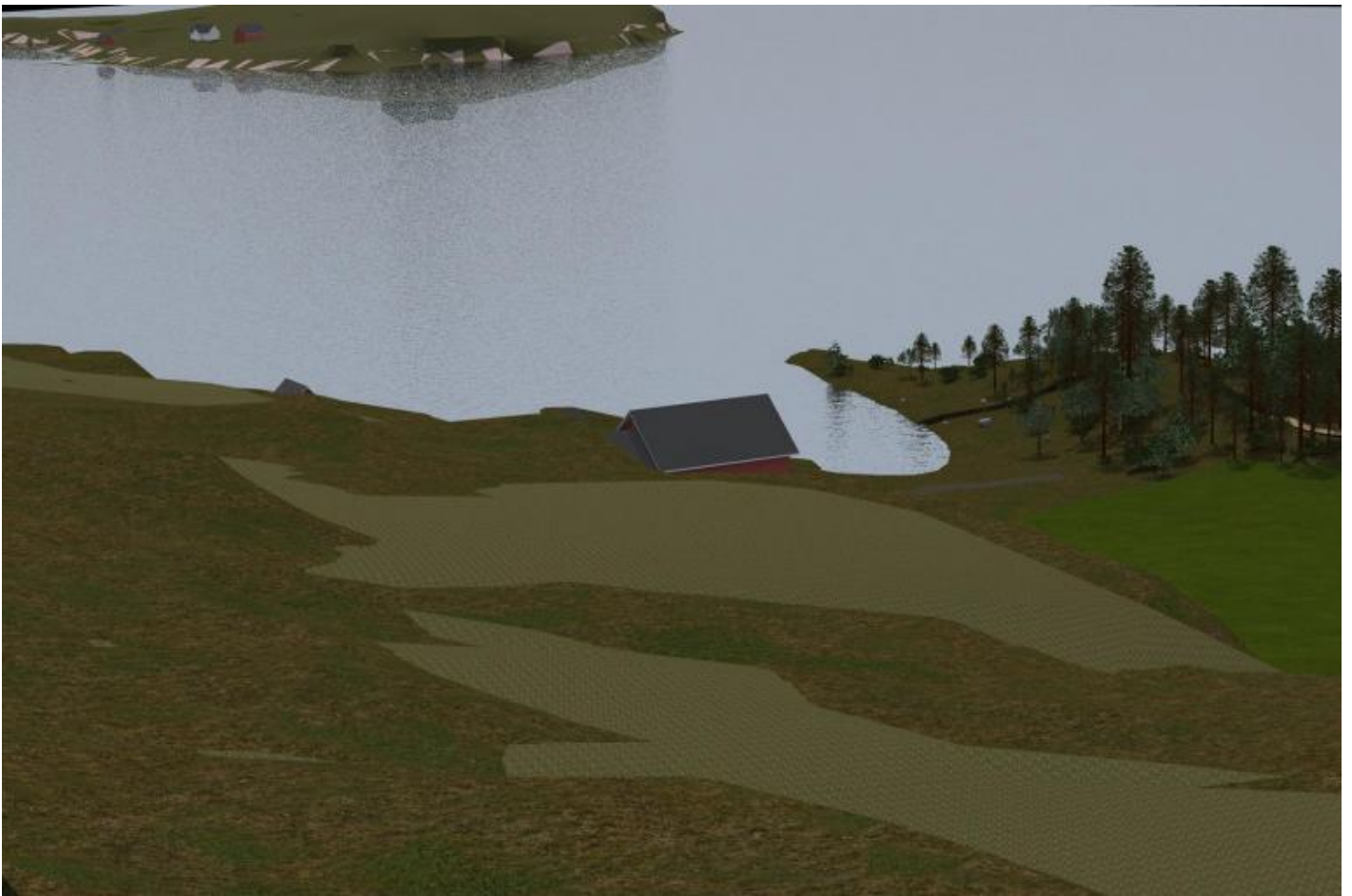
Sorbraten dall'alto, progetto.

Ferita indelebile, cicatrice per sempre aperta, Memory Wound è un gesto artistico che ostacola il processo naturale di auto-guarigione e ricrescita immemoriale. Con i mezzi artificiali propri alla Land art, Memory Wound genera un trauma insanabile, una voragine irreversibile, uno sventramento che la natura non potrà riassorbire. "Il taglio è un riconoscimento di quanto resterà per sempre insostituibile", "un taglio nella natura stessa. Riproduce l'esperienza fisica della sottrazione, riflettendo la perdita brusca e permanente di coloro che sono morti". "Una rottura o un'interruzione poetica", precisa ancora Dahlberg, che fa coesistere la bellezza inerente del paesaggio col senso di perdita. "Sarà questo senso di perdita che attiverà fisicamente il sito".