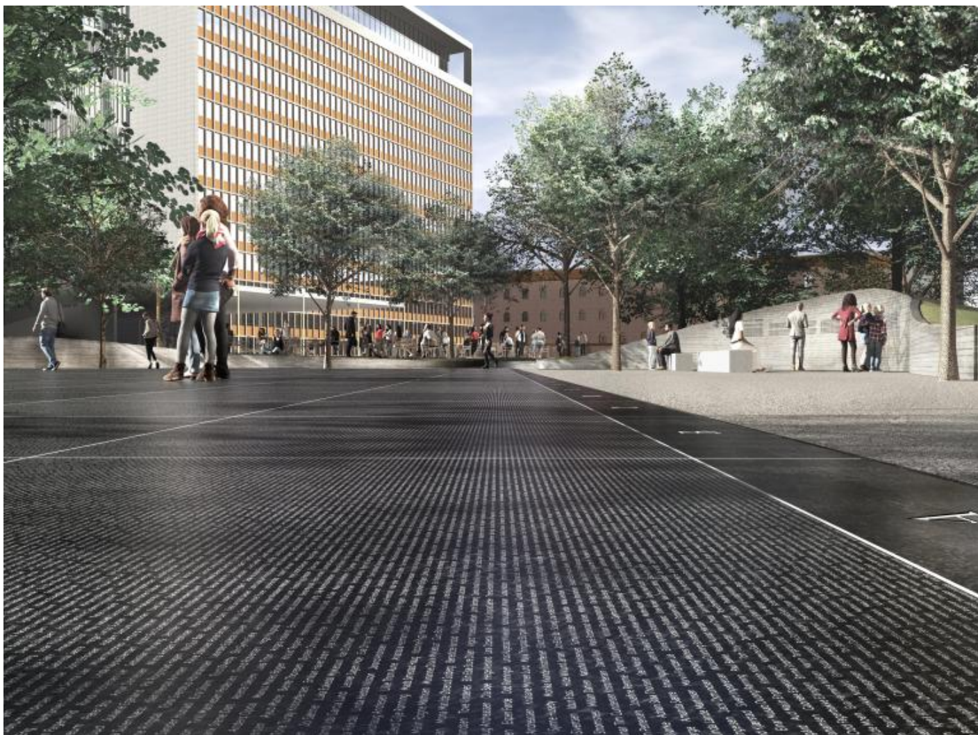
Progetto del Memorial di Oslo.

Il memoriale è insomma un forum indirizzato e dedicato non solo a chi ha perso la vita ma all'insieme della comunità e alle loro responsabilità nel processo testimoniale e memoriale. I nomi delle vittime sono resi riconoscibili da uno spazio vuoto che li incornicia, considerato poeticamente come una nuvola, un cuscinetto d'aria o un respiro che si fa materia. "Riconoscere il vostro nome inciso sulla pietra vuol dire diventare consapevoli che esistevi il 22 luglio 2011; il fatto che sei in grado di recarti qui e di cercare adesso il tuo nome, attesta che sei ancora in vita".