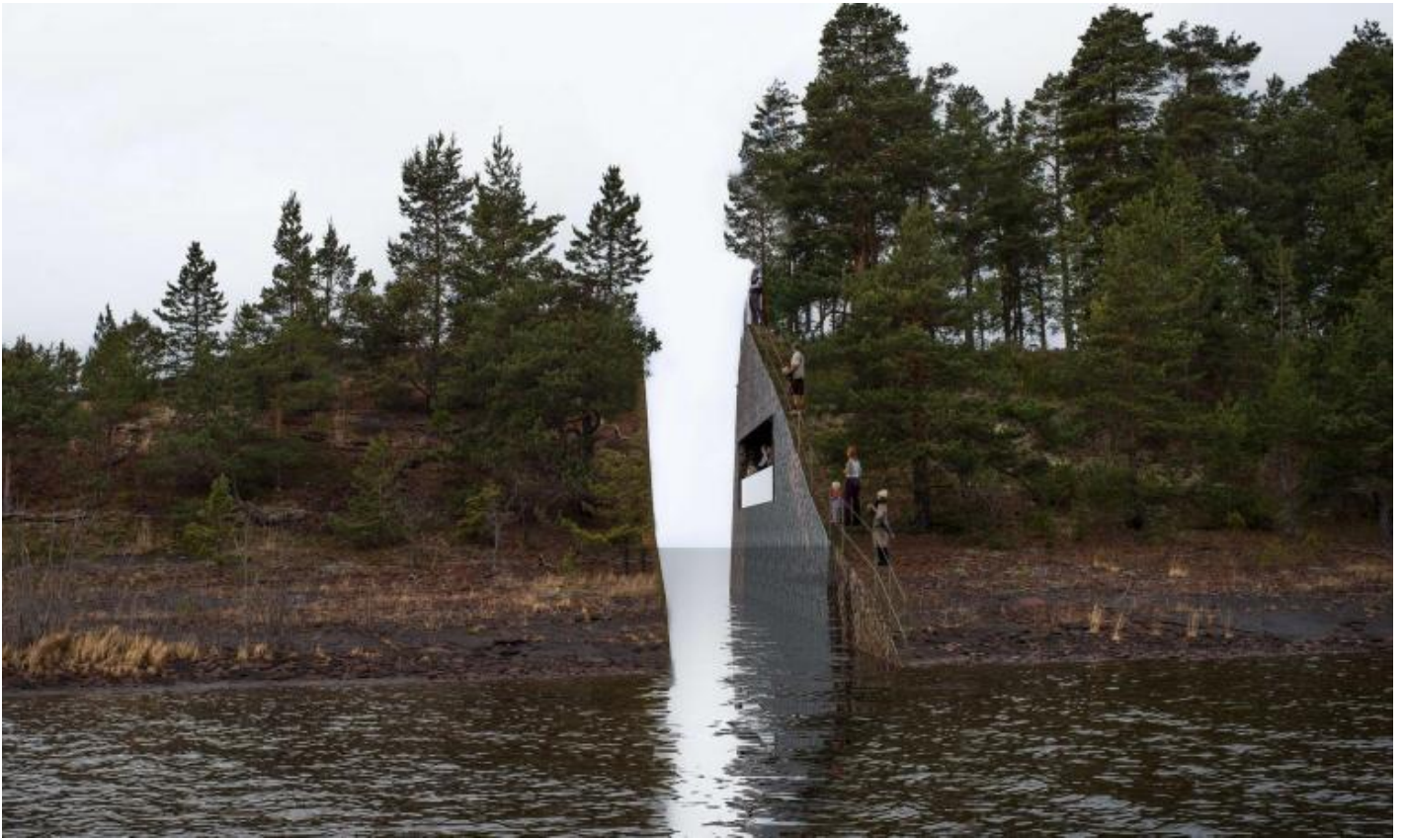
Progetto del Memory Wound.

Ergere un muro forse? o, al contrario, renderlo così discreto da lasciarlo inabissarsi nel terreno? Un memoriale in negativo, in cui del muro non resta che una cavità. Alla commissione Dahlberg finisce per sottoporre un progetto insolito: tagliare, dall'estremità della penisola Sørbråten, una fetta di terra lunga quaranta metri e larga tre, un'area di circa 4000 metri quadrati. Per arrivarci immagina un percorso – forse un tentativo di narrativizzare la memoria traumatica – che, dal parcheggio, attraversa il bosco con curve dolcemente sinuose, fino a un tunnel che si arresta bruscamente sul taglio. I nomi delle vittime sono incisi sull'altro lato del promontorio, visibili e leggibili da chi si è spinto fin qui ma per sempre irraggiungibili. Un senso di impotenza che inscena, spazializza l'esperienza della perdita.