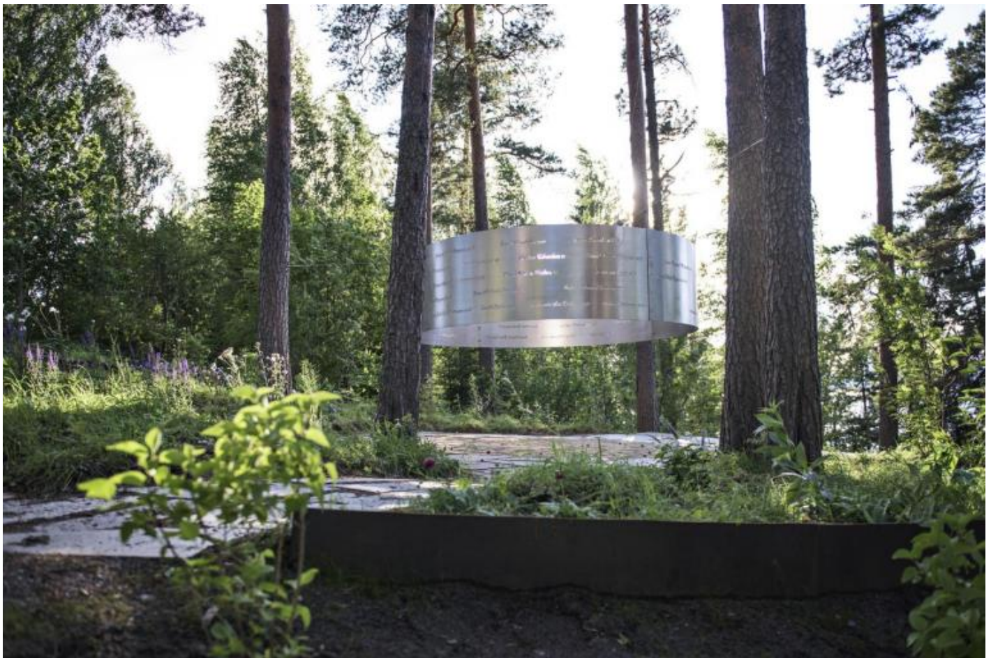
Memoriale sull'isola di Utøya.

Ora, Memory Wound non appartiene propriamente a questa casistica, in quanto pensato non per l’isola di Utøya ma per il promontorio di Sørbråten. Dahlberg si allontana dal sito del trauma, dis-identificando, sebbene con una minima traslazione geografica, spazio ed evento, muovendosi in sostanza, ecco il secondo spostamento, dal sito al luogo . E’ il risultato, forse il compromesso, tra due esigenze specifiche: da un parte, non dimenticare quanto è accaduto sull’isola di Utøya, non ricordarsene solo il 22 luglio in occasione dell’anniversario; dall’altra, rispettare la sacrosanta volontà dei locali di continuare a vivere, così come quella dei giovani di riappropriarsi dell’isola senza trasformarla in un cimitero inviolabile.