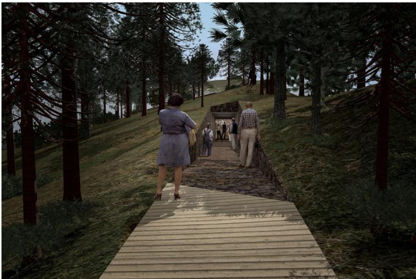
Progetto della passeggiata verso Memory Wound.

La terra divelta – 1000 metri cubi di pietra, alberi e piante – sarà la materia di un secondo memoriale al centro amministrativo di Oslo dove, poco prima della strage sull'isola, un'autobomba innescata da Breivik fece otto vittime. Dahlberg intende incidere, su circa duemila piastrelle nere e in ordine sparso, non solo i nomi delle 77 vittime dell'attacco ma quelle di tutti i cittadini norvegesi registrati all'anagrafe quel fatidico 22 luglio 2011. Si tratta di più di cinque milioni di norvegesi, cinque milioni di testimoni di quanto accaduto. Nella piazza di Oslo manca il nome del terrorista, in accordo e rispetto verso i familiari e gli amici delle vittime.