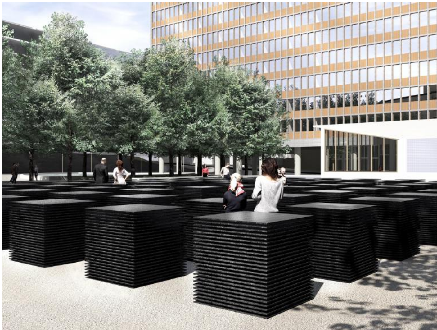
Progetto del Memorial di Oslo.