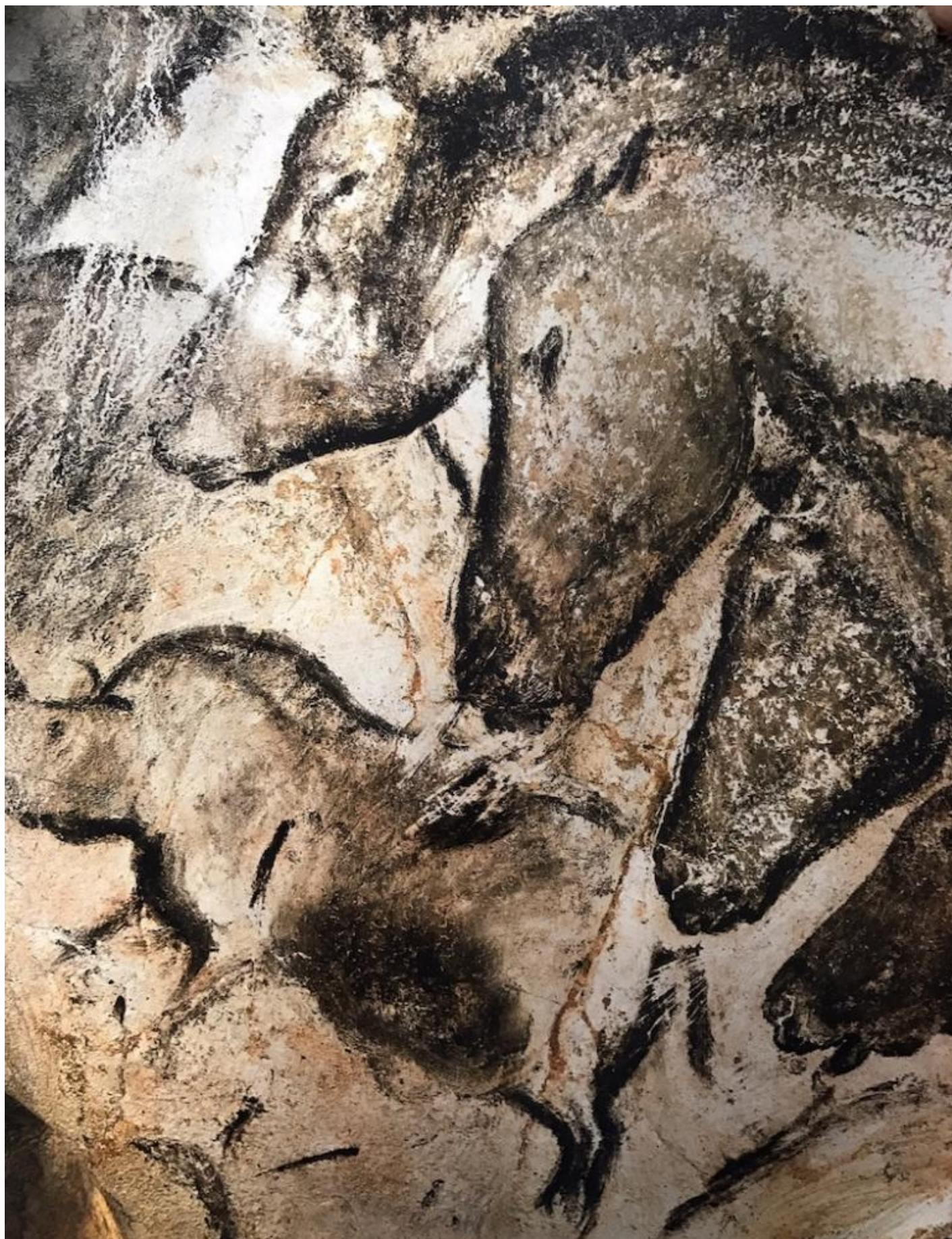
Grotta di Chauvet, Gruppo di cavalli.