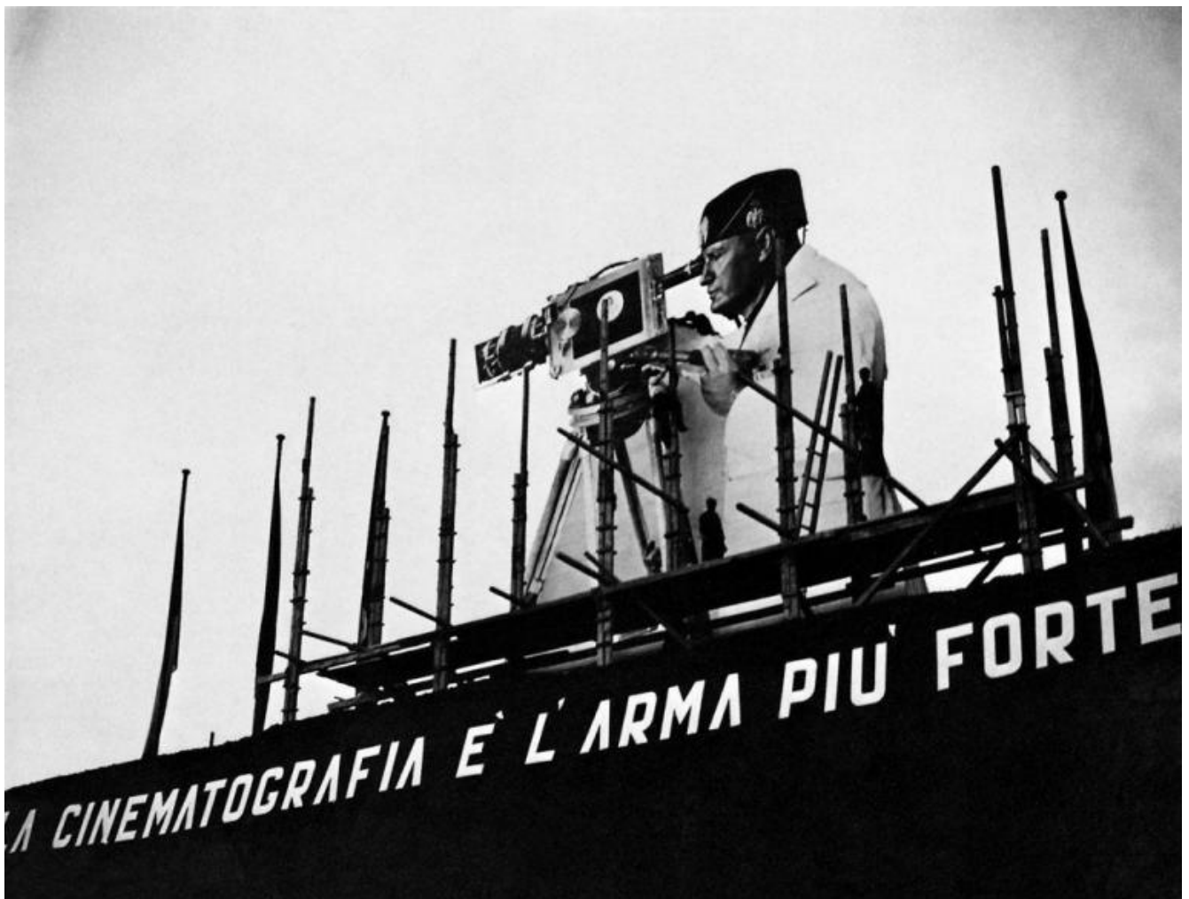
1928_Tripolitania_cinema ambulante Luce - immagine tratta da Angelo Del Boca, L'impero del fascismo nelle fotografie dell'Istituto Luce (2002).

propaganda fascista, in cui la fotografia e i film (si pensi a Scipione l'Africano, girato da Carmine Gallone nel 1937) sono stati i mezzi protagonisti, ha contribuito a creare «l'Italiano Nuovo» effettivo. Tale propaganda ha determinato altresì il processo attraverso cui l'Italia, al pari delle altre potenze europee, ha cominciato a riconoscersi «bianca» e a «razzizzare» se stessa. L'esotismo, se non tollerato dall'Impero, quantomeno era trattato come prezioso oggetto etnografico. Un oggetto ferito da un primitivismo sanguinario fondato su basi razionali e scientifiche, dunque invisibile: cancellato dalla propaganda prima e dai suoi rentier poi.