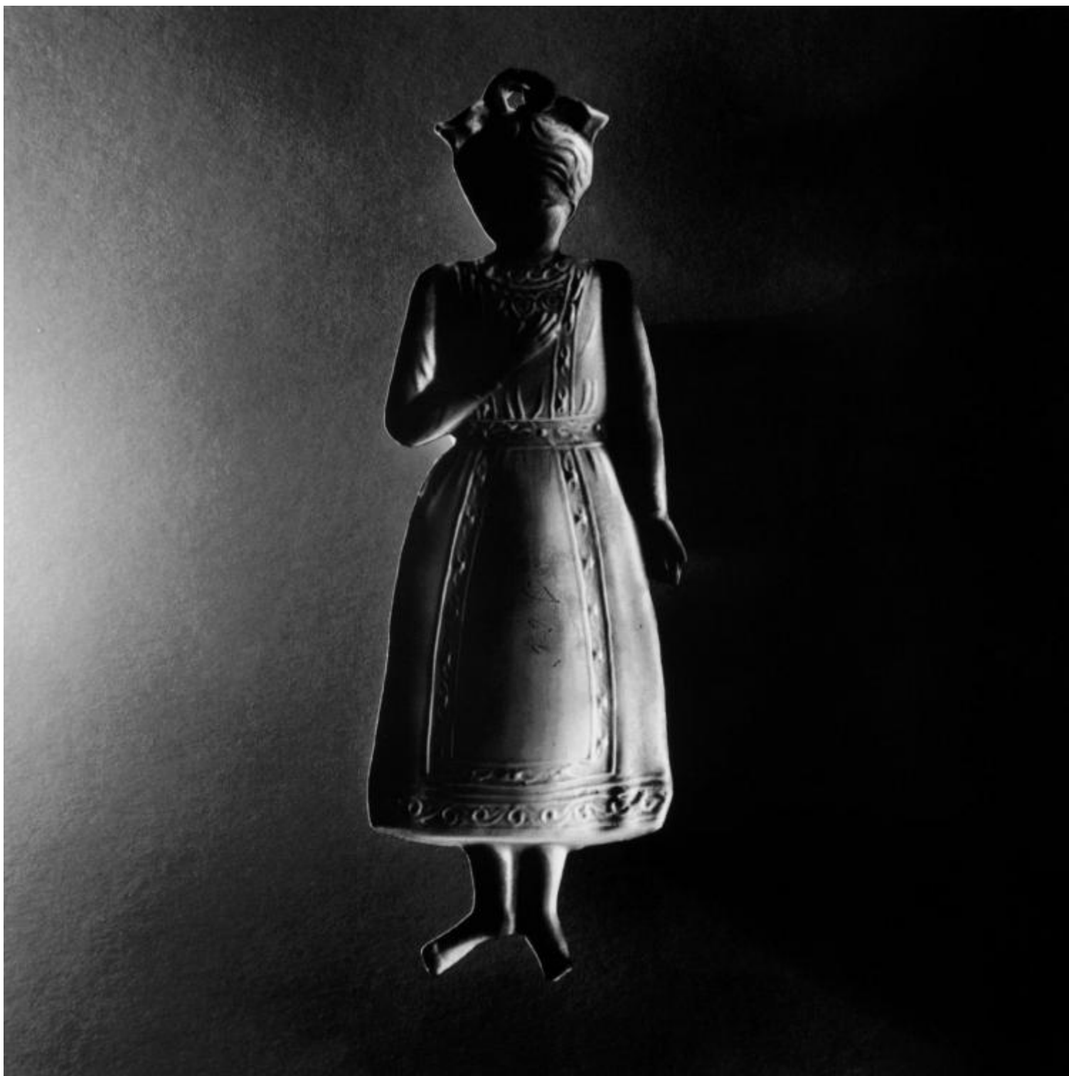
Antonio Biasiucci, Ex Voto, Napoli, 2006.

È questo il rito di cui narra la mostra: “essere vicini nella sostanza delle cose”, come racconta Biasiucci, a proposito di un altro suo lavoro. E la sostanza delle cose è la medesima materia con la quale sono fatte e il rito con cui prendono forma. Fotografare significa condurre ogni soggetto all’istante della nascita, raccontare la storia della sua evoluzione e contemporaneamente conservare la traccia dell’origine nelle sue forme. “Io compongo tomi” dice Biasiucci, “mi servo della fotografia per tentare di scrivere un alfabeto dell’umanità, scegliendo i soggetti che ritengo fondamentali, le vacche, i pani, i vulcani”. Nulla è più identificabile, nulla appartiene ad una tradizione visiva imposta e assimilata, come il linguaggio che ereditiamo e che si sedimenta dentro di noi. Tutto può essere reinventato.