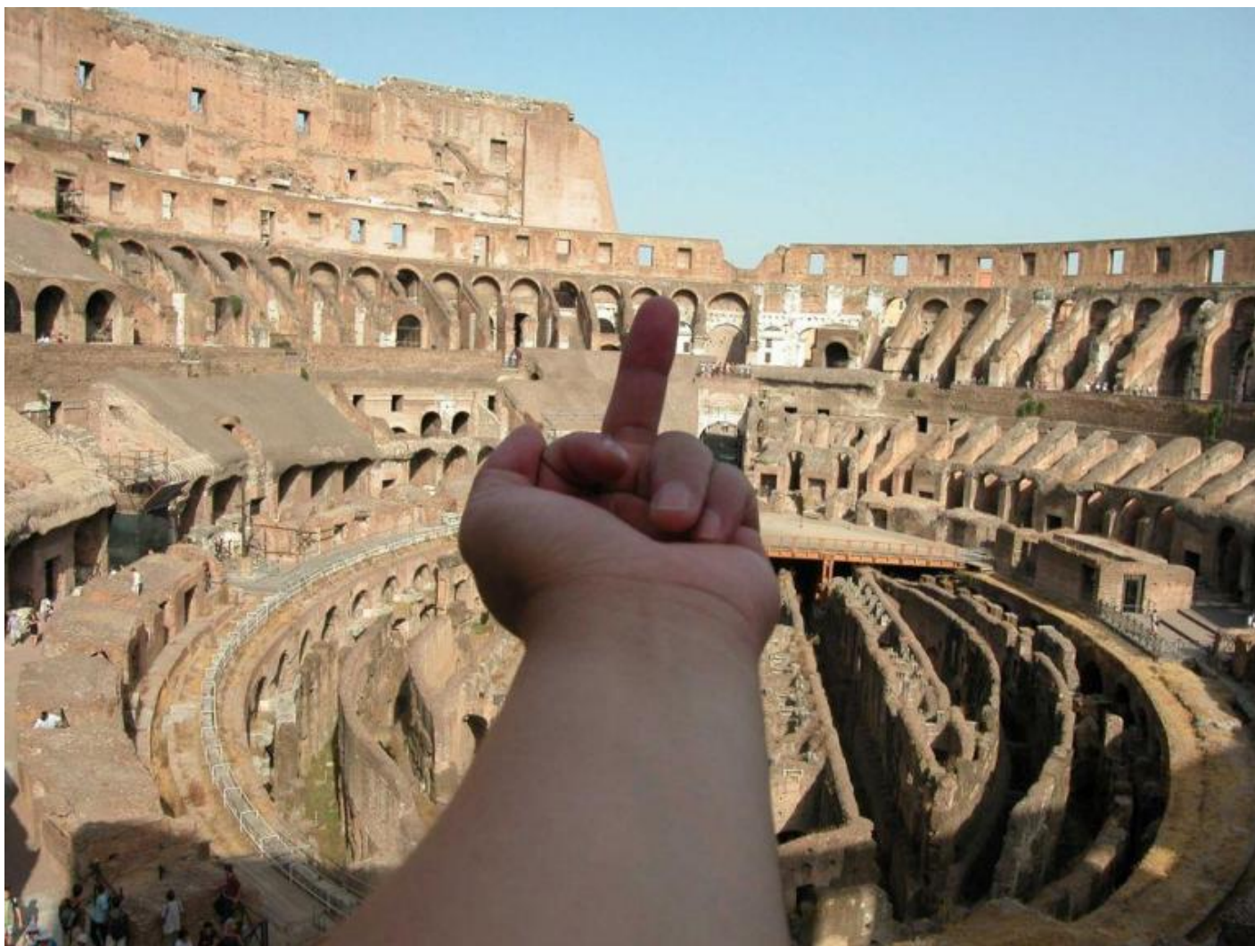
Ai Weiwei, Study of Perspectives series.

Non è però questo il gesto compiuto dai turisti in visita alla mostra. Giunti all'ingresso piegano il braccio per un selfie davanti alla superficie specchiante inserita in un pannello dell'allestimento espositivo. Anziché distenderlo come nel classico selfie per abbracciare anche il contesto nel quale si trovano, lo piegano. In questa piega s'annida l'insidia del ripiegamento su se stessi, che trova una sua cifra nel film La grande bellezza di Paolo Sorrentino proiettato su una delle volte dell'Anfiteatro Flavio, insieme ad altri film nei quali il Colosseo si staglia come sfondo. Dall'alto dell'Anfiteatro Flavio, l'eroe protagonista nel film Lo chiamavano Jeeg Robot diretto da Gabriele Mainetti balza sulla città per salvarla dal degrado fisico e morale.