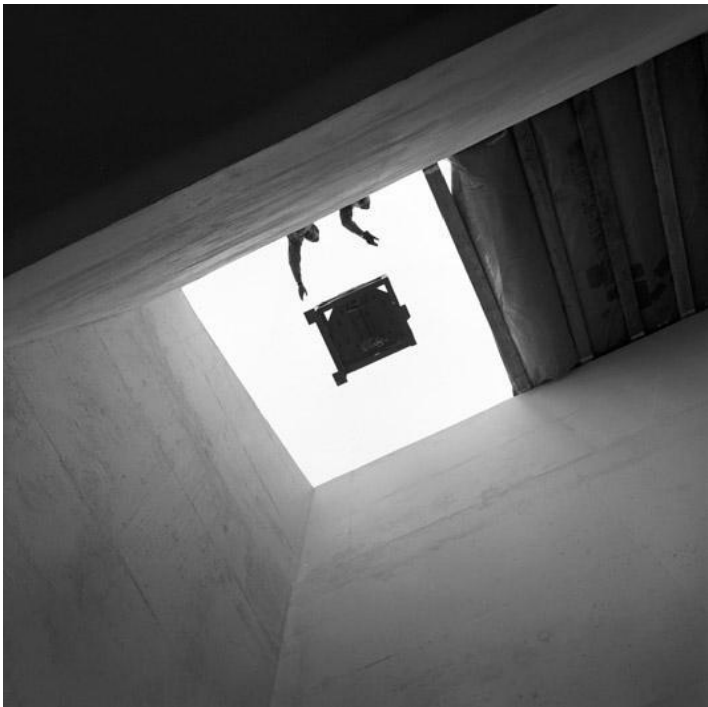
David Fathi, Untitled, 2016, Manipolazioni dell'artista, immagini originali dal CERN Archive.

Emerge così un senso di straniamento portato dal medium dello humour, che indaga le idee astratte e le domande della scienza attraverso quelle “piccole storie assurde” che hanno preso vita dalle sue manipolazioni sulle fotografie dell’archivio, mostrando i limiti della conoscenza umana. Fathi lavora sulla reinvenzione della realtà, agisce entro uno spazio di confine tra l’empirismo e la metafisica, tra oggettività e incontrollabilità, tra la ricerca rigorosa della scienza e le emozioni, tra l’esplorazione e la conoscenza, tra la sfera privata e quella sociale, in uno stato tra la vita umana e ciò che potrebbe essere altrove.