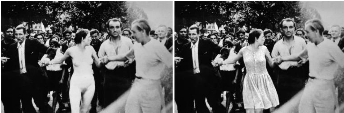
Agnès Geoffray, Libération I-II, 2011, From the 'Incidental Gestures' series Inkjet print on museum paper, diptych

Oppure enfatizza la dimensione drammatica di una scena banale: una donna con la schiena a ponte sembra in stato di trance, nella posizione della isterica, e pare evocare anche la danza estatica e dionisiaca di una menade; il volo nel vuoto di un trapezista, sospeso dinnanzi alla sparizione di una barra ad altalena che non potrà afferrare.