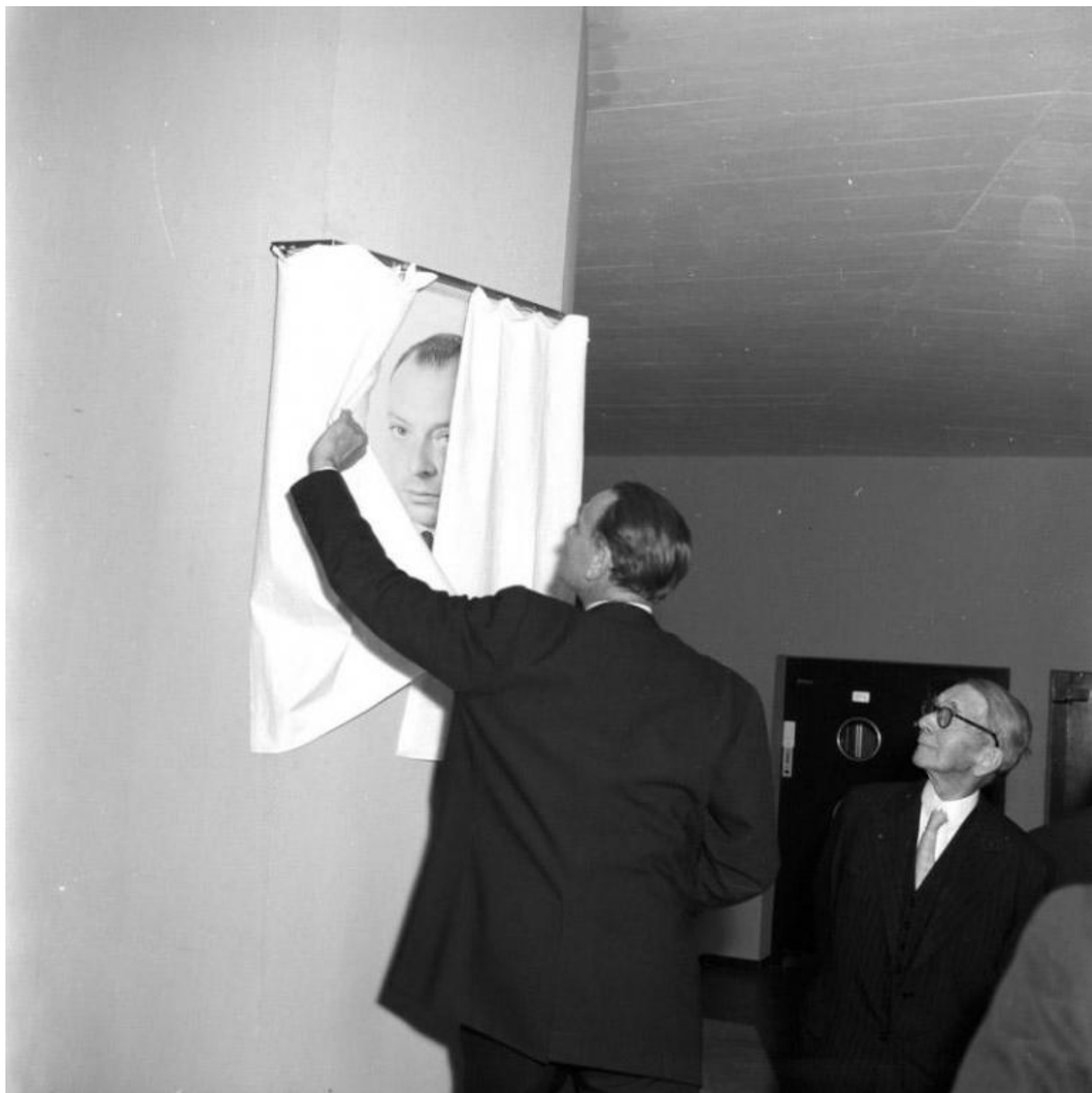
David Fathi, série Wolfgang, Untitled, 2016.

Anche la serie di fotografie Incidental Gestures è una manipolazione di immagini di archivio. Agnès Geoffray ritocca, falsifica, reinventa l'originale, come un atto di riparazione, per ridonare dignità alle vittime: veste una collaborazionista nuda che fu portata in strada per essere umiliata nel giorno della Liberazione, dona di nuovo un volto a un viso sfigurato, addolcisce e camuffa impiccagioni, come se le persone fossero appoggiate a pali, quasi trasognate.