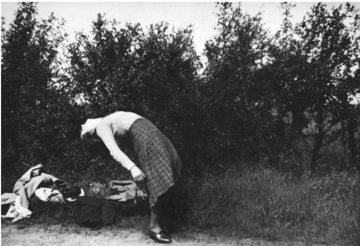
Agnès Geoffray, Incidental Gestures, 2011 12.

Oppure enfatizza la dimensione drammatica di una scena banale: una donna con la schiena a ponte sembra in stato di trance, nella posizione della isterica, e pare evocare anche la danza estatica e dionisiaca di una menade; il volo nel vuoto di un trapezista, sospeso dinnanzi alla sparizione di una barra ad altalena che non potrà afferrare.