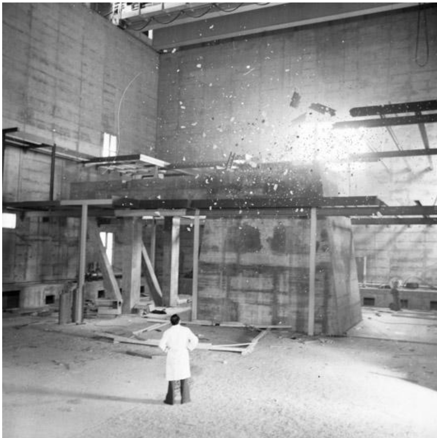
David Fathi, Serie Wolfgang, Sans titre 003, 2016.

L'incidente, la mancanza e il fallimento sono messi ironicamente in relazione con l'idea di archivio della scienza, e le certezze degli scienziati controbilanciate dalla leggenda e dalla superstizione. Lo scarto ironico entra nelle scoperte e nelle teorie quantistiche per dare spazio all'“effetto Pauli”, una credenza non scientifica messa in circolazione dagli stessi scienziati, i quali ipotizzavano che la presenza del loro illustre collega portasse sfortuna nel corso degli esperimenti. Fathi stabilisce un parallelo tra l'atto fotografico e l'effetto Pauli, che chiama “effetto osservatore”, lasciando al fruitore la scelta autonoma di capire cosa sia vero e cosa falso nell'immagine, cosa sia scienza e cosa invenzione.