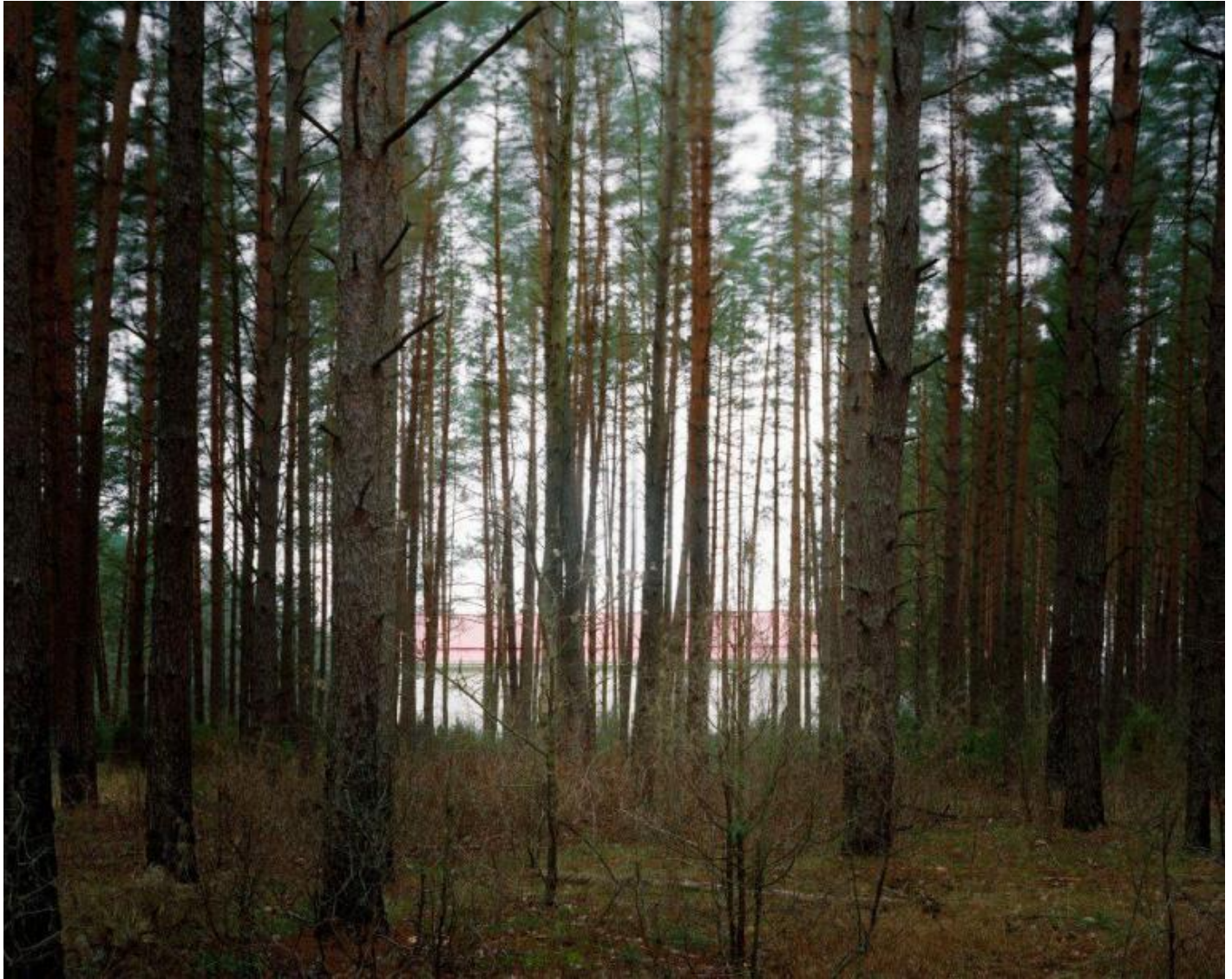
Edmund Clark, Negative Publicity #043, 2011, Photograph, Copyright Edmund Clark and Crofton Black, Courtesy Flowers Gallery

Clark rende visibile la censura attraverso la scelta di celare parzialmente i luoghi dove sono avvenuti i sequestri di persona e le prigionie delle detenzioni segrete – i black sites scelti dalla CIA in varie parti del mondo – con i pixel ingranditi smisuratamente, quasi a evocare l’irruzione formale dell’astrazione americana nata nel periodo della Guerra Fredda, oppure con sfocature, con camuffamenti, dove anche le intere frasi occultate dei documenti evocano forme geometriche nere, o le cancellature rimandano a espedienti stilistici o concettuali praticati dall’arte contemporanea. Come si fa a costituire un archivio di tutto ciò che è stato censurato e nascosto dai poteri forti nel corso della storia? Black e Clark cercano di evidenziare questo problema, ricreando in una maniera molto veritiera quel “sistema nascosto in piena luce”.