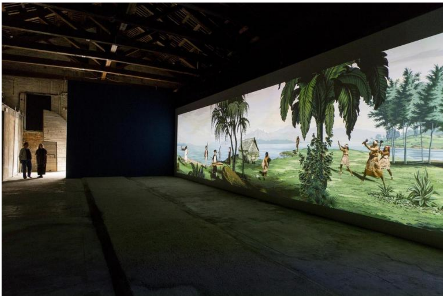
Lisa Reihana, In Pursuit of Venus Infected, Venezia, 2017.

Viva Arte Viva , è affollata di opere documentarie dai toni risentitamente autenticisti (che si accontentano, cioè, della mera ostensione di dati “reali”, al di qua di ogni loro elaborazione formale), nei senz’altro più interessanti padiglioni nazionali il discorso, opportunamente, si complica. In quello neozelandese, per esempio, uno spettacolare diorama di Lisa Reihana (una 52enne Maori), In Pursuit of Venus (infected) , racconta in mezz’ora di “impossibile” piano-sequenza la storia dell’incontro fra Europei e Polinesiani, riproducendo con ironia sottile i toni edulcorati e oleografici coi quali l’evento veniva raffigurato ai primi dell’Ottocento.