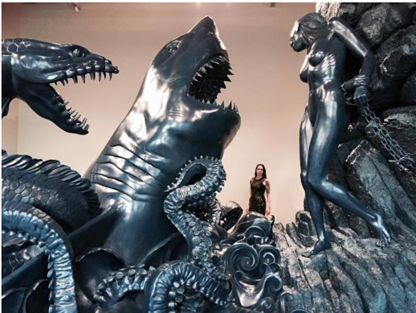
Damien Hirst, Andromeda e il drago , Venezia, 2017.

Tutto finto, ovvio. Tranne l' hybris , e la scommessa miliardaria (sessanta milioni di dollari, si vocifera: costo davvero paragonabile a quello di un blockbuster hollywoodiano), di Damien Hirst. Cioè il «collezionista», un cui auto-busto bronzeo figura a sua volta in mostra: mise en abîme delle infinite marche di finzione esibite (dall'incontro impossibile di figure di mitologie distanti come Kali e l'Idra all'uso di materiali a loro volta impossibili come il marmo di Carrara a scritte ben visibili, a tergo di certe statue, come «1999 Mattolini CHINA»; dalle citazioni di artisti contemporanei, e comunque futuri rispetto al periodo raccontato – Jeff Koons, Pierre Huyghe, Roberto Cuoghi, ma anche l'Ilaria del Carretto di Jacopo della Quercia –, sino a presenze pop grottescamente incongrue come Mowgli e Baloo del Libro della giungla , Pippo e Topolino, addirittura il robottone di Transformers presentato – con incongruenza al quadrato! – come idolo azteco: tutti debitamente fioriti delle incrostazioni sottomarine che fanno da leitmotiv dell'insieme).