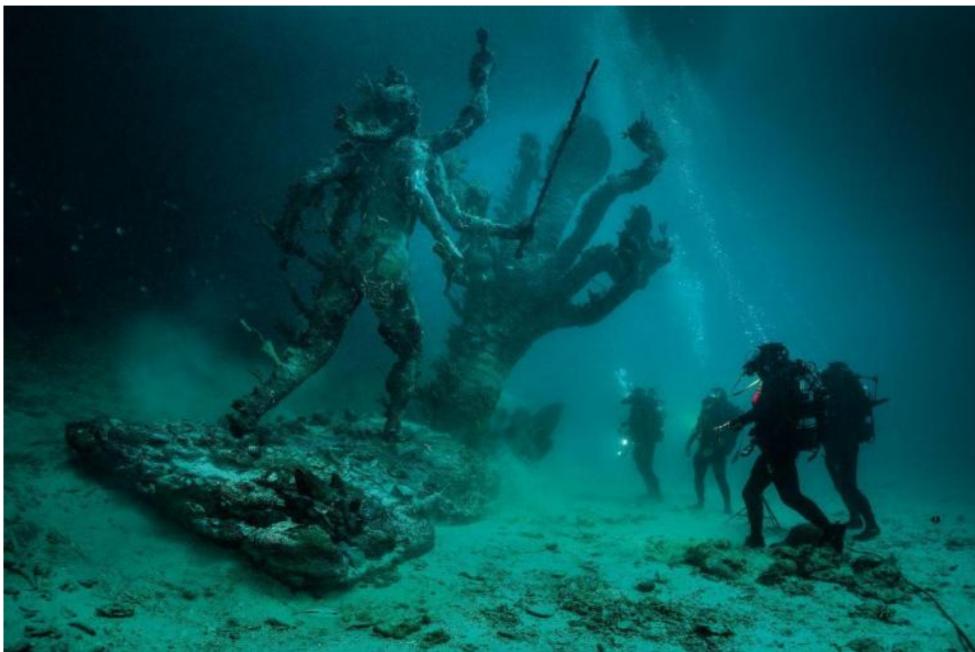
Damien Hirst, Hydra e Kali , Venezia, 2017.