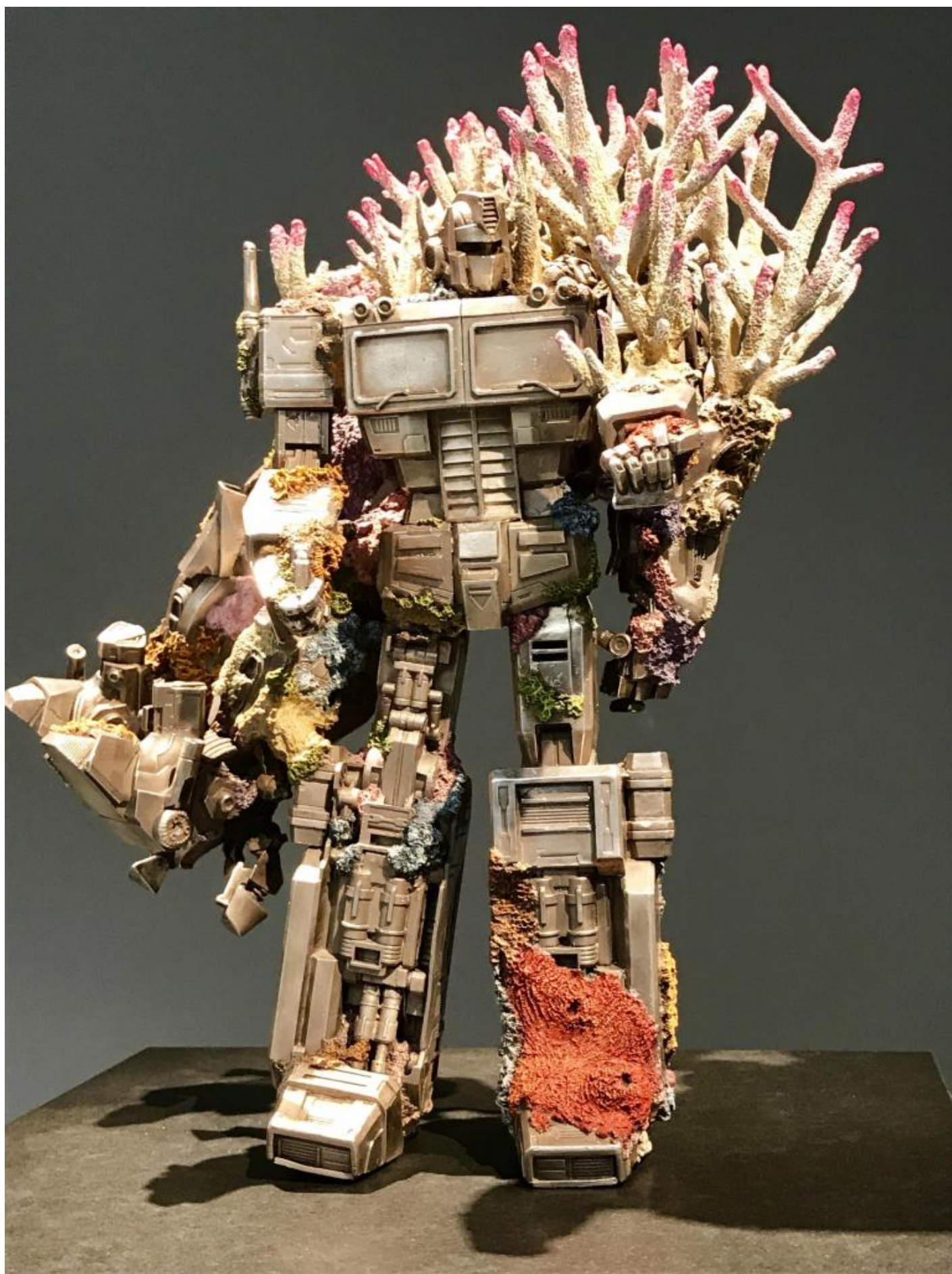
Damien Hirst, Transformers, Venezia, 2017.