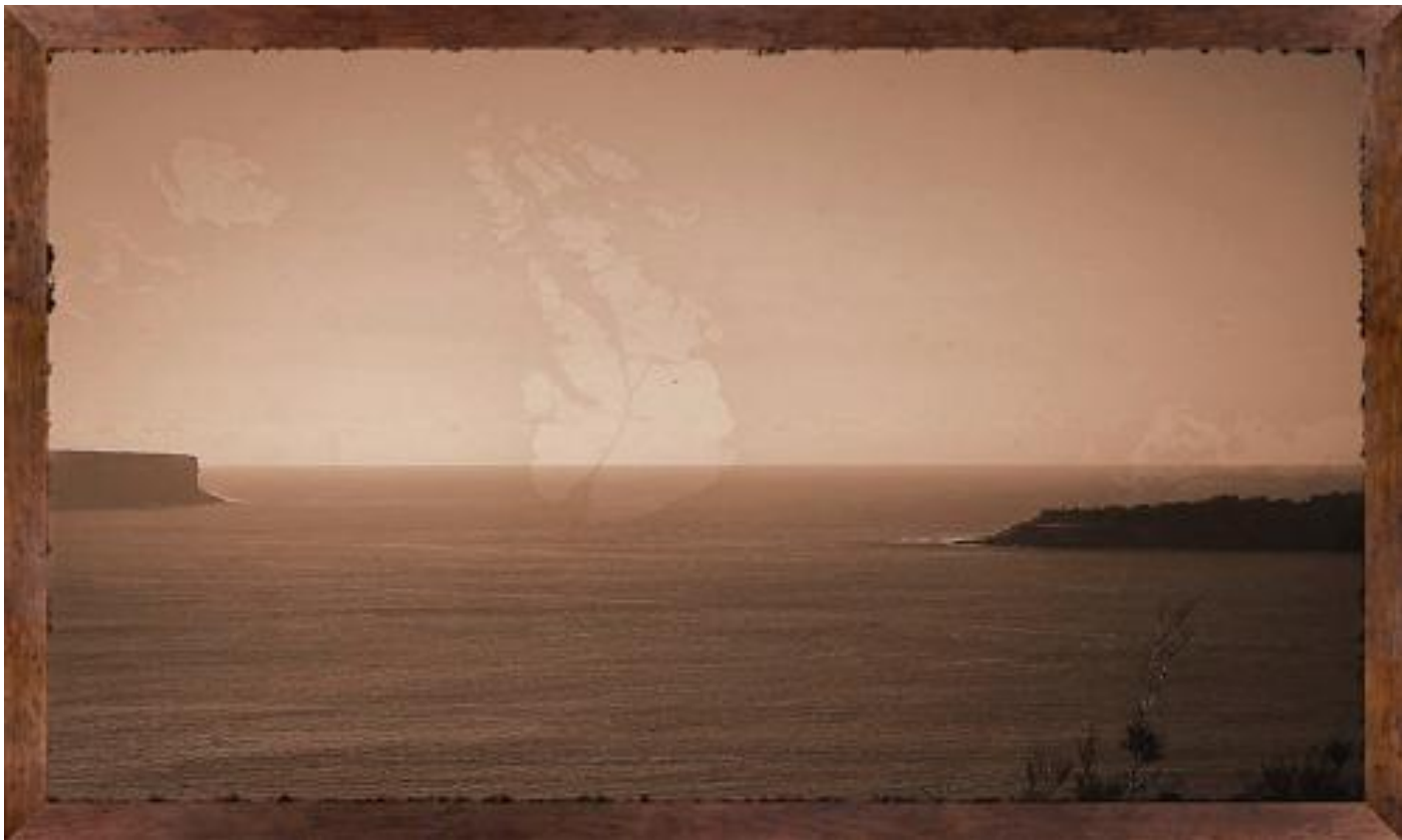
Tracey Moffatt, The White Ghosts Sailed, Venezia, 2017.

Le immagini, all'inizio solenni ed elegiache, a un certo punto accelerano, si spezzettano – come riprese da un operatore in fuga –, alludendo a una violenza tanto invisibile quanto storicamente documentata. L'uso del finto e dell' anacronismo , con procedimento perfettamente speculare rispetto a quello di Hirst, intende così produrre un documento impossibile, certo, che fa però riferimento a una storia vera: dando voce – in questo caso per immagini – a chi, come gli Aborigeni messi a tacere dalla violenza del tempo, non ha potuto trasmettercela.