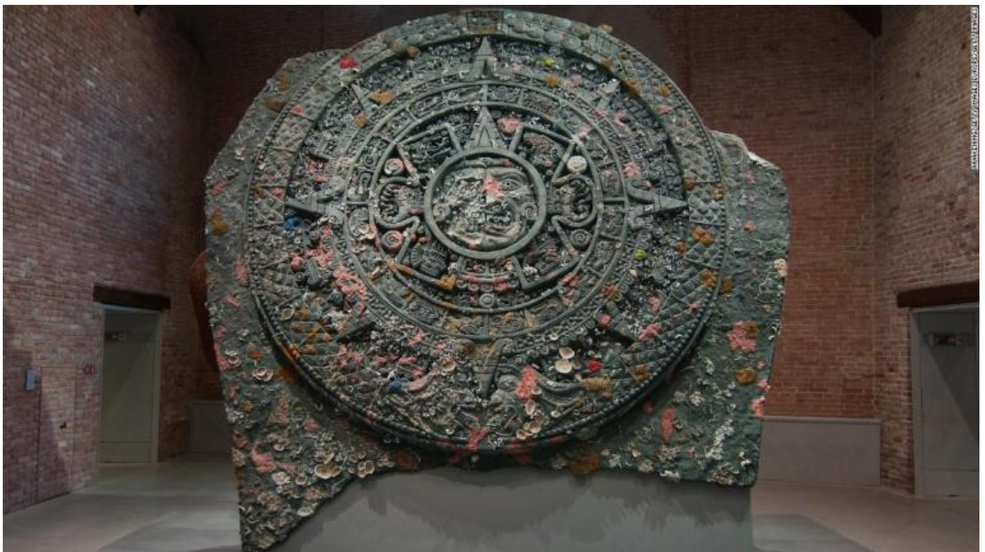
Damien Hirst, Calendario azteco a Punta della Dogana, Venezia, 2017.

L’ exploit s’incastona bene, in ogni caso, in una Venezia che ossessivamente s’interroga, in Biennale e fuori, sulle forme della narrazione – e sullo statuto della verità, appunto, che ogni performance narrativa inevitabilmente mette in questione: ben prima, si capisce, della così trendy discussione attuale sulla «postverità». Se la piatta mostra centrale, curata da Christine Macel coll’enfatico quanto generico titolo di