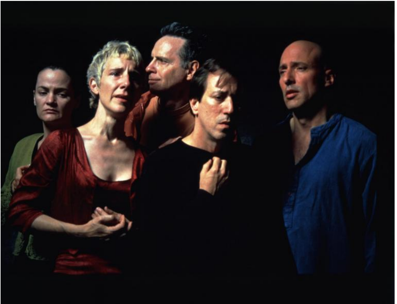
Bill Viola, The Quintet of the Astonished

Si può così scoprire come la riappropriazione del tempo, dello spazio e di un modo di intendere il senso della vita, mentre riescono ad essere tra i più moderni, riportano alle intime radici dell'uomo. Il connubio tra tecnica, pensiero e arte riesce nello scopo. Nell'arte di Viola la tecnica e il progetto sono parte integrante dell'opera, e l'esperienza dell'osservatore coevolve con essa. Con la poetica di Viola si può sperimentare quella contemporaneità del classico che Salvatore Settis ha così efficacemente analizzato. Dopo Antonello da Messina, in particolare con Ritratto di ignoto , e Caravaggio, sembrava che non ci fosse evoluzione possibile per rappresentare certi aspetti della luce e dell'espressione umana, e invece Bill Viola riesce ad essere classico e contemporaneo, indicando uno spazio per l'arte che la faccia essere all'altezza della sua storia e spazio e tempo di emancipazione per i contemporanei.