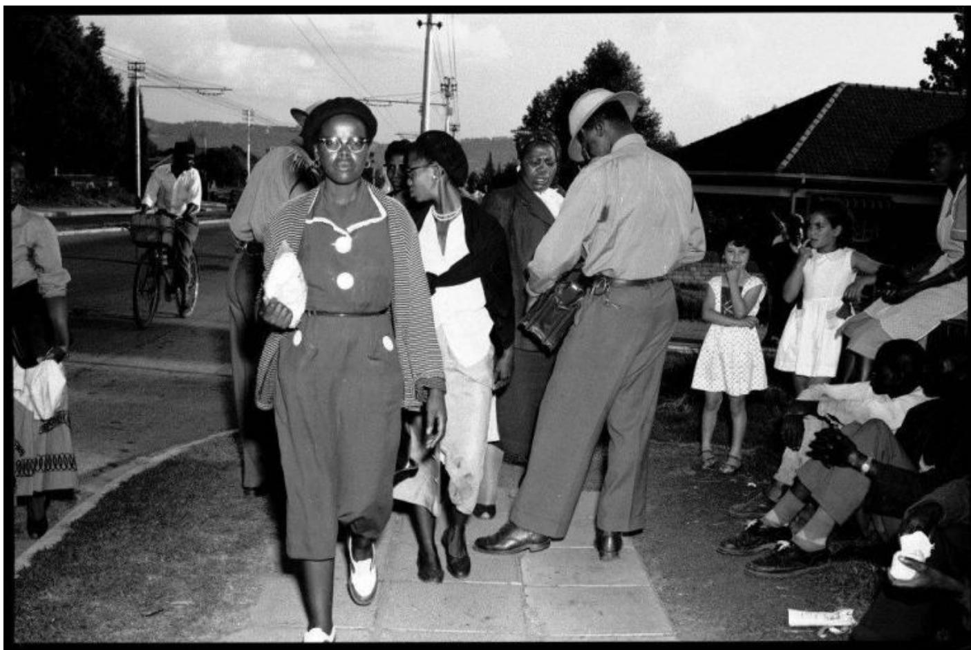
Eli Weinberg, Police check passes and parcels, 1961, Courtesy UWC, Robben Island Museum, Mayibuye Archive.

Women taking a break on the lawns in front of the Union Building, Women's March è la fotografia scelta per rappresentare simbolicamente in mostra l'anno 1956. 20.000 donne organizzano una marcia presso gli edifici dell'Unione a Pretoria per protestare contro gli emendamenti proposti dalla Legge sulle Aree Urbane. Contro i lasciapassare presentano una petizione indirizzata a Strijdom, Primo Ministro simpatizzante per il nazionalismo afrikaner. Una canzone composta per l'occasione e diventata simbolo della battaglia delle donne in Sudafrica recita: "Strijdom, Wathint' abafazi, wathint' imbokodo" ("Strijdom, se colpisci una donna, colpisci una roccia"). Nello scatto donne in pausa sui prati davanti allo Union Building non siedono sulla panchina, vuota, perché riservata a europei. L'archivio è anche una zona d'incertezza in cui il senso di colpa e l'espiazione esprimono la condizione dei privilegiati.