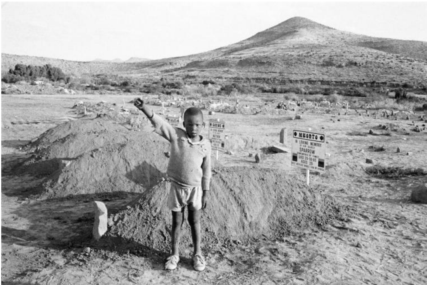
David Goldblatt, After their funeral a child salutes the Cradock Four, Cradock, Eastern Cape, 20 July 1985, 1985, black and white photograph.

Al rilascio “senza condizioni” di Nelson “Modibo” Mandela, all’entrata in carica nel 1994 dell’African National Congress (ANC) e all’elezione di Nelson Mandela a primo presidente di una nazione post-Apartheid è dedicato il corridoio più stretto della mostra. Sembra quasi che i curatori, optando per questa soluzione di allestimento, abbiano voluto evidenziare la politica cosmetica di passaggio da uno stato razzista a una democrazia confederale, che non disgiunge il nuovo Sudafrica dal capitalismo coloniale, che dal XVI secolo di fatto governa il paese. Il che pare essere confermato dagli anni Duemila, raccontati da fotografie che sono più evocazioni di eventi che documenti veri e propri.