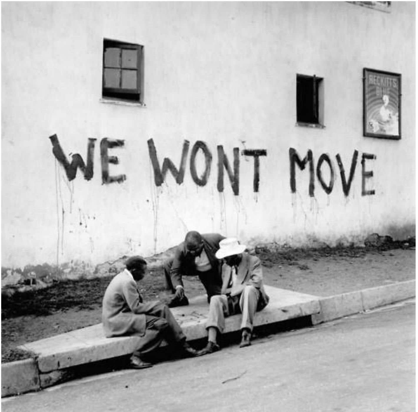
Jürgen Schadeberg, We won't move, Sophiatown , 1955

uomini ben vestiti mentre giocano. In effetti, anche nelle fotografie coloniali fasciste gli «indigeni» raramente lavoravano.