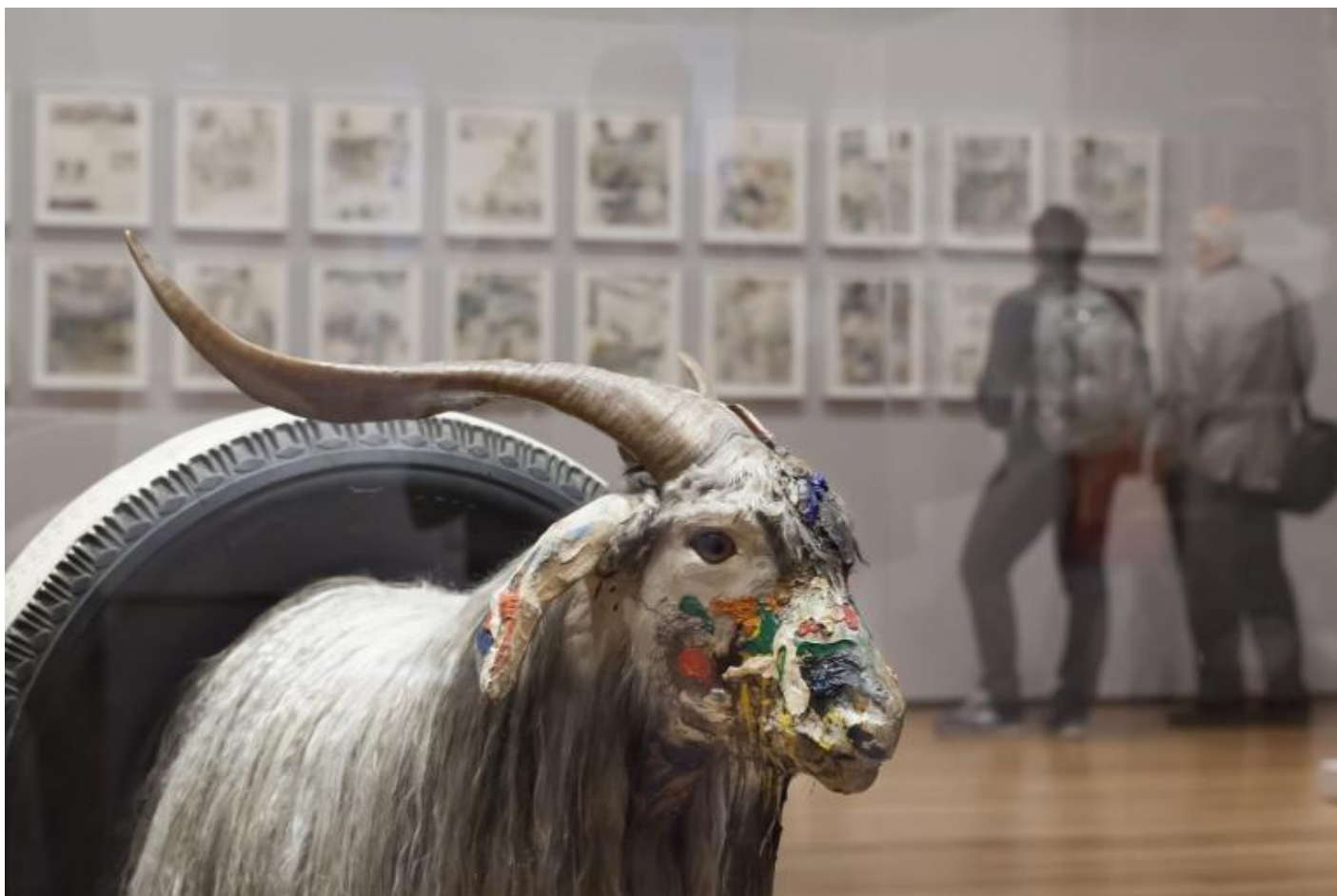
Robert Rauschenberg. Monogram. 1955–59, veduta espositiva espositiva.

La maggior parte dei Combines esposti in questo terzo spazio trattano temi mitologici, in quanto l'intera salasi propone di affrontare l'interesse da parte dell'artista per la cultura classica del passato a cui egli si avvicina nel 1958. In quell'anno infatti, inizia a lavorare alla serie di disegni, conclusa nel 1960 e qui esposta, che illustra i 34 canti dell' Inferno di Dante Alighieri, inventando una nuova tecnica atta a trasferire su carta riproduzioni fotografiche tratte da riviste e giornali, per poi rilavorarle con altri materiali.