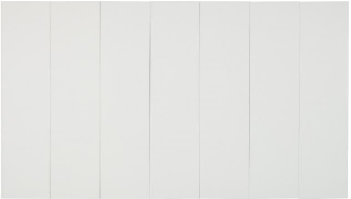
Robert Rauschenberg, White Painting, 1951. Robert Rauschenberg Foundation, New York. © 2017 Robert Rauschenberg Foundation

La seconda sala focalizza invece l'attenzione sulla serie dei Red Paintings (1953-54) e sui primi Combines (1954-55), presentando non solo il celebre Bed (1955) ma anche l'opera da sempre considerata la prima di questa tipologia di lavori: Charlene (1954), una grande tela sulla quale l'artista ha inserito specchi, un ombrello, fumetti, una luce che lampeggia e si spegne.