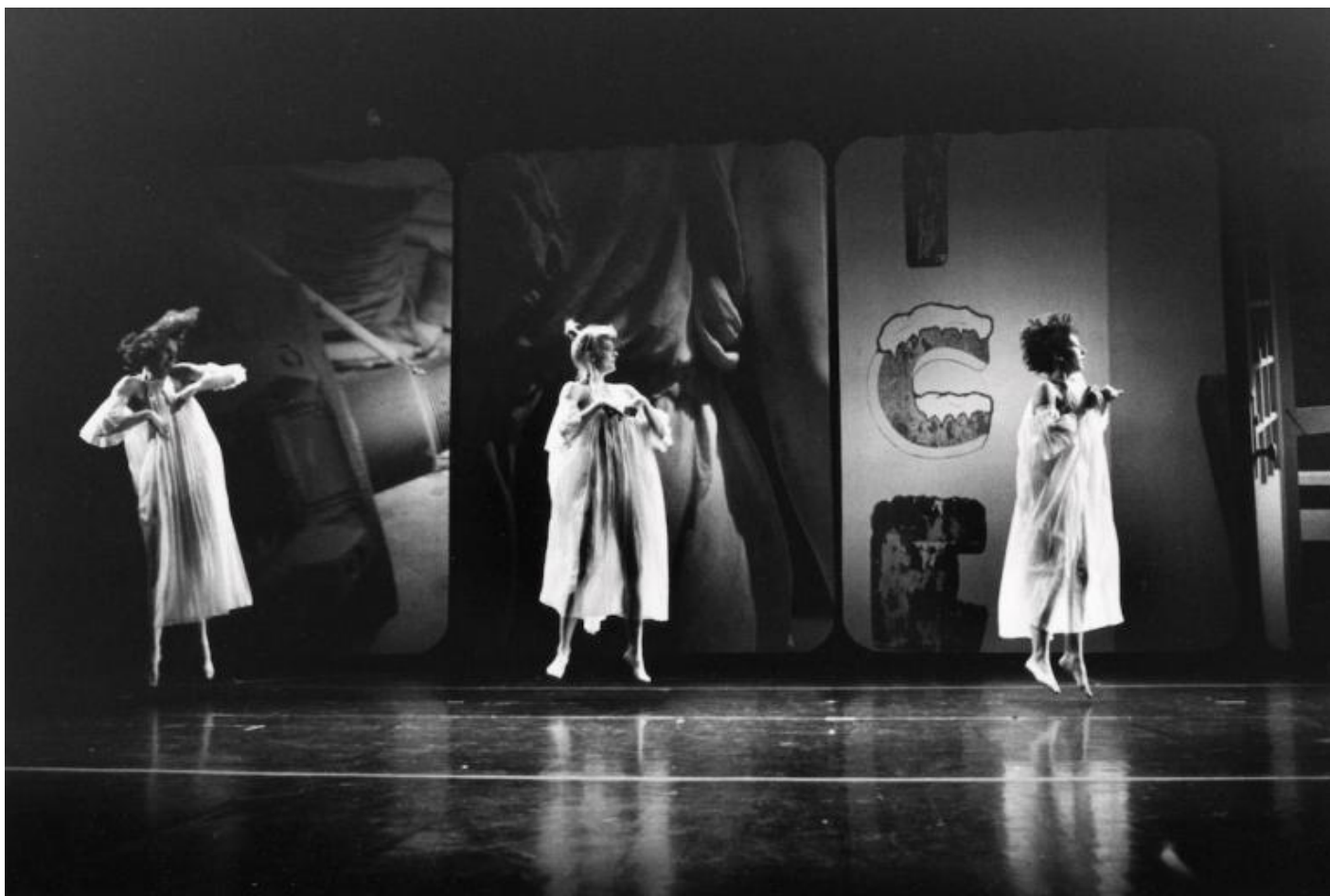
Trisha Brown, Glacial Decoy, 1979, con costumi, scene e luci di Rauschenberg (con Beverly Emmons), presso il Marymount Manhattan College Theater, New York, 20–24 giugno 1979. Da sinistra a destra: Brown, Nina Lundborg, e Lisa Kraus.

diapositive fotografiche proiettate su quattro grandi schermi a costituire lo sfondo dello spettacolo, al MoMA sono presentate insieme a filmati documentari della performance messa in scena alla Brooklyn Academy of Music nel 2009 e ai filmati relativi a Set and Reset (1983) che attestano un'ulteriore collaborazione tra l'artista e Trisha Brown.