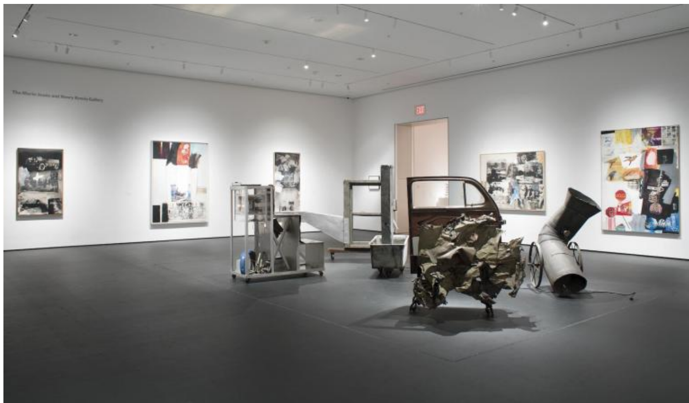
Robert Rauschenberg con Toby Fitch, Harold Hodges, Billy Klüver, e Robert K. Moore, Oracle, 1962–65, veduta espositiva.

La sezione successiva dell'esposizione, invece, è interamente dedicata a 9 Evenings: Theatre and Engineering , un evento tenutosi dal 13 al 23 ottobre 1966 a New York, al 69th Regiment Armory, ma concepito nel corso dei mesi precedenti da parte di Rauschenberg e di Billy Klüver con la collaborazione di artisti, coreografi, musicisti e di quaranta ingegneri dei Bell Laboratories. I video e i progetti delle singole performances presentate durante le 9 Evenings , tra danza, musica e tecnologia, sono esposti al MoMA assieme ai relativi volantini, manifesti e documenti d'archivio. Attorno ai nove filmati dell'evento, Atlas ha creato unallestimento che trasforma la loro visione nell'esperienza di una vera e propria installazione artistica video-sonora.