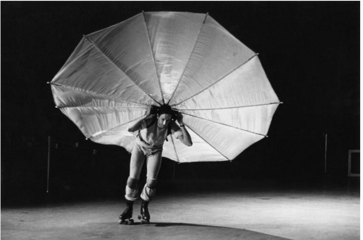
foto della performance di Robert Rauschenberg, Pelican (1963), 1965.

Nel 1961 Rauschenberg si cimenta nei primi esemplari della serie di 150 silkscreen paintings costituite da immagini preesistenti tratte da riviste del tempo e continuamente riutilizzate in diverse combinazioni. Nello stesso periodo inizia a interessarsi anche alle nuove tecnologie: da qui la collaborazione con l'ingegnere Billy Klüver e con i Bell Laboratories nel New Jersey. La mostra non solo documenta le meravigliose silkscreen paintings ma anche due dei più ambiziosi esperimenti tecnologici realizzati dall'artista: Oracle (1962-65, progettata con Billy Klüver, Harold Hodges, Per Biorn, Toby Fitch e Robert K. Moore), e Mud Muse (1968-71, progettata con Frank LaHaye, Lewis Ellmore, George Carr, Jim Wilkinson, Carl Adams, e Petrie Mason Robie).