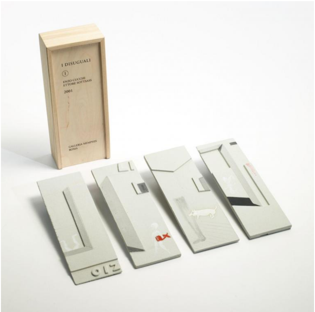
Enzo Cucchi e Ettore Sottsass, I Disuguali , 2001: rivista in ceramica e box in legno di pino.

Lei ha più volte dichiarato che “non c’è tecnica, non ci sono altre discipline, se prima non c’è il disegno”. Per disegno intende la tradizionale tecnica della matita o dell’inchiostro su carta, oppure, più in generale, il gesto del tracciare qualcosa su una superficie a prescindere dallo strumento con cui lo si fa (matita, inchiostro, colore ad olio...) e dal supporto su cui si agisce (carta, tela, legno...)?