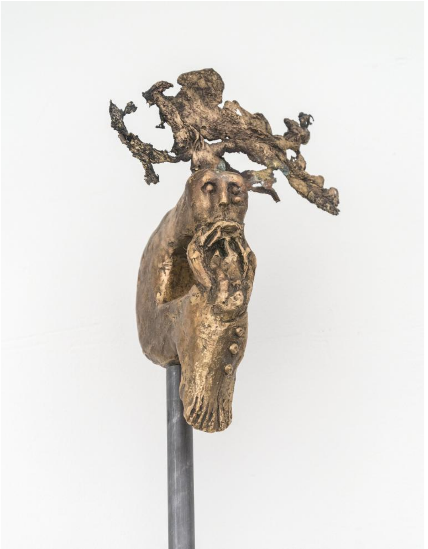
Enzo Cucchi, Senza titolo, 2015: bronzo.