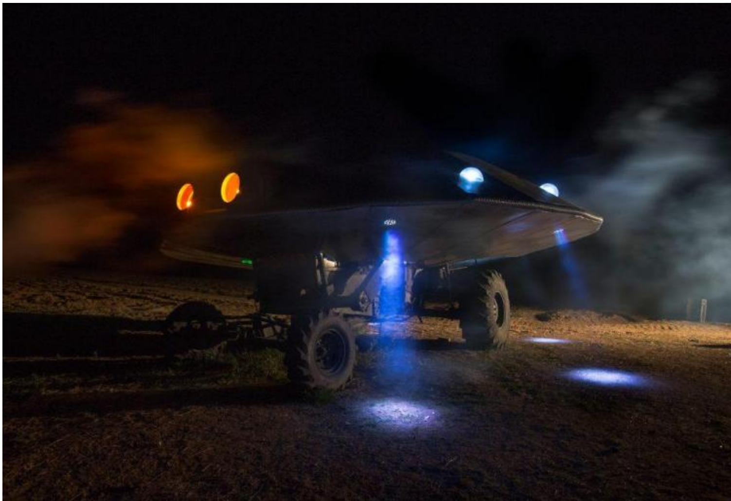
Moira Ricci, Dove il cielo è più vicino, Il diavolo mietitore, 2014, courtesy Laveronica contemporary art gallery.

La metamorfosi da una forma a un'altra, resa nel video con l'effetto del time-lapse, testimonia che la trebbia diviene una navicella spaziale nell'avvicinarsi del giorno e della notte, attraverso la fatica e la partecipazione delle persone coinvolte, aprendo anche alla possibilità che si possa elevare verso una prospettiva ultraterrena. Foto di grandi dimensioni mostrano poi coloro che hanno costruito un mezzo, utile per trasformare l'impossibile in un viaggio: rivolgono lo sguardo e le loro aspettative verso l'alto, in direzione del cielo, con il sorriso dei contadini cosmonauti, con la speranza che si apra una via di collegamento con l'universo. E questo è un primo passo, forse, per far evolvere finalmente la specie umana.