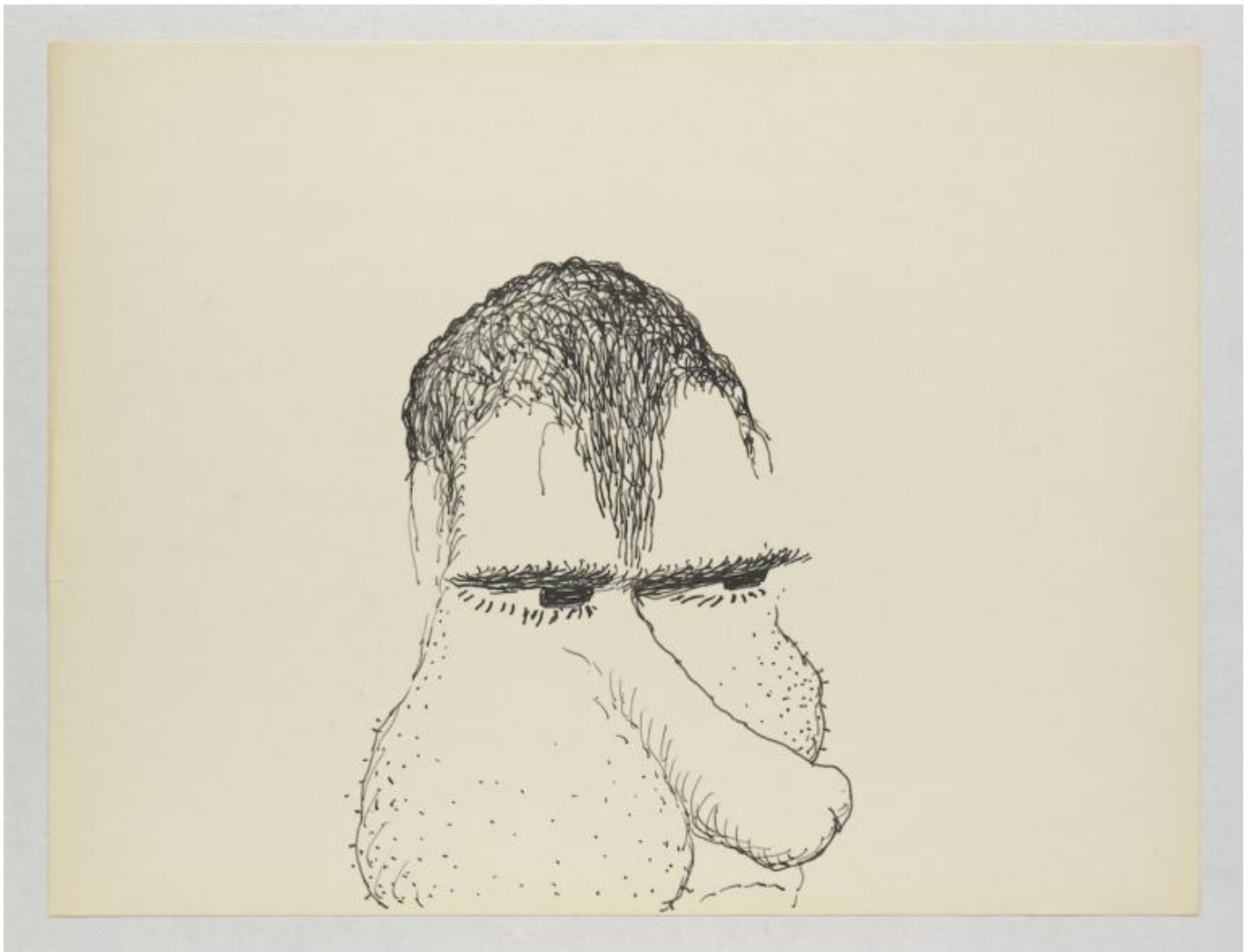
Untitled (Poor Richard), 1971, inchiostro su carta.

Il volto intrappolato nella sua anatomia sessuale, bastano pochi tratti d'inchiostro a Guston per abbozzare le espressioni del presidente, così come il suo carattere megalomane, la sua dubbia morale, la sua viltà. Lo stesso destino spetta ai suoi collaboratori più stretti: il vice presidente Spiro Agnew (una testa conica), il Procuratore generale John Mitchell (una pipa fumante), il Segretario di Stato Henry Kissinger (un paio d'occhiali con la montatura spessa).