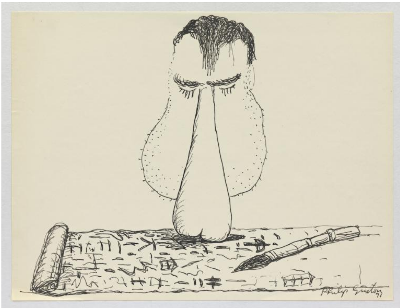
Untitled, 1971, inchiostro su carta. © The Estate of Philip Guston. Courtesy Hauser & Wirth.