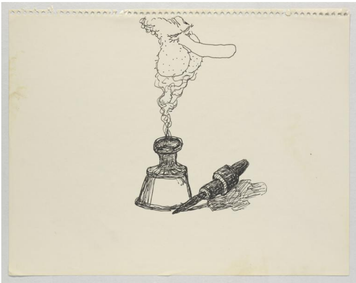
Untitled, 1971, inchiostro su carta.

Un sentimento di un'attualità bruciante: in una recente conferenza all'università di Ginevra ( Why American Politics Went Insane ), W.J.T. Mitchell ha confessato di non riuscir sempre a distinguere gli interventi ufficiali dell'attuale presidente dall'imitazione di Alec Baldwin al Saturday Night Live Show. Così una vignetta pubblicata sul "New Yorker", dove una donna si precipita nello studio di un disegnatore e urla: "Fermati! Quella vignetta di Trump che ti è venuta in mente stamattina è appena accaduta!". La caricatura è indistinguibile dal suo bersaglio in quanto il presidente è il primo a utilizzare la satira come arma politica, come nell'infelice imitazione di un disabile in piena campagna elettorale. Se per Marx la storia si ripete due volte, la prima volta come tragedia, la seconda come farsa, il problema è che oggi, conclude Mitchell, sembra darsi simultaneamente come tragedia e farsa.