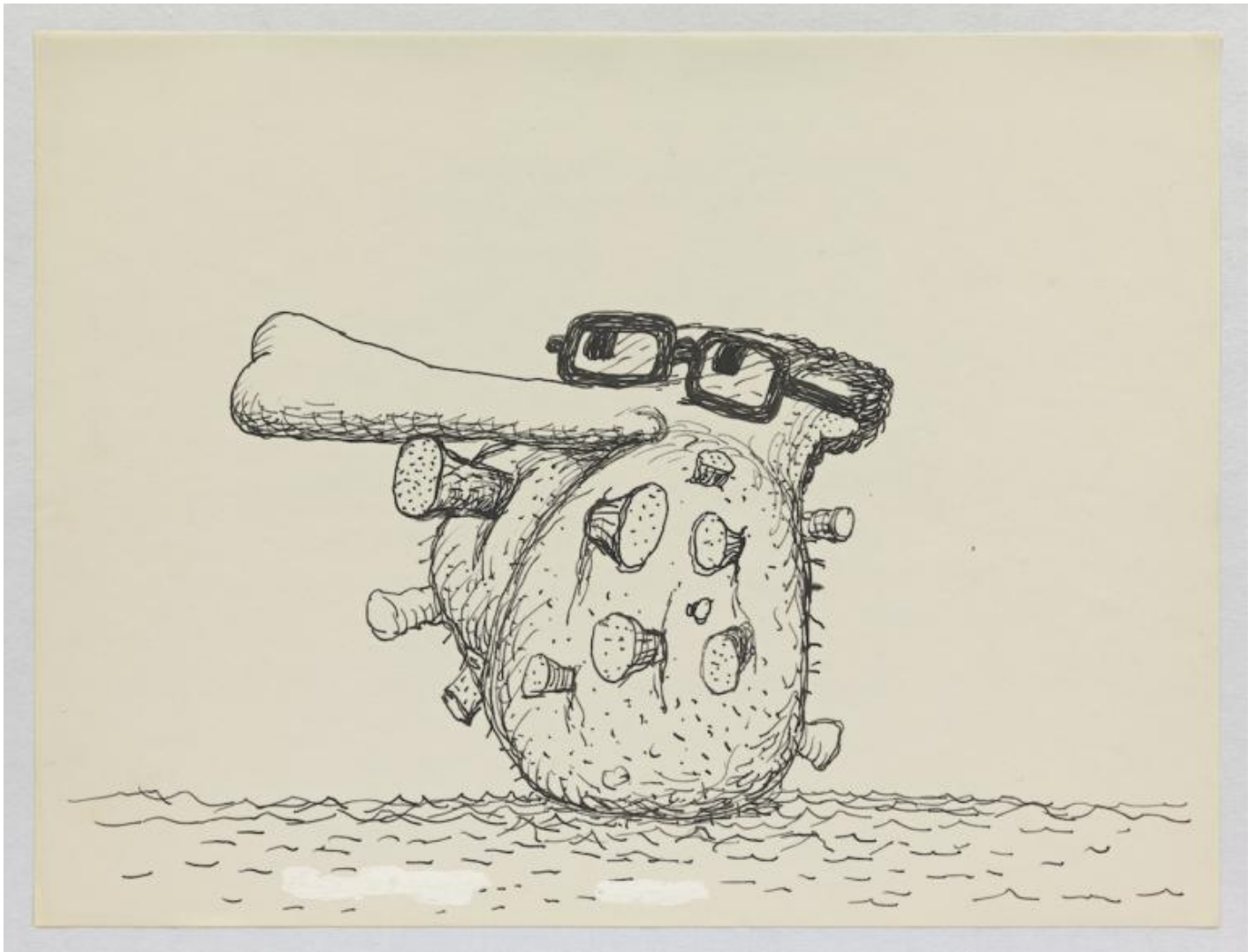
Untitled, 1971, inchiostro su carta.

realizzato centinaia di disegni che sembravano costituire una trama, una sequenza”. Guston segue il suo presidente ovunque, dalle apparizioni in televisione al già ricordato viaggio in Cina che, ancora in preparazione, diventa un oggetto di pura immaginazione, un modo per meglio precisare la morfologia sempre più fallica del volto presidenziale. Spingendosi al di là della carriera politica, Guston risale indietro fino agli stenti dell’infanzia di Nixon in una famiglia quacchera nel Sud della California – dove era cresciuto anche Guston, sebbene fosse nato a Montreal – e ai momenti di relax sulla spiaggia di Key Biscayne, suo buen retiro in Florida. Qui, per inciso, ha una dimora faraonica, Mar-a-Lago, anche l’attuale presidente.