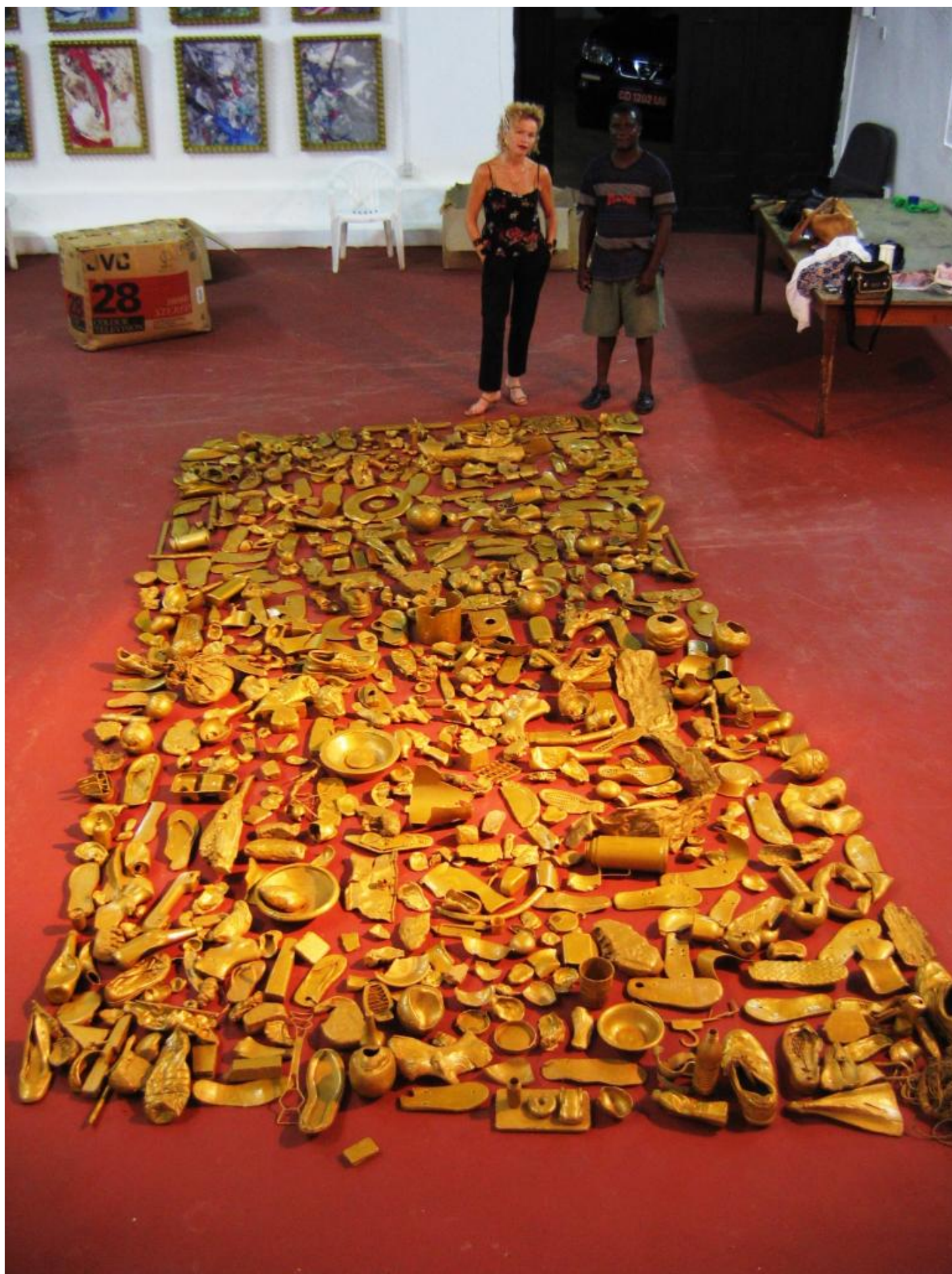
Ph: Virginia Ryan, Goldfield, Kumasi 2002, courtesy of the artist.