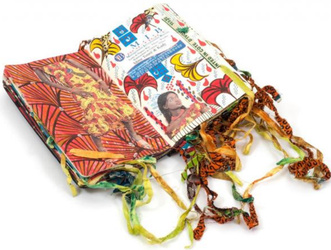
Ph: Virginia Ryan, The Rue Du Commerce, 2013, courtesy of lettera27 art collection.

Sovraesposta sotto lo sguardo dei neri, Virginia fa l'esperienza della propria vulnerabilità: "I have been told that the Ghanian twi word for Whites, Obroni , actually means not pale-skin, but 'without skin' – or at least that this is one of the possible meanings. It shocked me when I heard that. Can that be true? Is that how I look? Like some sort of skinned, peeled, ghost-like apparition, whilst they look so round and succulent?". Quello che qui appare, non è tanto l'altro vittimizzato dalla discriminazione razziale, ma quello che le resiste, che afferma l'autonomia del proprio sguardo.