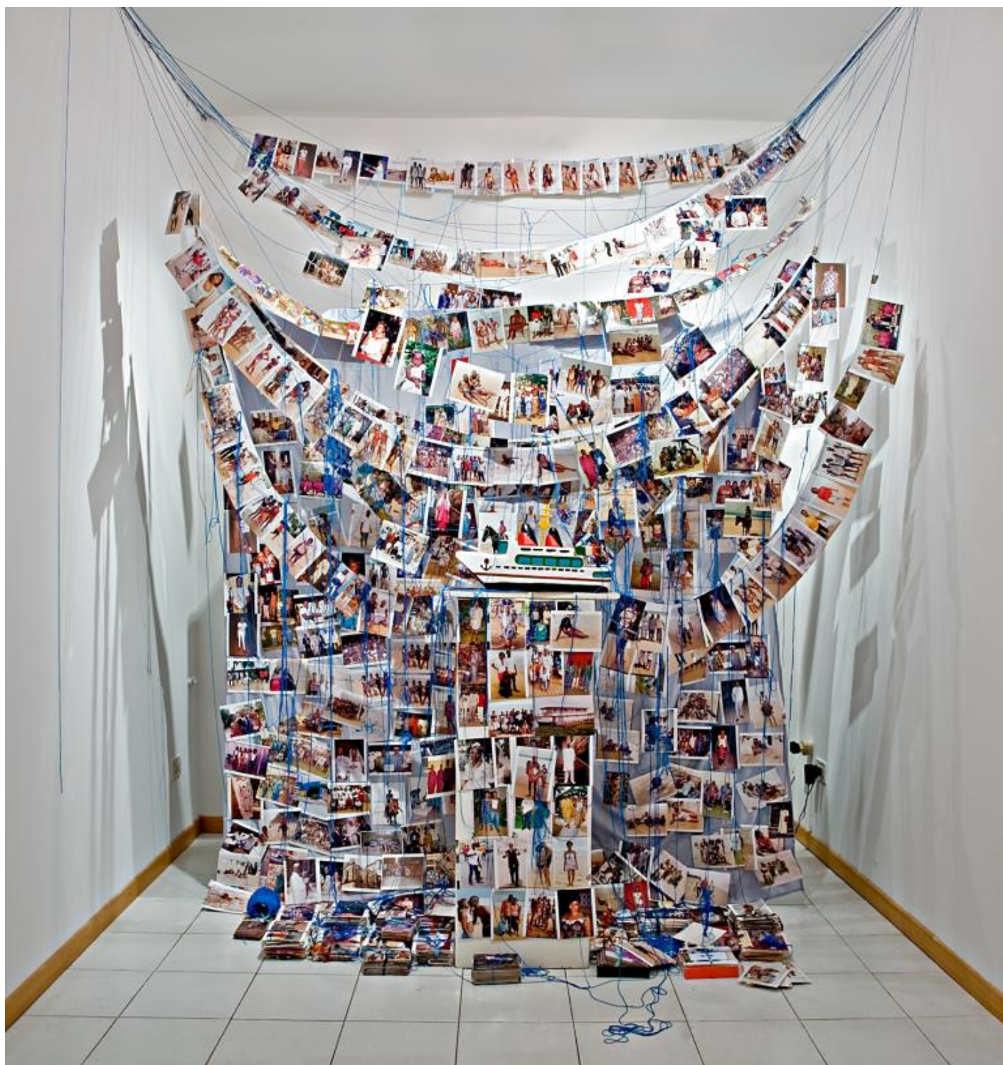
Ph: Virginia Ryan, Found photographs from Grand Bassam, installation Spoleto, courtesy of the artist.

L'opera di Virginia assume così il carattere di un lavoro intermediale, fatto attraverso le cose e le immagini che tessono la trama della realtà. Qui i confini fra il reale e l'immaginario, il proprio e l'altrui, l'individuale e il collettivo, tendono a confondersi, ma non a svanire: da un lato questo lavoro di ri-mediazione autoriale indebolisce il nesso con il contesto di partenza, ma dall'altra non arriva mai a cancellare l'intenzione comunicativa che era alla base dell'artefatto originario. È questo il motivo per cui accade che con le opere di Virginia Ryan non solo sentiamo di guardare, ma anche di essere guardati, di poter guardare non solo all'arte ma anche attraverso l'arte.