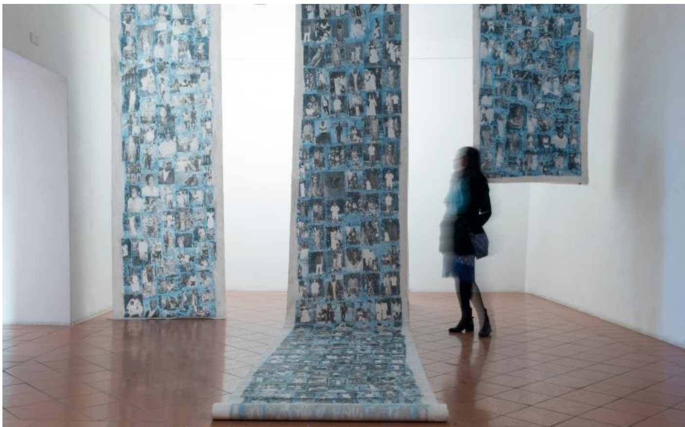
Ph: Virginia Ryan, Installation view, Palazzo Lucarini 2017, courtesy of the artist.

La sua predilezione per gli assemblaggi e i fotomontaggi, per gli objet trouvé e i materiali deperibili e riciclati, dialoga con la storia dell'arte, ma muove da un'esigenza interiore e dalle esperienze del suo periodo africano. Davanti alla fragilità della vita, alle lacerazioni che attraversano la realtà, al tempo che tutto inghiotte e cancella, il lavoro di Virginia Ryan prende la forma della raccolta paziente, della ricucitura che non nasconde le cicatrici, di un'arte della memoria che altera, con strappi e cancellature, ciò che vuol salvare.