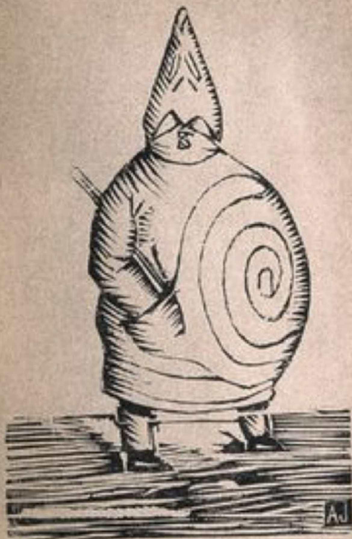
Véritable portrait de Monsieur Ubu.