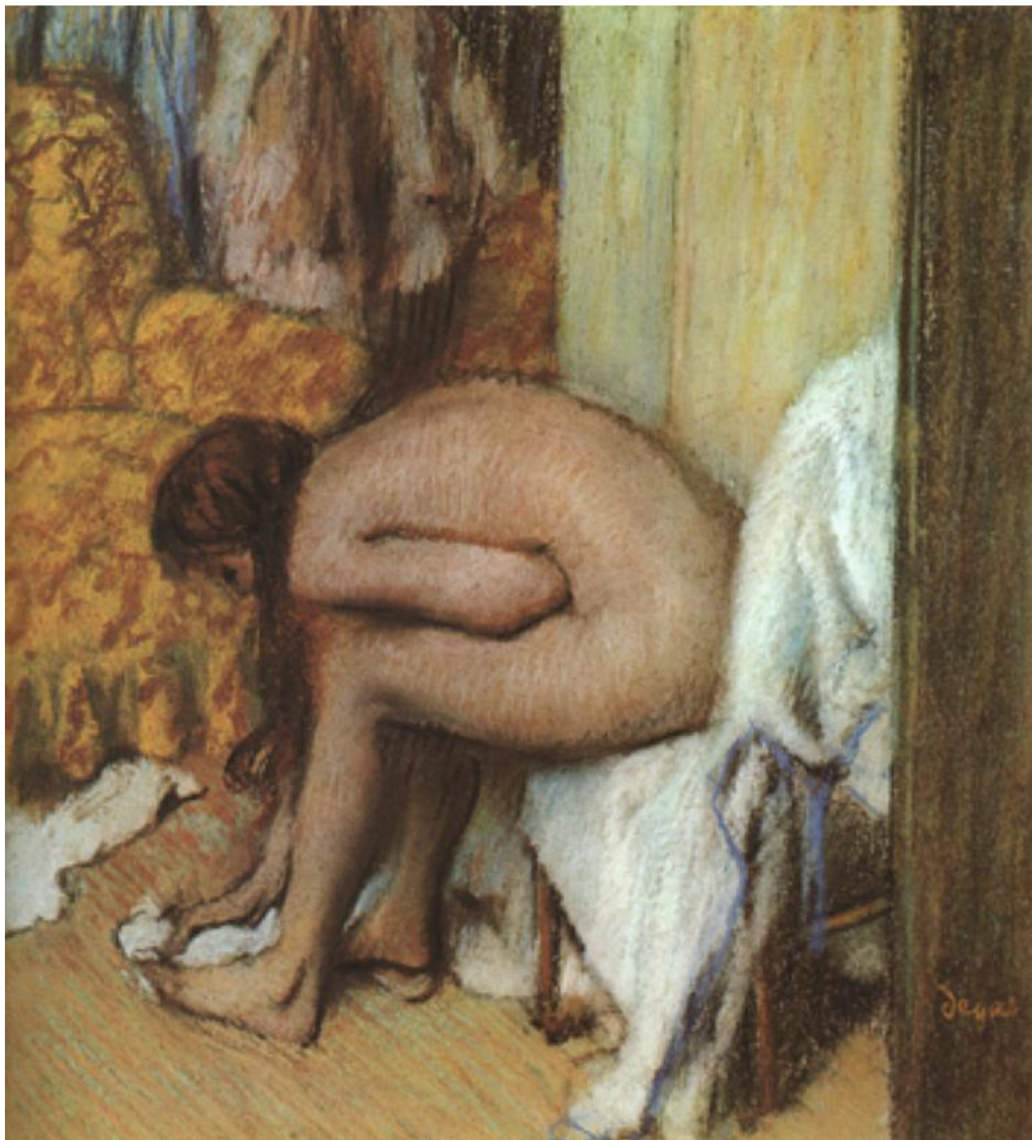
Degas, Femme à sa toilette essuyant son pied gauche (1886).