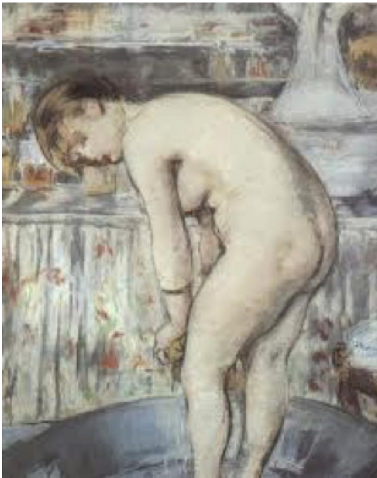
Manet, Le tub (1878-79).