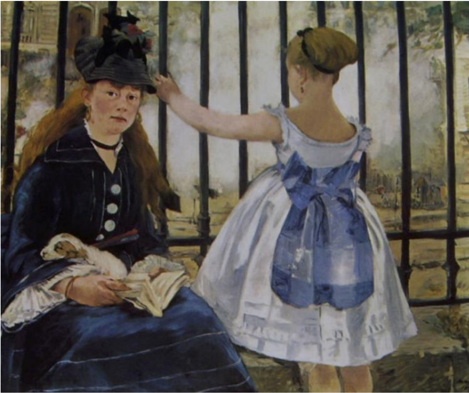
Manet, Le chemin de fer (1872-73).

Il dialogo fra Degas e Manet ricostruito pazientemente da Stoichita, tutto svolto con le risorse della pittura, è in questo illuminante. Da una parte il pittore che sta fuori il quadro, l'oggettivante Degas, che rappresenta il mondo come una scena a sé, frutto di una visione insistente e nascosta ma per nulla problematica. Dall'altra l'artista che si mette in gioco inserendosi in vario modo nella tela (ora come autoritratto di scorcio ora come firma inscritta nella rappresentazione), il soggettivante Manet, che restituisce il mondo come esito di un atto percettivo che del mondo stesso fa parte (situato, direbbero oggi i migliori cognitivisti): guardare verso la realtà è, spesso, essere guardati da essa. In questo, il vero voyeur è proprio Degas, che vede senza essere visto, cancellandosi come autore di un'opera che pure ha prodotto; mentre Manet, mettendo a nudo il procedimento pittorico, mostra il suo sguardo all'opera, un'opera che va inserita in un flusso comunicativo potenzialmente reversibile. E la cosa va avanti fino a che i due non cominciano a farsi ironicamente il verso: Degas dipinge una donna con un binocolo in mano e che le copre il viso ( à la Manet ); Manet dipinge la moglie di profilo, al centro della tela, mentre suona il piano ( à la Degas ).