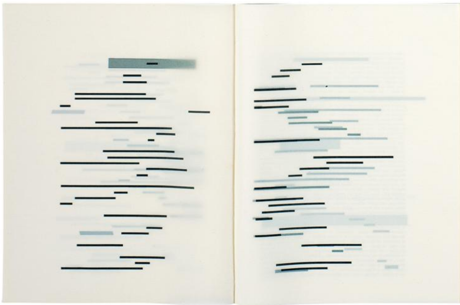
Un coup de dés jamais n'abolira le hasard, 1969. Sui versi del componimento di Mallarmé, l'artista appone delle bande nere impedendone la lettura

Questi fattori, che Broodthaers ben fa convivere nel suo processo, sovvertono le gerarchie visive e configurano l'opera come un elemento composito e combinatorio, soggetto a diversi gradi di rappresentazione. Nonostante nel suo percorso siano chiari i riferimenti a Duchamp e Magritte, la capacità di vivere il suo tempo, fa sì che egli riesca a spingersi oltre la lezione dada e surrealista, rinnovando l'avanguardia e venendo meno in primo luogo al principio dell'enunciato e della legittimità del luogo – come nel progetto della sua vita, il Musée d'Art Moderne-Département des Aigles , allestito per la prima volta in casa sua in Rue de la Pépinière a Bruxelles nel 1968, in seguito alle riflessioni maturate dopo le contestazioni studentesche del maggio dello stesso anno.