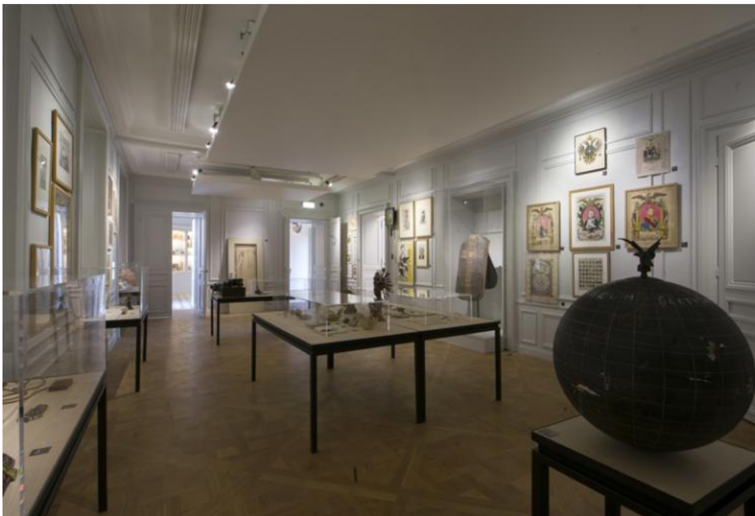
Musée d'Art Moderne-Département des Aigles, Section des Figures. Marcel Broodthaers. Musée d'Art Moderne-Département des Aigles, La Monnaie de Paris, 2015.

La sua produzione, come accade in molte mitologie individuali (prendendo in prestito la felice definizione di Harald Szeemann, alla cui Documenta nel 1972 sarà del resto invitato a partecipare proprio nella sezione così designata), è più semplice da descrivere per antitesi che per analogia ad altri artisti o movimenti coevi: lontanissimo dall'epopea del visivo inaugurata dalla pop art e da Andy Warhol, gli oggetti che attirano la sua attenzione fanno parte della routine giornaliera ed hanno carattere ordinario, banale, convenzionale (come non ricordare tra di essi le moules , giocate sulla doppia accezione che nella lingua francese ha la parola moule , ovvero cozza/mollusco di mare e stampo/matrice utilizzata in particolare nei processi di produzione industriale). Le sue bizzarrie appaiono, inoltre, altrettanto lontane dagli aspetti minimali della scultura e degli ambienti americani, a cui addirittura opporrà un'atmosfera da bric à brac ottocentesco piuttosto che seguire la tendenza del white cube. E se nell'uso di materiali emerge qualche affinità con il nouveau réalisme , anche questo parallelismo non trova la giusta coerenza, perché il modo di associare gli elementi si nutre di ben altre suggestioni, spesso derivanti dal passato e in particolare dai surrealisti e dalla poesia del XIX secolo.