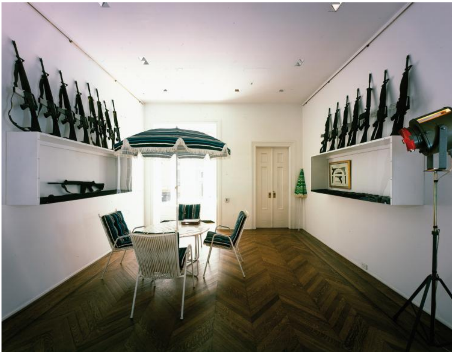
Décor. A conquest by Marcel Broodthaers (riallestimento). La mostra è stata realizzata per la prima volta all'ICA di Londra nel 1975.