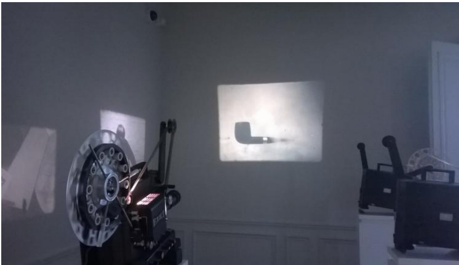
Cinéma Modèle. Marcel Broodthaers. Musée d'Art Moderne-Département des Aigles, La Monnaie de Paris, 2015.

Padrino della Critica Istituzionale e dell'era del post-mediale, morto nel 1976 a soli dieci anni dal suo ingresso ufficiale del mondo dell'arte, per presentarlo probabilmente si dovrebbe iniziare dal nome: «Broodthaers se prononce Brotars: quatre lettres phonétiquement inutiles dans l'orthographe du nom», scrive egli stesso in un fittizio dialogo con Pierre Restany (pubblicato nel catalogo alla mostra Marcel Broodt(h)aers /Court-Circuit , 1967). Realtà e finzione, oggetto e decoro, opera e museo, creazione e reificazione, immagine e parola queste sono le tangenti lungo le quali scorre l'occhio di una società in veloce cambiamento: erano gli anni Sessanta e il boom economico stava stravolgendo la vita materiale di ogni individuo, per lo meno sul lato occidentale del pianeta, quando Broodthaers decide infatti di diventare artista, partendo dalla possibilità di inventare qualcosa di insincero.