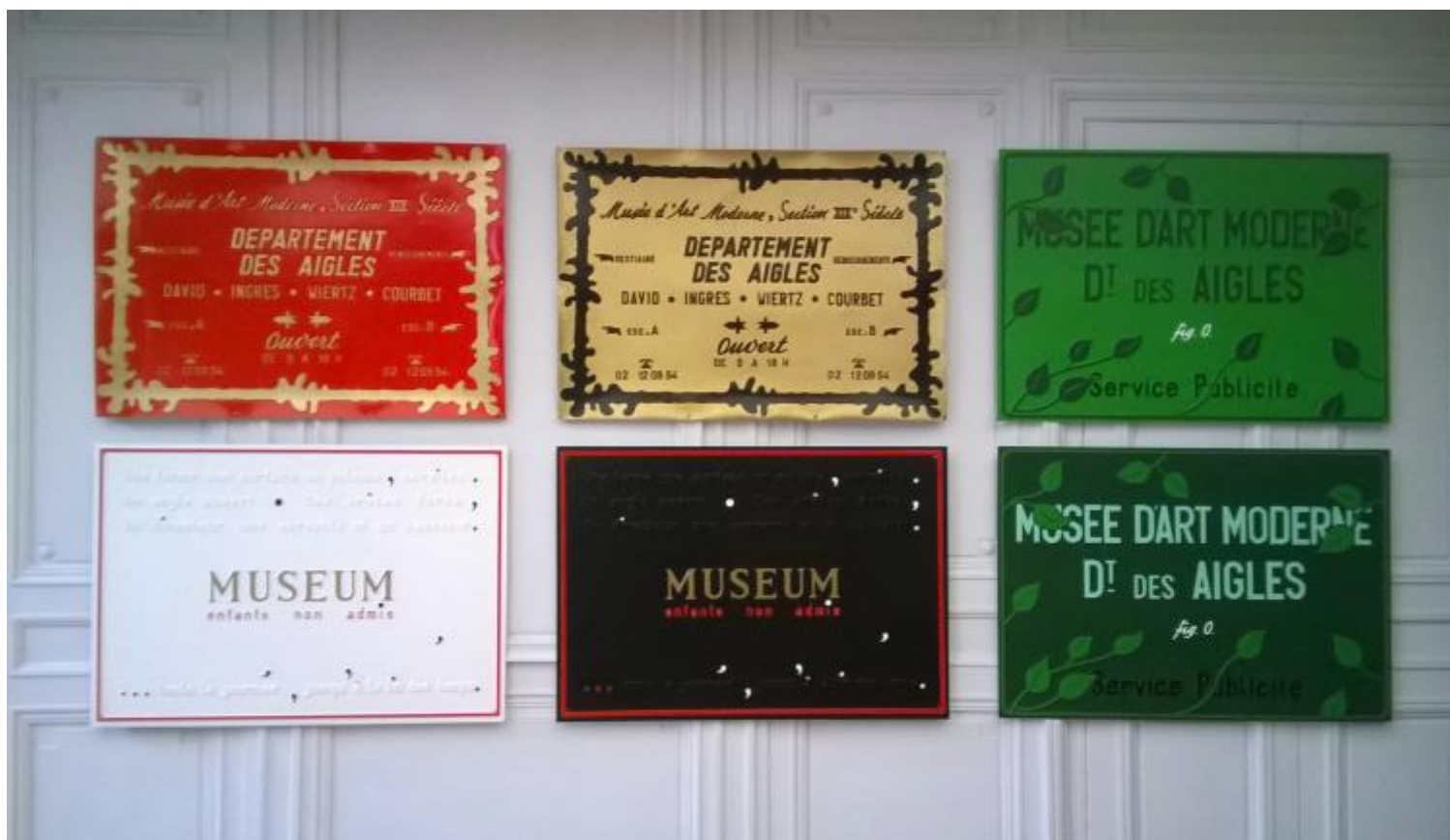
Poèmes Industriels, 1968/ 1970, serie di circa 30 placche di plastica, ottenute secondo il procedimento delle gaufres, ovvero pressate tra due piastre roventi che ne determinano la superficie in rilievo. Ognuna di essa è riprodotta in edizioni di sette copie negative e sette positive.

I messaggi di Broodthaers sono quasi sempre ambigui, sibillini e invitano chiunque si voglia accostare alle sue opere a un'operazione critica sugli strumenti di analisi e di comprensione, per non abbandonarsi mai a troppo facili considerazioni. Egli è difatti un artista, ma anche un poeta, un uomo di lettere, un intellettuale, un collezionista, un giornalista, un conferenziere. Le sue opere di primo acchito non risultano quasi mai particolarmente armoniose, seducenti o comunicative, ma piuttosto appaiono fredde, bizzarre e chiuse nella loro significazione. Buchloh nel saggio dedicato ai Poèmes Industriels , pubblicato sul n.42 di October (1987) interamente dedicato a Broodthaers, parlerà a proposito della sua pratica di assumption of modernist thought , dal momento che il suo procedimento creativo si modella sui processi di produzione industriale e si avvale dello stesso milieu in cui avviene la diffusione e l'assimilazione – spesso inconscia – della cultura di massa.