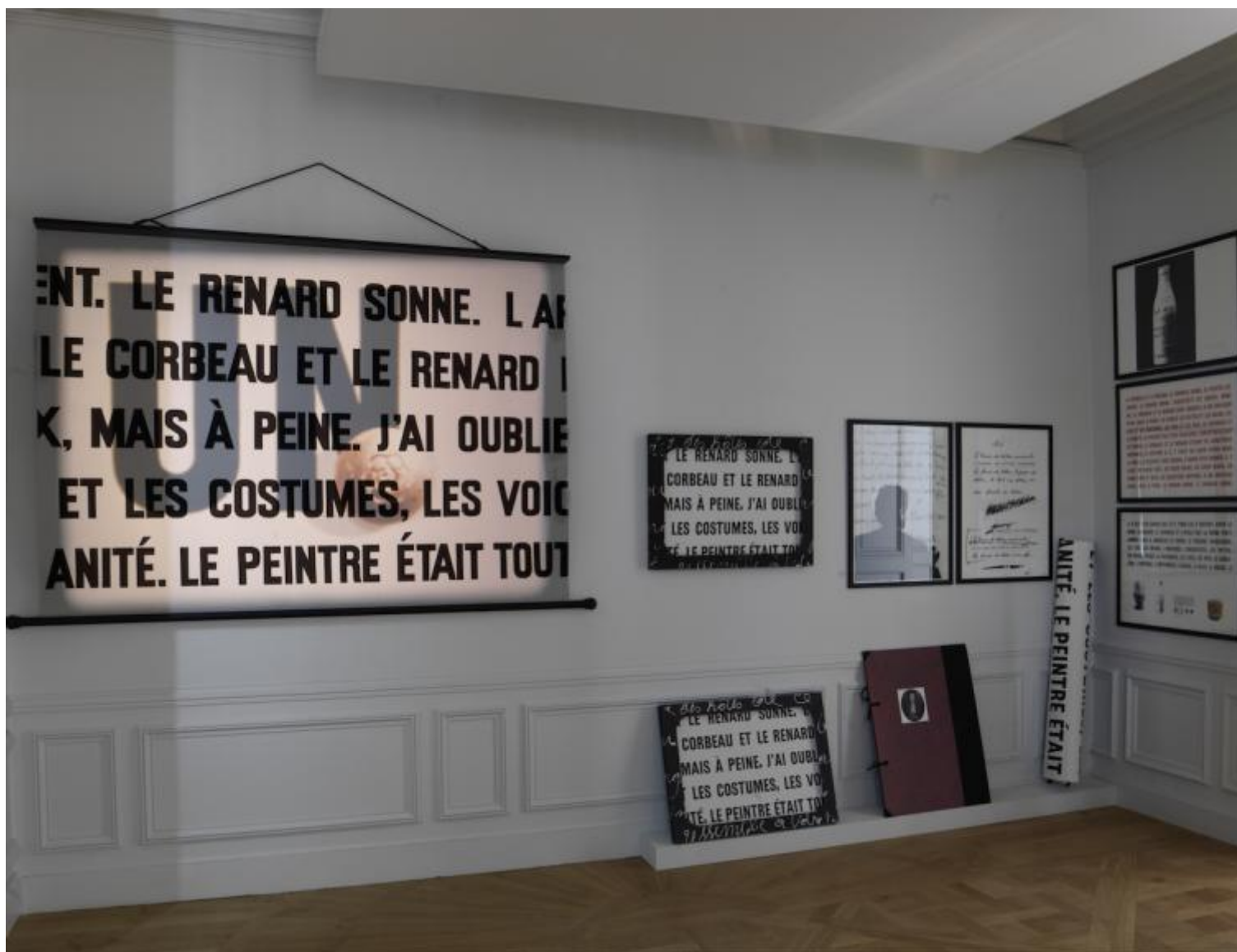
La Pipe, 1969; Un film de Charles Baudelaires (Carte Politique du monde), 1970; Le Corbeau et le Renard, 1967; La Pluie, 1969.

«L'idée enfin d'inventer quelque chose d'insincère me traversa l'esprit et je me suis mis aussitôt au travail [...]», scrive proprio così sull'invito alla sua prima mostra alla Galerie Saint-Laurent di Bruxelles, quando viene presentata la prima opera che arresta la sua produzione poetica: Pense-Bête (questo il titolo) si compone di cinquanta esemplari invenduti della sua ultima raccolta di poesie sui quali è stato fatto colare del gesso; il risultato finale è un unico blocco informe e a-funzionale, visto che è stata tolta ai libri la possibilità della consultazione.