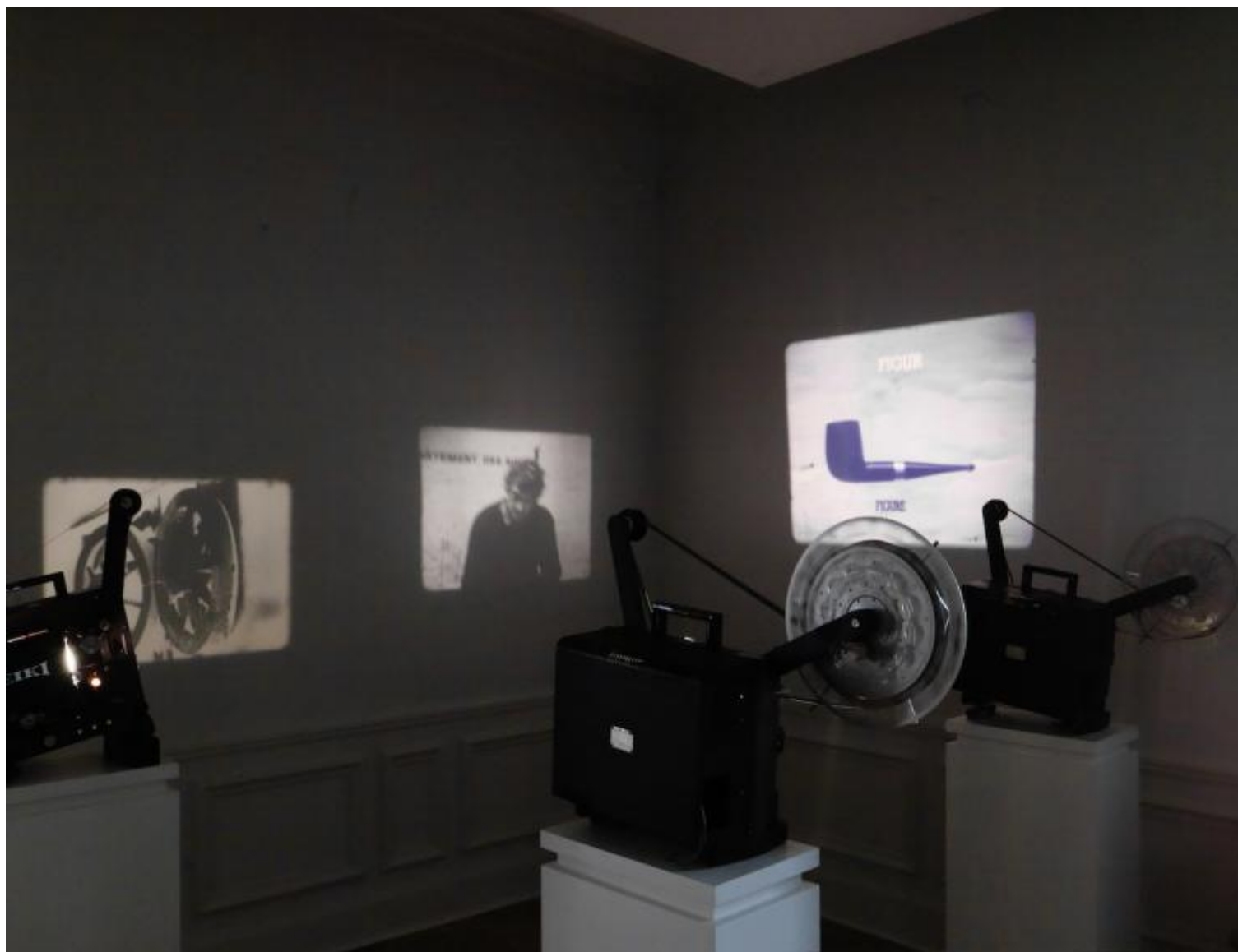
Cinéma Modèle è stata allestita per la prima volta nel 1970 e prevedeva la programmazione di cinque film: La Clef de l'Horloge (Un Poème cinématographique en l'honneur de Kurt Schwitters), 1957.