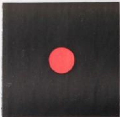
Hueco en el techo