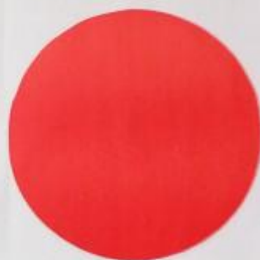
Grito en la noche