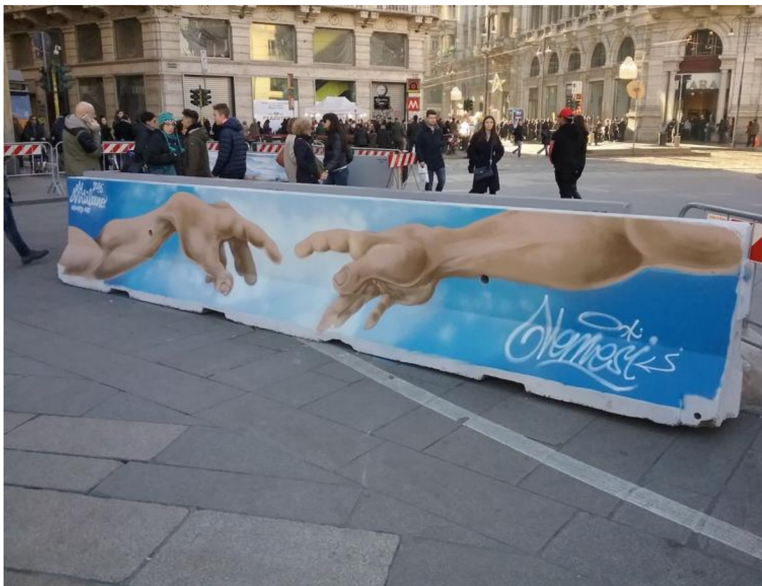
La creazione di Abramo di Nemesi.

Sull'altro lato di questo new jersey uno pseudo Oobleck raffigura quella che sembra una tendopoli che sta per essere inghiottita dal mare. Dalla mitologia greca alla tragica realtà che ogni giorno si consuma nel Mar Mediterraneo, per poi tornare, come in un continuo ciclo di morte e rinascita, alla tematica cristiana proposta da Nemesi Art, che ripresenta sulla barriera accanto “La Creazione di Adamo” di Michelangelo.