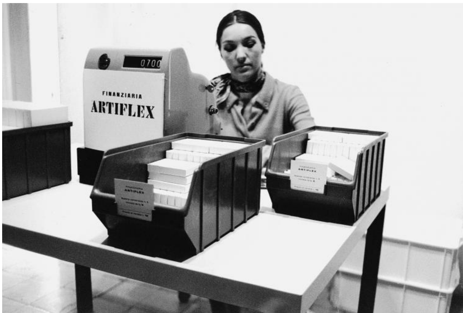
Gianfranco Baruchello, Artiflex (Finanziaria Artiflex) , 1968. Documentazione fotografica.

Questa seconda vita dura almeno fino al 1973, quando si trasferisce nella campagna romana, a Nord di Prima Porta. Qui fonda Agricola Cornelia S.p.A. , un progetto artistico, economico, produttivo e agricolo. Ancora una volta l'arte si presta a rappresentare la produzione, questa volta però nella materialità del prodotto agricolo e terriero. La coltivazione della terra, il mantenimento di una destinazione agricola anziché edilizia, sono i tratti alla base di questo progetto che dura fino al 1981. Senza abbandonare i linguaggi già sperimentati, le sue opere come il film Il grano (1974-75), o i suoi plexiglass e allumini, le sue scatole e i suoi oggetti si ispirano all'esperienza della produzione agricola. Nel 1978 un elicottero della polizia atterra nel suo giardino durante le ricerche di Aldo Moro, sequestrato dalle Brigate Rosse. Nel 1982 Francois Lyotard gli dedica il libro La pittura del segreto nell'epoca postmoderna (Feltrinelli, Milano 1982). How to imagine. A narrative on art and agriculture (McPherson & Company, New York 1983) è il libro tratto dalla conversazione tra Baruchello e il musicista Henry Martin sull'esperienza conclusa due anni prima e durata otto anni. Come ogni cosa fatta da Baruchello non viene però superata e accantonata ma i suoi echi si ritrovano successivamente non solo in questa recente mostra ma in libri come ad esempio Bellissimo il giardino (Exit, Lugo 1989).