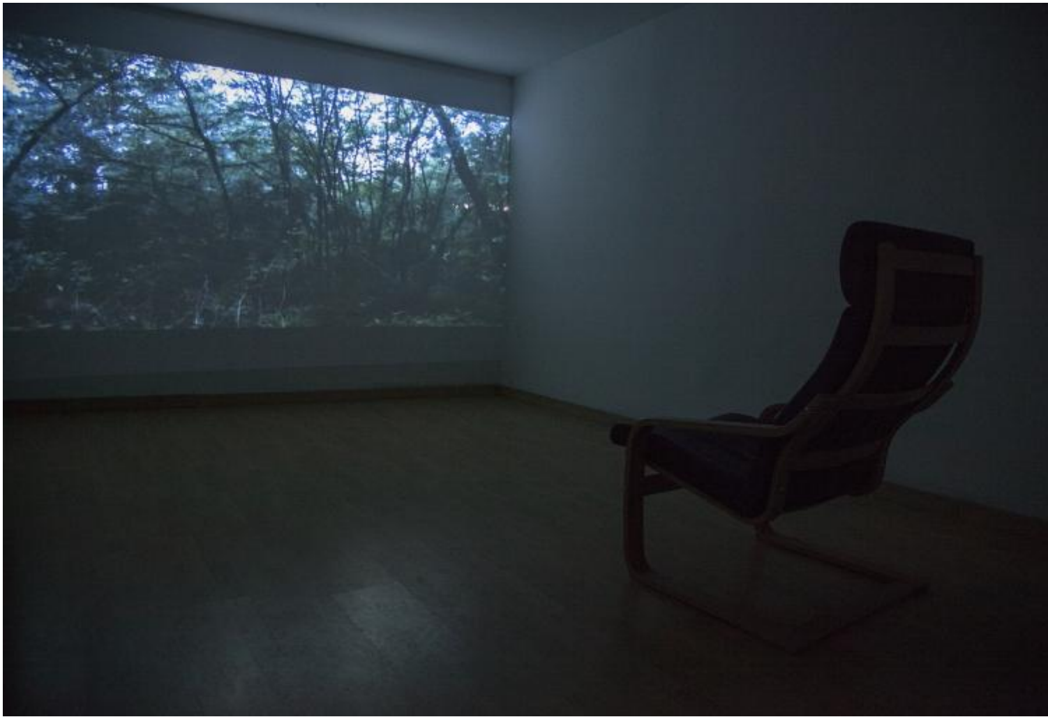
Gianfranco Baruchello, Earth Exchange. Courtesy Fondazione Baruchello.

Chiude il giro di giostra l'immersione dentro un bosco simulato, «possibile attivatore di pensieri e immaginazione». La visione di un bosco è proiettata in una sala dove l'ospite scende in solitaria alla ricerca di un'emozione «offerta» dall'artista e in cambio della quale dovrà donare una parola che la riassume.