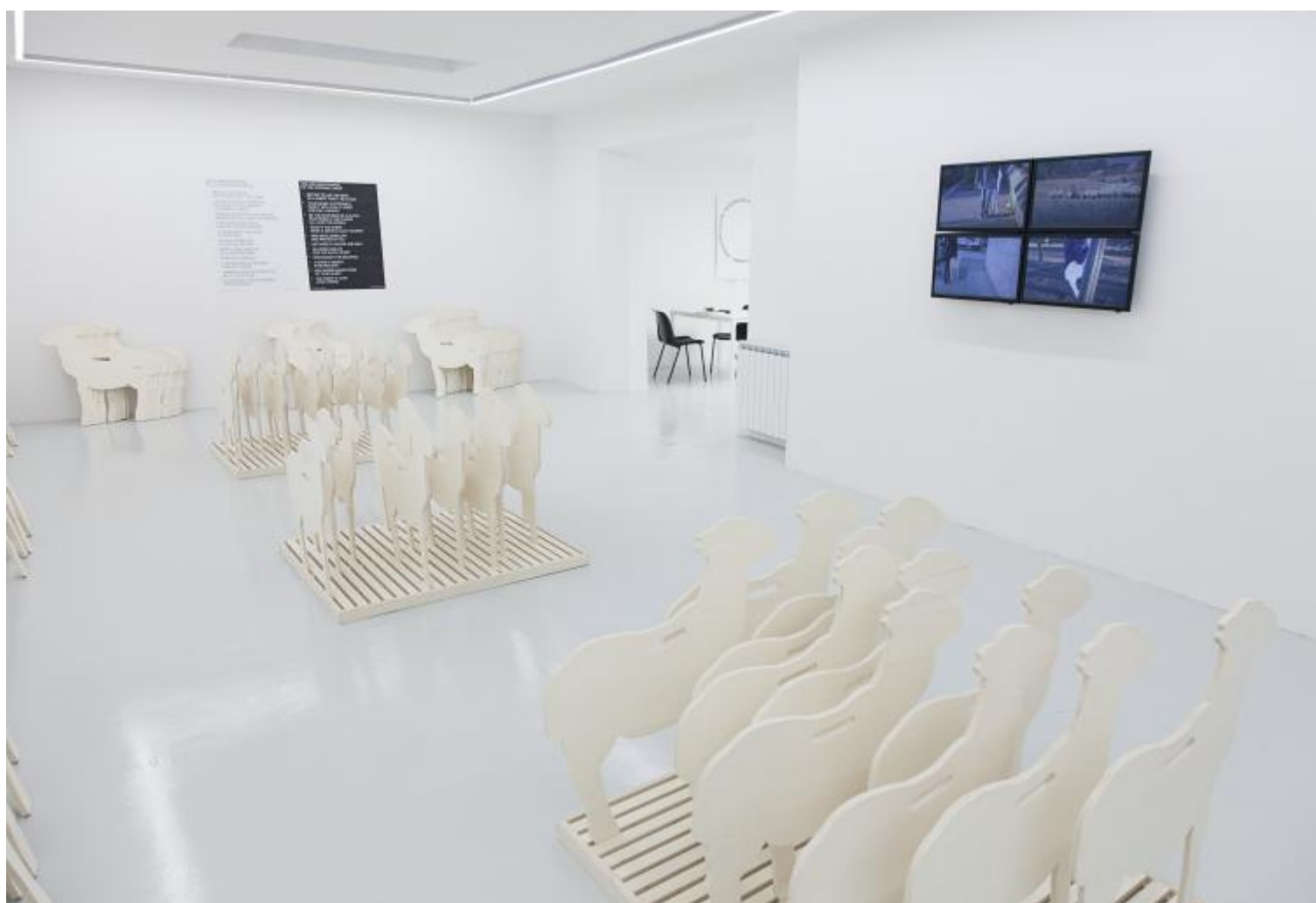
Gianfranco Baruchello, Adozione della pecora. Veduta dell’installazione.

Adozione della pecora è il nome della prima “agenzia”. «Sull’importanza, oggi, di ripensare la pecora» è in sintesi la chiave di volta su cui si sostiene l’operazione. Cento pecore sono esposte come in una showroom. Disposte sopra appositi espositori, griglie e mensole, le pecore sono sagome di legno compresso. Ognuna è timbrata, firmata e numerata. Ognuna è un’opera multipla, con la surreale e mistificatoria funzione di accompagnarci nelle nostre giornate, al parco, alla posta, al supermercato. Video promozionali ne illustrano i possibili usi. Altre immagini si riferiscono all’originale, che ne ha ispirato il surrogato. Compreso nell’acquisto un decalogo di buone maniere ad uso e consumo del collezionista per una nuova consapevolezza del mite animale in attesa di qualcuno che lo acquisti. Pardon: che lo adotti.