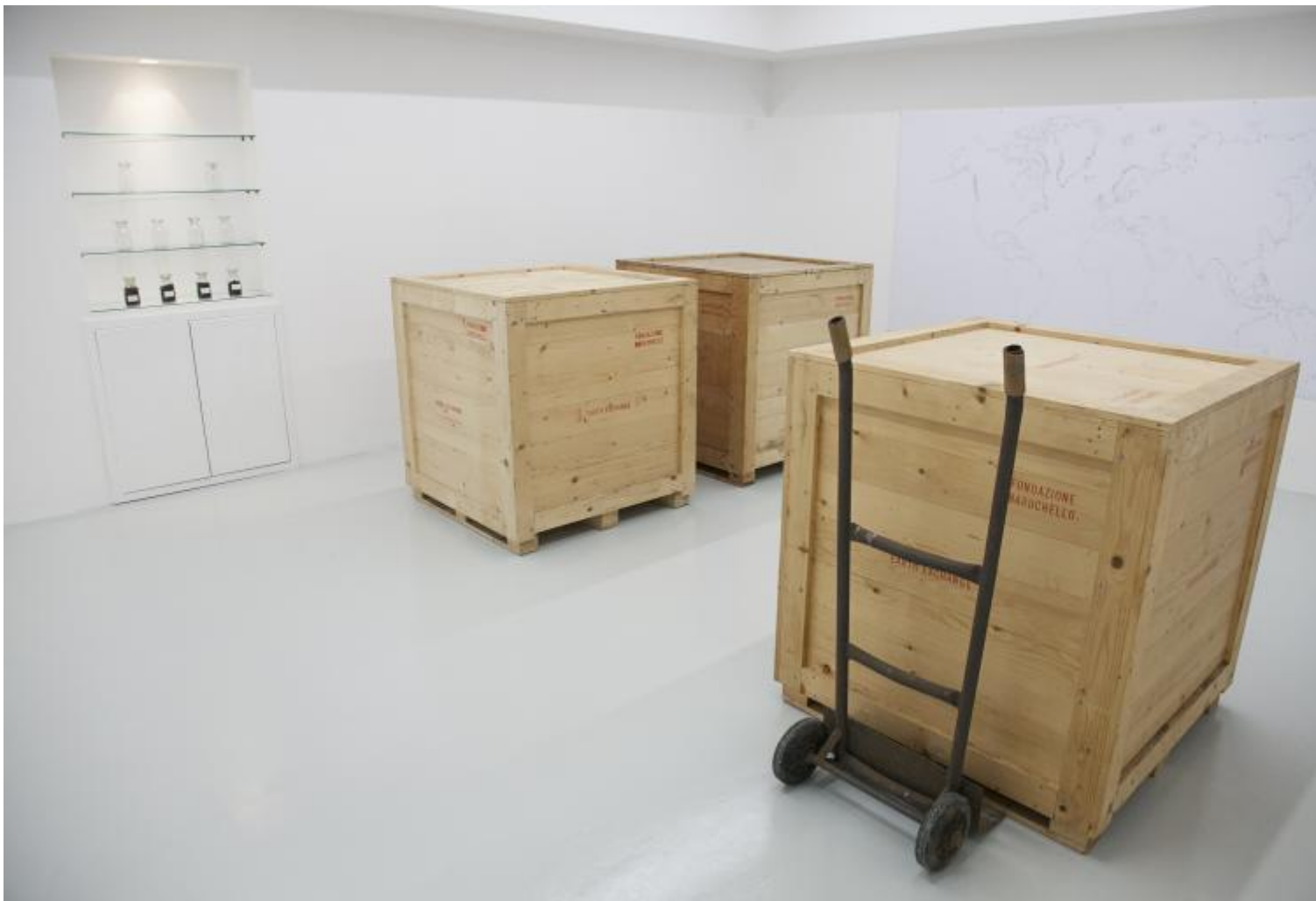
Gianfranco Baruchello, Earth Exchange. Veduta dell'installazione.

Anche per questa agenzia il luogo di partenza è la tenuta di via Cornelia. Dall'allevamento del bestiame alla coltivazione della terra, la seconda agenzia riguarda un progetto inaugurato nel 2008: uno scambio di terreno tra aziende agricole. In tempi di sharing economy , cioè economia generata non dall'impresa, ma dalla condivisione di azioni quotidiane che svolgeremmo comunque – come dare un passaggio a qualcuno mentre andiamo al lavoro in auto o ospitare chi ne ha bisogno a casa nostra in cambio di un rimborso spese –, qui si parla di condivisione dei terreni, con la particolarità che in questo caso per essere scambiati questi devono corrispondere a determinate caratteristiche chimiche. «Custode dei valori antichi e patrimonio del vivente», la terra può generare o meno la vita. Le due casse dentro la stanza custodiscono a lor volta lo scambio di terreni. Una piena del terreno di via Cornelia, l'altra vuota sono inviate entrambe a una seconda azienda, da cui usciranno entrambe riempite per metà del terreno di una tenuta e per l'altra metà di quello della seconda tenuta con cui è avvenuto lo scambio. Entrambe le tenute diverranno a loro volta custodi di una delle due casse contenenti il terreno condiviso.