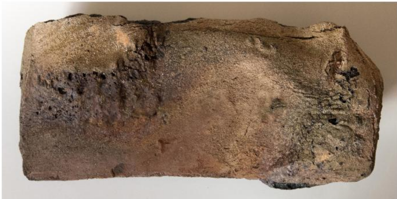
Mattone storto deformatosi al contatto con l'atmosfera