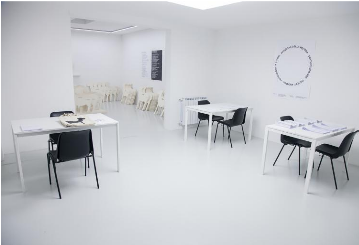
Start Up. Quattro agenzie per la produzione del possibile. Veduta della mostra.

termini sono a volte soggetti a interpretazioni e usi diversi non sempre uniformi, tanto da lasciare lo spazio per qualche dubbio più o meno dichiarato in chiunque non sia un economista di nuova generazione o non abbia nel suo curriculum professionale almeno uno di questi progetti. La confusione è tale che persino sulla corretta scrittura ci sono diverse scuole di pensiero. Chi abusa della maiuscola, chi separa i diversi termini, chi li unisce con il trattino e chi opta per una forma minuscola e tutta attaccata a sottolineare il neologismo e l'accezione comune del termine .