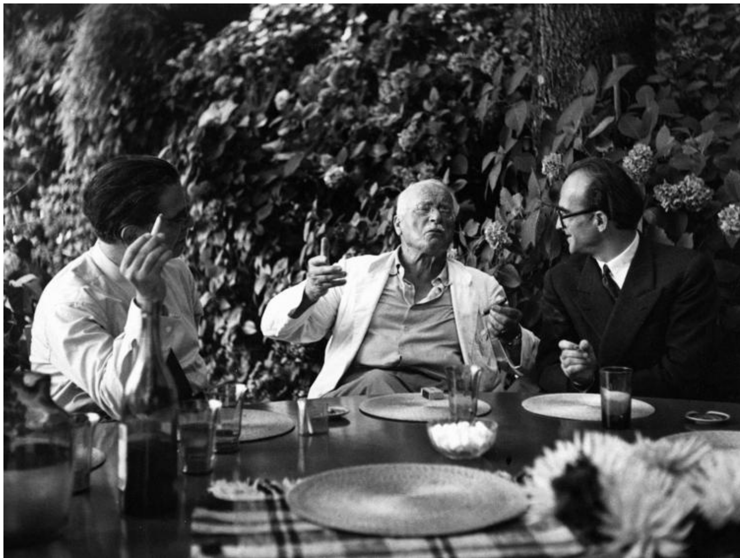
Jung, Neumann, Eliade

molto ferma e non priva, come ammetterà lo stesso Neumann, di una certa dose di aggressività che tuttavia non sfocia in rancore né mette a rischio la relazione di amicizia e stima reciproche, anzi: è un segno di piena fiducia in essa: “Non mi sento di cambiare nulla di questa lettera. Così è scritta e così rimane. Spero che sia comprensibile l’intenzione con cui l’ho scritta. Credo che sia proprio la mia gratitudine nei Suoi confronti a impormi la sincerità”.