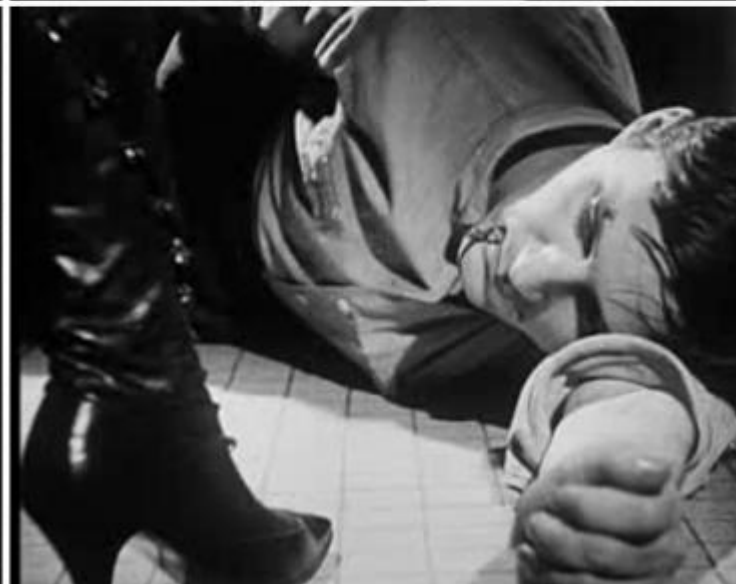
“Noviciat” (1965), di Noël Burch.

Si tratta insomma di passare al cinema tout court . Non necessariamente facendo film, ma rimanendo fedeli, da dentro la teoria, a ciò che davvero definisce il cinema, ovvero l'estraneità di ciò che penseremmo come intimo. Questo è quanto compie L'amour des femmes puissantes , un volume in cui Burch si mette letteralmente a nudo, innanzitutto in senso biografico. In esso egli rivela, infatti, ciò che molti indizi nel corso