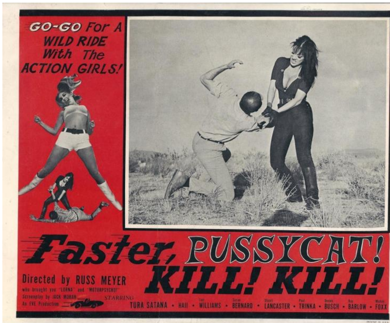
Locandina di "Faster, Pussycat! Kill! Kill!" (1965), di Russ Meyer.

Dai fumetti del periodo interbellico a Russ Meyer, da serie tv di successo come Dark Angel e Relic Hunter ai video amatoriali sul tema facilmente reperibili in rete: tutto contribuisce, secondo Burch, a indicare nella viragofilia l'elefante nella stanza dell'antropologia statunitense, lo scenario fantasmatico segretamente (ma nemmeno troppo) soggiacente di un'intera civiltà. Come già sottolineava Leslie Fiedler nel capitale Amore e morte nel romanzo americano , l'imponente processo di civilizzazione di un intero continente che ha dato luogo agli States ha avuto come premessa fondativa l'allontanamento e finanche l'esclusione della "europea" autorità paterna. Da qui il grande potere simbolico che l' homo americanus è disposto a concedere all'altra metà del cielo, controbilanciato da quello reale (politico, economico, sociale etc.) che invece mantiene saldamente nelle proprie mani.