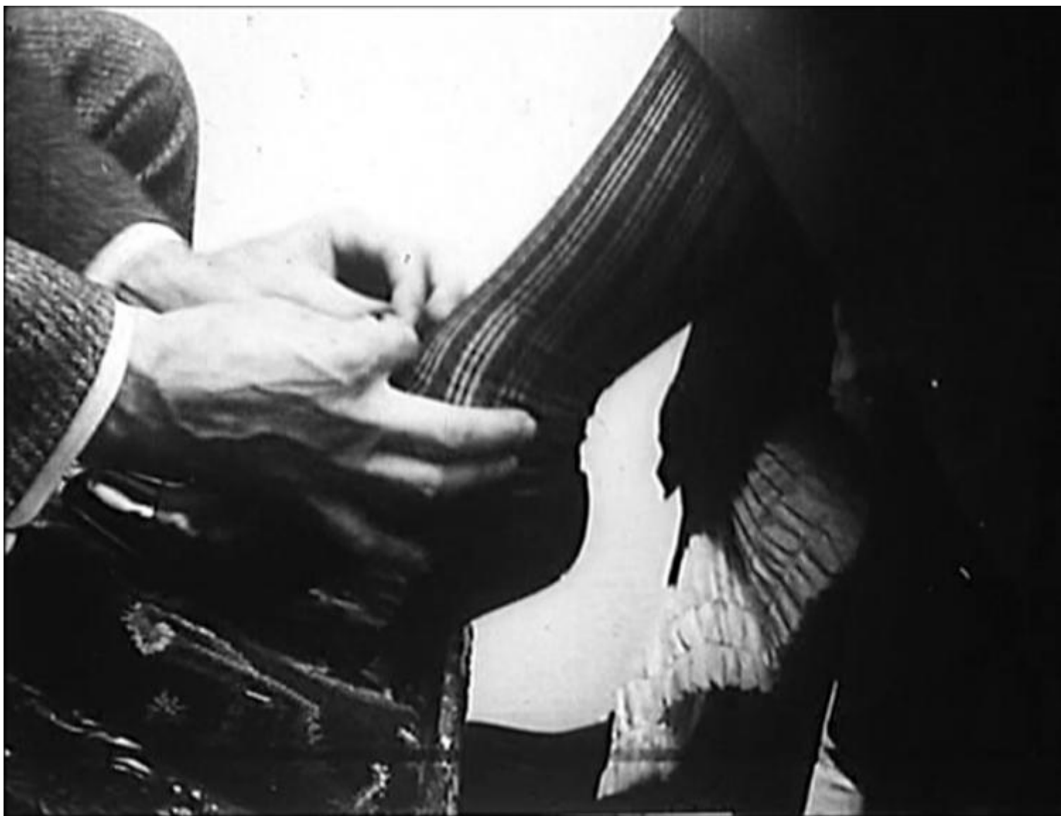
"The Gay Shoe Clerk", (1903), di Edwin S. Porter.

Non meno indispensabile è Il lucernario dell'infinito (1991), documentatissima dissezione del cinema delle origini compiuta al fine di ricostruire come si sia passati dalla ricchezza primigenia a quel Modo di Rappresentazione Istituzionale che imbriglia le risorse del cinema negli schemi narrativi mutuati dal teatro naturalista dell'Ottocento, e che conoscerà con Hollywood il proprio apogeo. Fra i due, il giustamente pluricelebrato To the Distant Observer (1979, inedito in Italia), frammenti di un discorso amoroso verso il cinema giapponese, cuciti insieme in modo da far sembrare quest'ultimo come una sorta di alternativa vivente all'imperialismo dell'incorreggibilmente occidentale Modo di Rappresentazione Istituzionale . Prendendo spunto da Barthes e ritorcendolo con un colpo da maestro contro lo strutturalismo stesso, Burch impugna un impressionante numero di film nipponici per dimostrare che da quelle parti si è riusciti a mettere in piedi un cinema maggiormente capace di staccarsi dalla standardizzazione hollywoodiana, grazie a un modo di legare insieme campo e fuoricampo inconcepibile alle nostre latitudini.