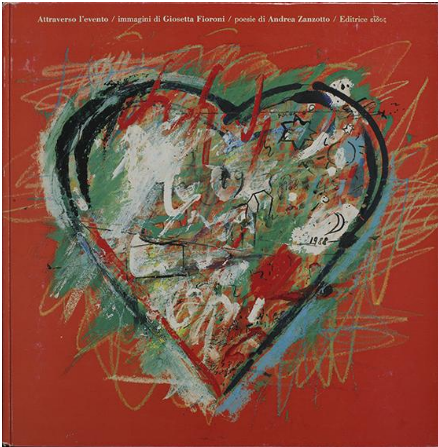
Attraverso l'evento , poesie di Andrea Zanzotto. Immagini di Giosetta Fioroni, Eidos, 1988.

C'è insomma, alle fondamenta del mondo aereo e delicato di Giosetta, un fondo terragno e silvano , una base materica fatta di sedimenti pazienti e improvvise stupefazioni. Davvero una base magica è quella in cui decantano gli umori meno gentili, gli estri meno socievoli dell'artista; e dove si può fare l'esperienza dello sconcerto e del turbamento, se non proprio del panico (l'ultimo episodio, in tal senso, sono i Disegni della Paura datati 2013 – che possono costernare, per la secchezza del tratto e l'asprezza dell'immaginazione).