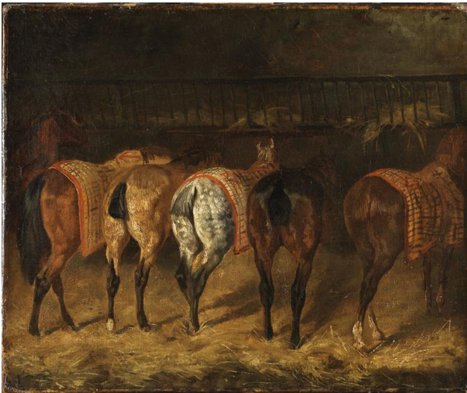
Gericault, cinq chevaux.