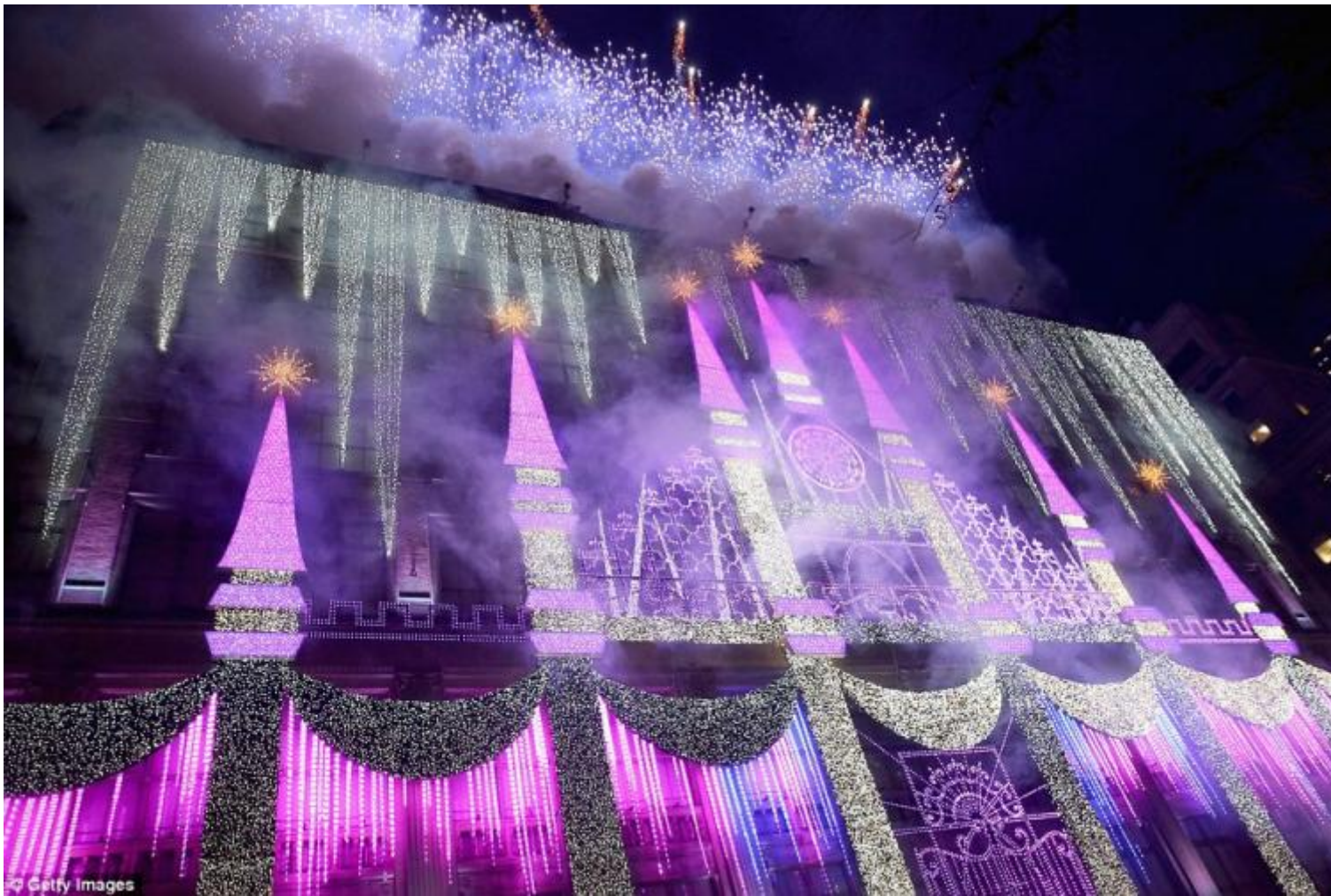
Saks su Fifth Avenue