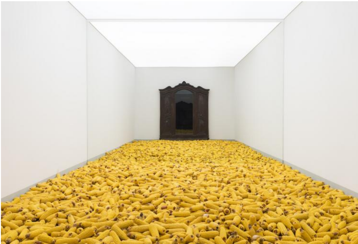
Marzia Migliora, Stilleven, 2015 installazione, 500x700x400 cm veduta dell'installazione al Padiglione

Fino ad allora mi ero sempre considerata una fotografa: grazie all'incontro con le «a.titolo» iniziai invece a capire che potevo essere anche qualcos'altro e che c'era un mondo infinito oltre la fotografia. Iniziai così a cercare di sperimentare e rompere i miei stessi criteri di visione. Nel 1999 dalla fotografia passai pertanto al video, realizzando una serie di undici brevi video nel cortile della casa in campagna dove vivevo da piccola. L'elemento per me interessante di quel cortile era la totale assenza di barriere: non c'erano staccionate a separare lo spazio possibile da quello impossibile. Mi sono cioè resa conto di aver vissuto un'infanzia in una dimensione spaziale e mentale sconfinata. In questi undici episodi del video dal titolo Chi c'è c'è ho nuovamente giocato nel mio cortile: una sorta d'esercizio di riappropriazione della memoria.