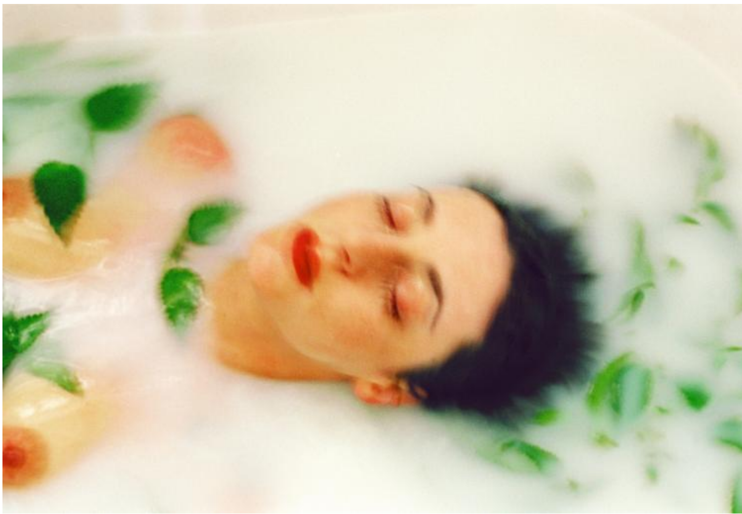
Marzia Migliora, ortiche, 2001 stampa fotografica a colori cm.70x100