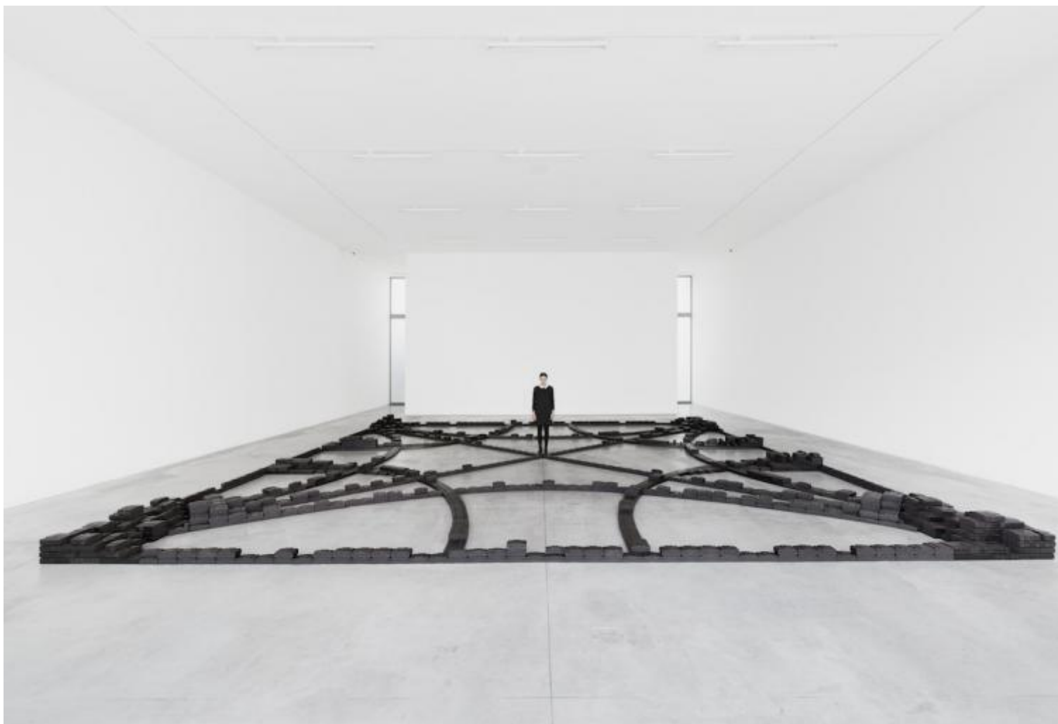
L'ideazione di un sistema resistente e? atto creativo, 2016 Mattonelle di carbone, site specific installation 1000x900 cm

Durante gli anni di studio a Firenze eri solita frequentare l'ambiente artistico cittadino?