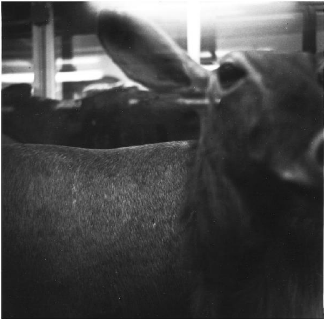
Marzia Migliora, Musei il doppio interno, 1995, stampa b/n su carta baritata, dimensioni variabili courtesy dell'artista.

Dalle prime fotografie scattate nei musei di anatomia patologica, ai lavori ispirati o eseguiti in edifici dismessi, alle installazioni dedicate alla cecità fisica o mentale, fino ai progetti con riferimenti alla morte o inerenti alle problematiche dell'attuale mondo del lavoro, Marzia Migliora sceglie quale motore del suo operare il rimosso: ovvero tutto ciò che la società nasconde, mette in disparte, reprime, in quanto altrimenti fonte di angoscia, senso di colpa e del freudiano sentimento del perturbante. Così come in psicanalisi il rimosso è ciò che deve essere portato in luce per superare una nevrosi, nel lavoro di Marzia Migliora è il veicolo per innescare riflessioni su noi stessi, su ciò che ci circonda e che ci ha preceduto nello spazio e nel tempo.