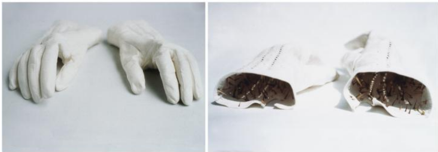
Marzia Migliora, Piacere, 2001 guanti in pelle bianca, spine, cm. 22x30 Edizione unica

Il disegno è rimasto un medium fondamentale anche quando ho iniziato a lavorare site-specific. Quando mi trovo di fronte a spazi per me sconosciuti, sento sempre il bisogno di passarci del tempo, di appuntarmi idee e suggestioni, e infine di stilare un elenco di persone del luogo che desidero incontrare per individuare l'identità specifica di quel posto.