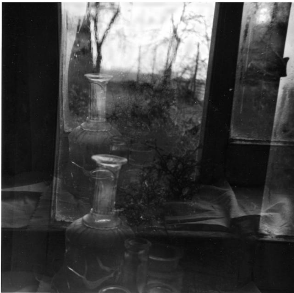
Marzia Migliora, Senza titolo, 1995, stampa b/n su carta baritata, dimensioni variabili.

Le mie prime esposizioni corrispondono alle collettive degli studenti organizzate dalla scuola al termine di ogni anno scolastico. Alla fine del primo anno esposi un lavoro dedicato a edifici abbandonati, mentre alla fine del secondo e del terzo anno esposi delle serie fotografiche realizzate all'interno di musei.