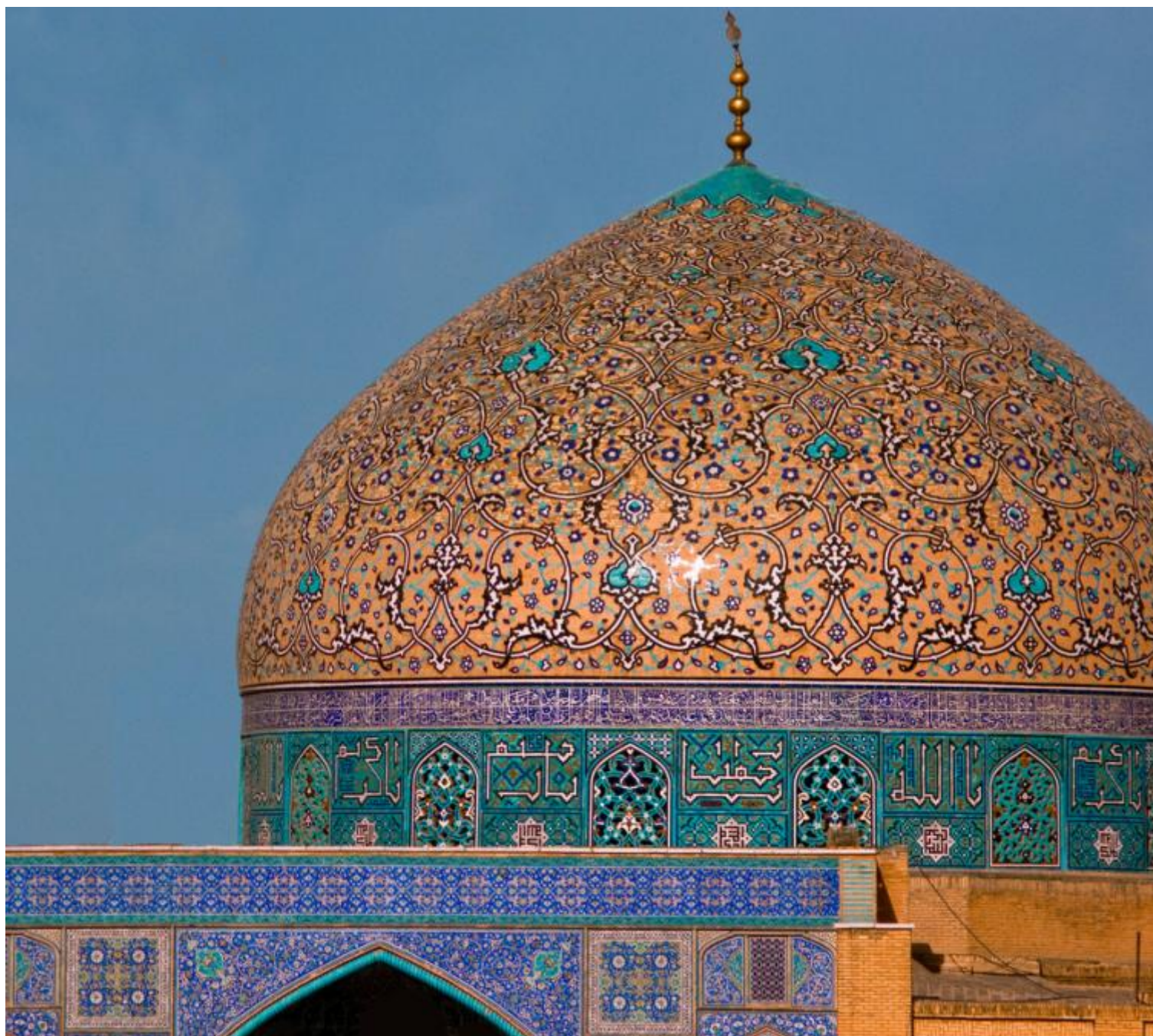
Cupola della moschea dello sceicco Lotfollah, Esfahan.

Torâh e che non la osservarono, assomigliano all'asino che porta i libri [...]”. Tuttavia è soprattutto nei versi di poesia persiana inseriti nella decorazione che questa mobilità si manifesta attraverso varie figure retoriche. Nel mihrab della moschea dello sceicco Loʔfollʔh troviamo due versi di una poesia in lingua Farsi: