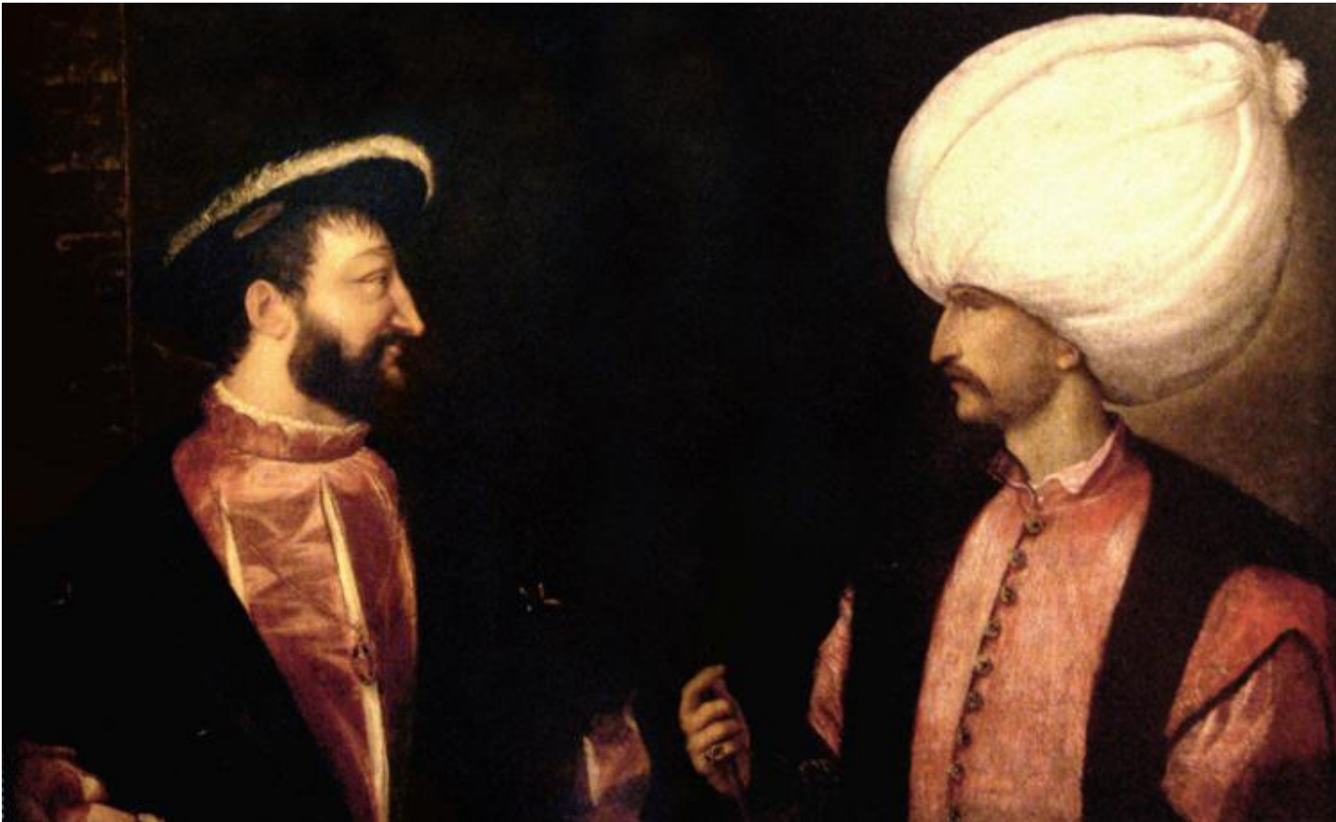
Scuola di Tiziano, ritratto del sovrano Francesco I e del sultano Süleyman, 1530.

L'architetto esalta la parola coranica in ottemperanza a una politica di stato che ha lo scopo di affermare il sultanato, legandolo a una ortodossia sunnita forzata che si cristallizza con il regno di Süleyman, in opposizione e conflitto con gli Sciiti safavidi (troviamo qui uno degli aspetti che ancora oggi caratterizzano l'idea politico-religiosa di sultanato sunnita a cui, secondo alcuni politologi, ambisce Erdogan). A questo riguardo sono significative le iscrizioni di fondazione della moschea Süleyman a Costantinopoli composte dal giurista Ebussuud utilizzando frammenti di versetti coranici. Una di queste definisce il sultano: "l'ombra di Dio su tutti i popoli". Attraverso una metafora al giurista sfugge inavvertitamente un'immagine potente e terribile.