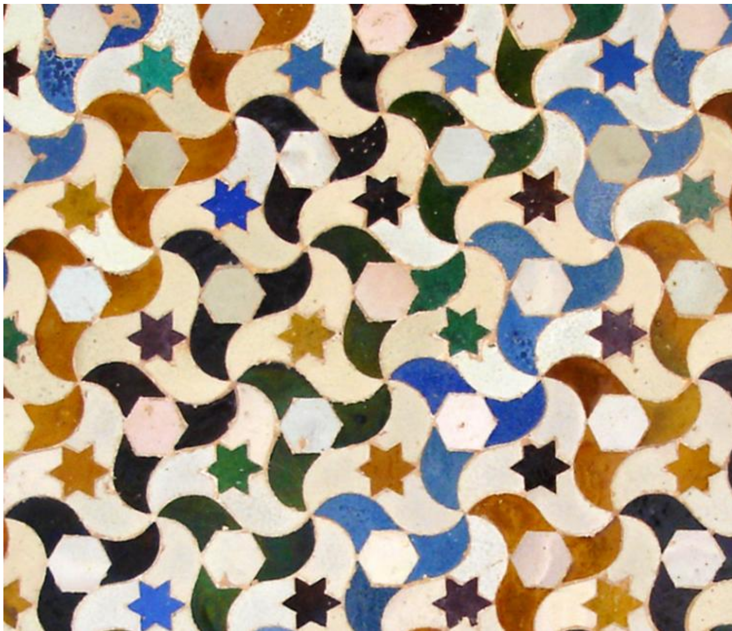
Decorazione musiva, Alhambra, Granada.

Oltre agli studi dello psicologo danese Edgar Rubin sul rapporto tra figura e sfondo, furono anche i motivi grafici ricorsivi che decorano gli interni del complesso residenziale dell'Alhambra a influenzare Escher. Il suo sistema di lavoro consiste infatti in una suddivisione geometrica della superfici già in uso nella decorazione musiva dell'architettura antica.