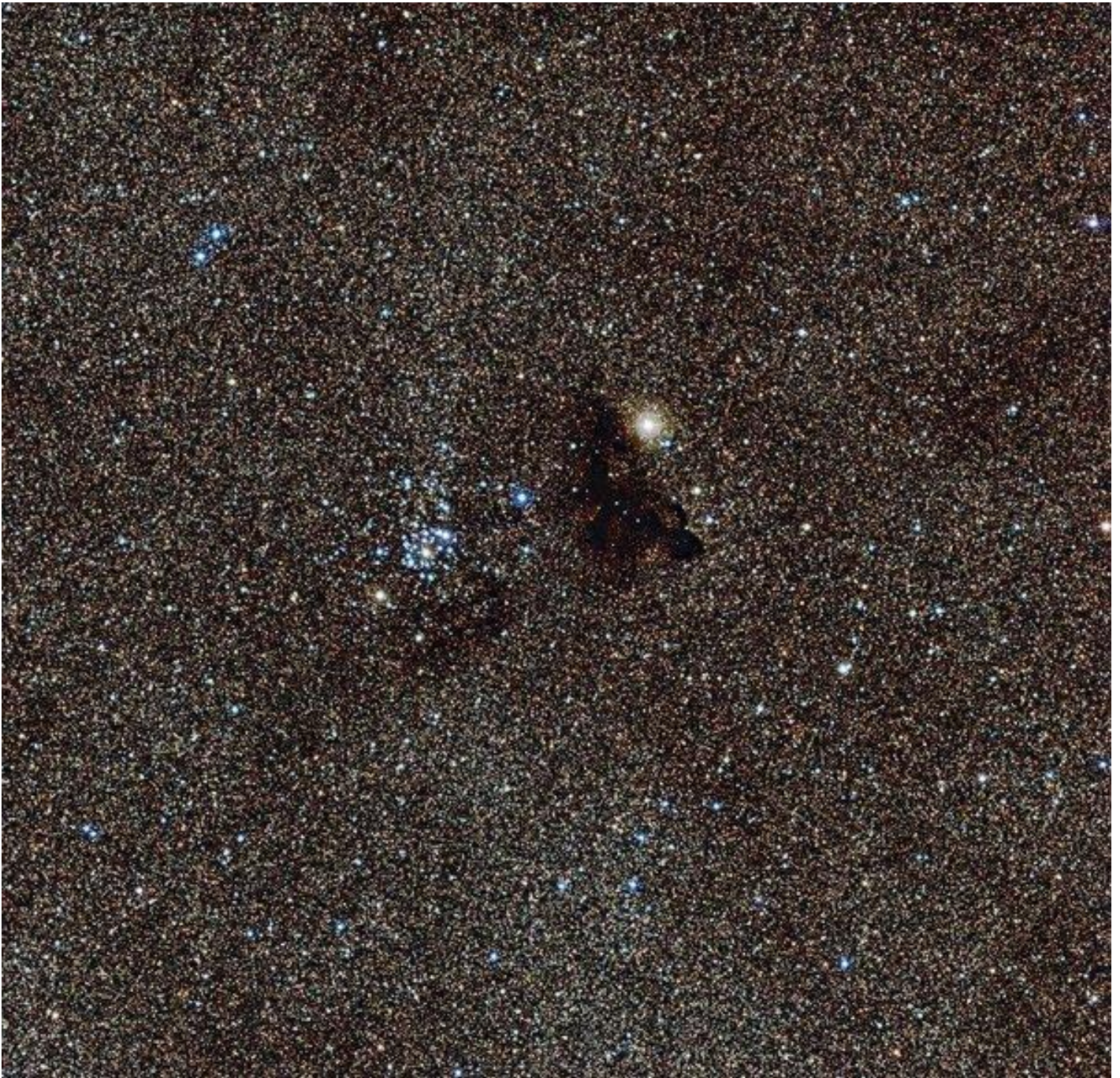
Starry night chile.

Lo stesso Darwin era consapevole che le difficoltà di far comprendere le sue scoperte, in contrasto con il senso comune e controintuitive, fossero legate soprattutto al fatto che le teorie creazioniste, così come i miti , sono più semplici, appaganti e in definitiva facili da credere. In questo senso la teoria darwiniana della selezione naturale, compie uno scatto rispetto all'alternativa secca tra il caso e l'intelligenza: con la sua intrinseca legalità, essa rende superflua l'idea di una intelligenza progettuale preposta al perseguimento degli scopi negli organismi. Tale idea non è più necessaria per lo svolgimento di una funzione, che può venire così in modo autonomo e autofondante.