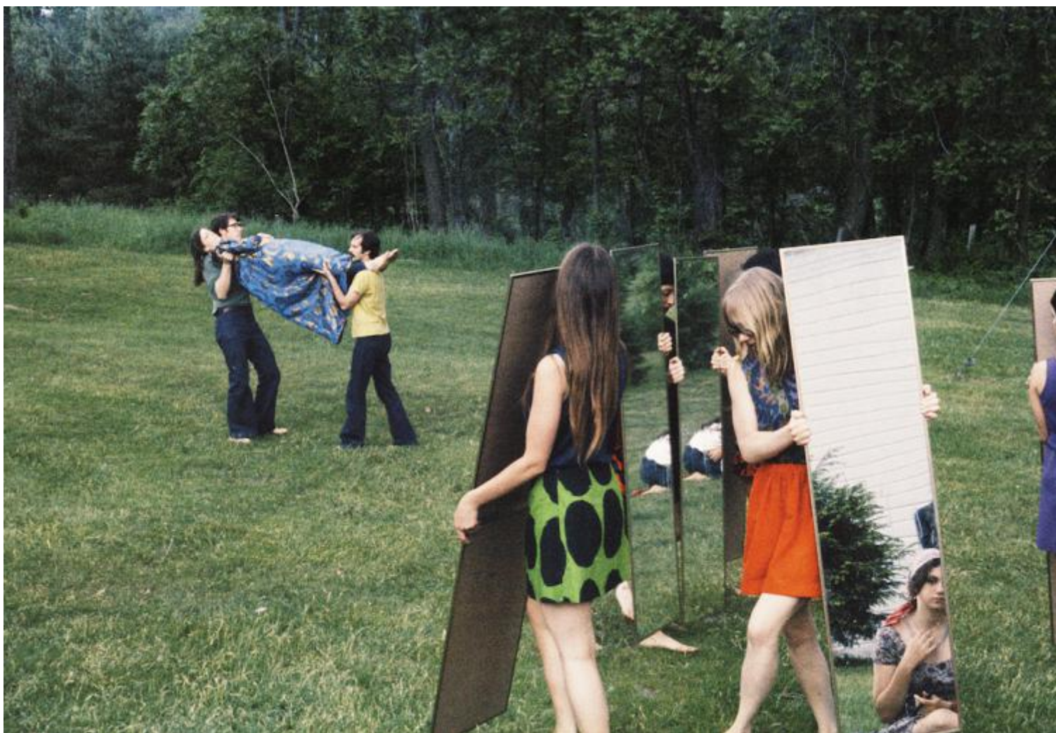
Joan Jonas, performance, 1969.

fotografiche reflex, che hanno un sistema in grado di proiettare l'immagine dall'obiettivo verso un vetro interno. Già un semplice specchio concavo, comunque, può proiettare un'immagine su una superficie piana.