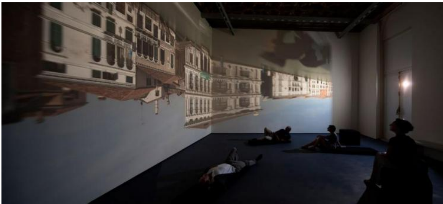
Zoe Leonard, Campo San Samuele.

Dopo un lavoro trentennale con il medium della fotografia, l'artista americana ha messo in scena, nella sua opera-camera oscura, immagini non registrate, non analogiche né digitali, ma semplicemente solo luce che penetra attraverso un buco nella finestra e respira e vive (capovolta) su una superficie piana. In questo passo indietro rispetto ai mezzi della fotografia e dei video, e in questo arretrare rispetto a tutte le sofisticate e artefatte riflessioni dell'arte contemporanea, Zoe Leonard ottiene il modo più diretto e semplice per contemplare ciò che si vede, osservando come agiscono il nostro cervello e il nostro sguardo. In questo arretramento verso le origini si innesca un ulteriore tentativo di capire come la persona pensa alla sua vita quotidiana quando si trova in uno spazio del presente.