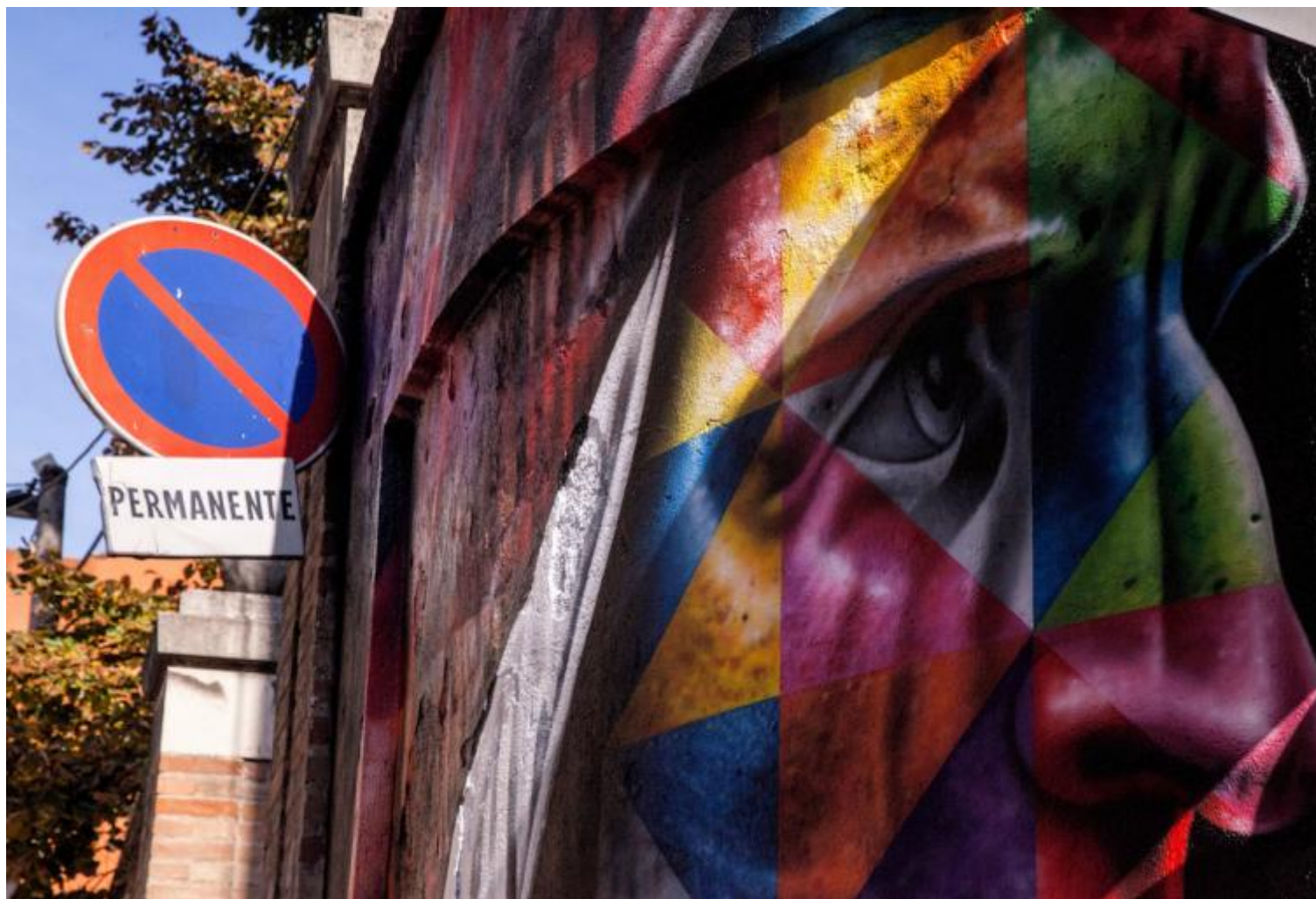
Kobra, “Dante Alighieri”, 2016, 2,5x2,5 m, tecnica mista con aerografo su parete (dettaglio).

Gettare Dante nel mondo, di nuovo: ecco quel che penso fra me e me, mentre con S. e la curatrice lasciamo la biblioteca per andare a pranzo. Più tardi, voltando l'angolo di una delle vie del centro storico, mi sento all'improvviso osservato. Alzo la testa e scorgo dapprima il profilo gigantesco di un naso aquilino, poi una bocca leggermente imbronciata, appena sfiorata da una mano enorme, e infine due occhi altrettanto grandi, persi in chissà quali lontane visioni. La figura multicolore (giallo, blu, verde, rosa, rosso: tutti disposti secondo una texture geometrica) emerge dal fondo nero di un muro. È il Dante che cercavo. Lontano dai luoghi deputati, il poeta diviene tutt'uno con gli spazi del nostro quotidiano: sul margine inferiore, una vecchia scrostatura attraversa l'opera come una lunga cicatrice orizzontale, coperta (ma non mascherata) dal colore; mentre in alto, a fianco del murales, sotto un cartello di divieto di sosta, campeggia la scritta “Permanente”. Sì, decisamente Dante è tornato nel mondo. E sembra volerci rimanere a lungo.