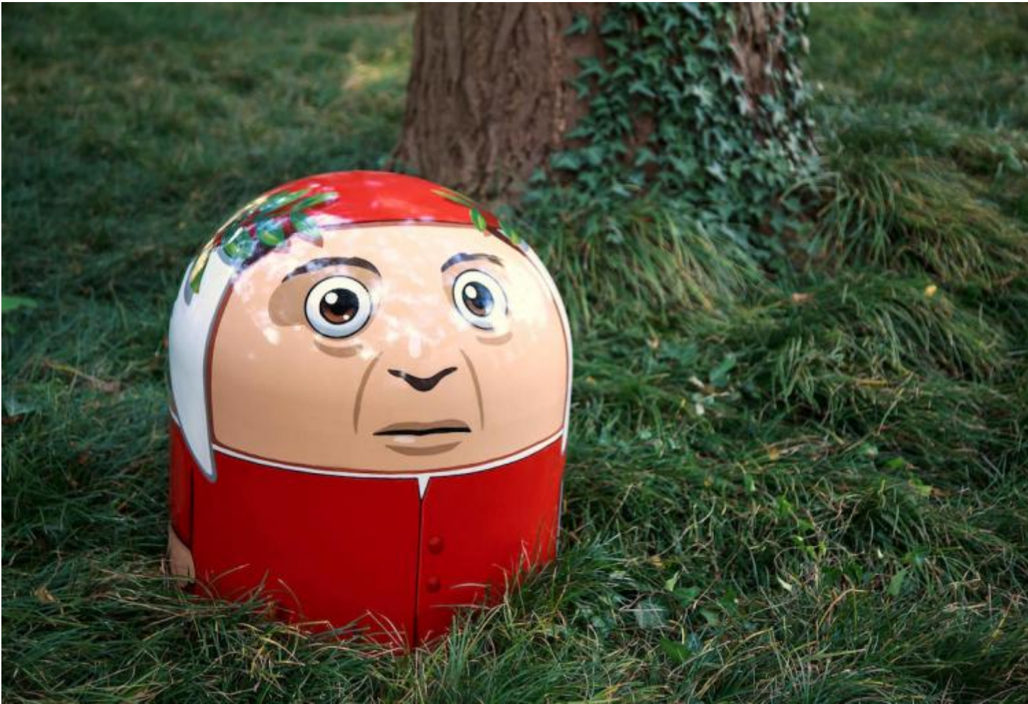
Pao, "Dante", 2016, 50x50x55 cm, tecnica mista su PVC e legno.

In fondo, che male c'è se Dante si trasforma in un fumetto o in un'icona pop al pari della Marilyn di Warhol? Se alla fine degli anni Quaranta del XX secolo un artigiano lo appendeva in casa come segno, a suo modo, di distinzione e prestigio culturale; e se un ragazzino, mezzo secolo dopo, poteva tranquillamente incontrarlo fra le pagine di un giornalino a fumetti, significa che la figura di Dante è da tempo immemorabile parte di un comune repertorio di immagini: tutti abbiamo in mente il volto di Dante. Ha ragione la curatrice della mostra, Maria Vittoria Baravelli, quando scrive che «dal 1300 a oggi, abbiamo assistito a un consolidamento definitivo tra la figura fisiognomica dell'Alighieri e la sua produzione letteraria». E questo nonostante di lui sia sopravvissuto ben poco: a parte un pugno di dati biografici, incerti e spesso contraddittori fra loro (l'ultima Vita di Dante , scritta da Giorgio Inglese per i tipi di Carocci, ha come sottotitolo l'eloquente Una biografia possibile ), nessuna traccia di manoscritti autografi, Commedia inclusa. Addirittura, c'è anche chi per lungo tempo ha sospettato che il mausoleo ravennate in cui tutt'ora sono ospitati i resti del poeta, fosse in realtà un cenotafio, un contenitore vuoto.