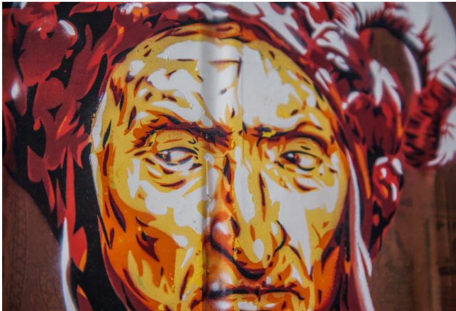
Diavù, “Dante Inferorum Pater”, 2016, 35x50 cm, tecnica mista su legno (dettaglio).

ripetibile all'infinito, sia pur con minime variazioni: Andrea del Castagno, Domenico di Michelino, Botticelli, Raffaello, Bronzino, Doré, lo stesso Holiday... Per non parlare della triviale “pietrificazione” ideologica effettuata dal Risorgimento e dal fascismo. Dapprima Profeta inascoltato dell'unificazione nazionale («Ahi, serva Italia...»), Dante diventa in seguito colui che per primo aveva fissato i termini dei “sacri confini” della Penisola (ricordate? da Arles «ove Rodano stagna» a Pola, «presso del Carnaro/ch'Italia chiude e i suoi termini bagna»): quasi un alibi letterario per le più bieche imprese nazionalistiche, da Fiume in giù.