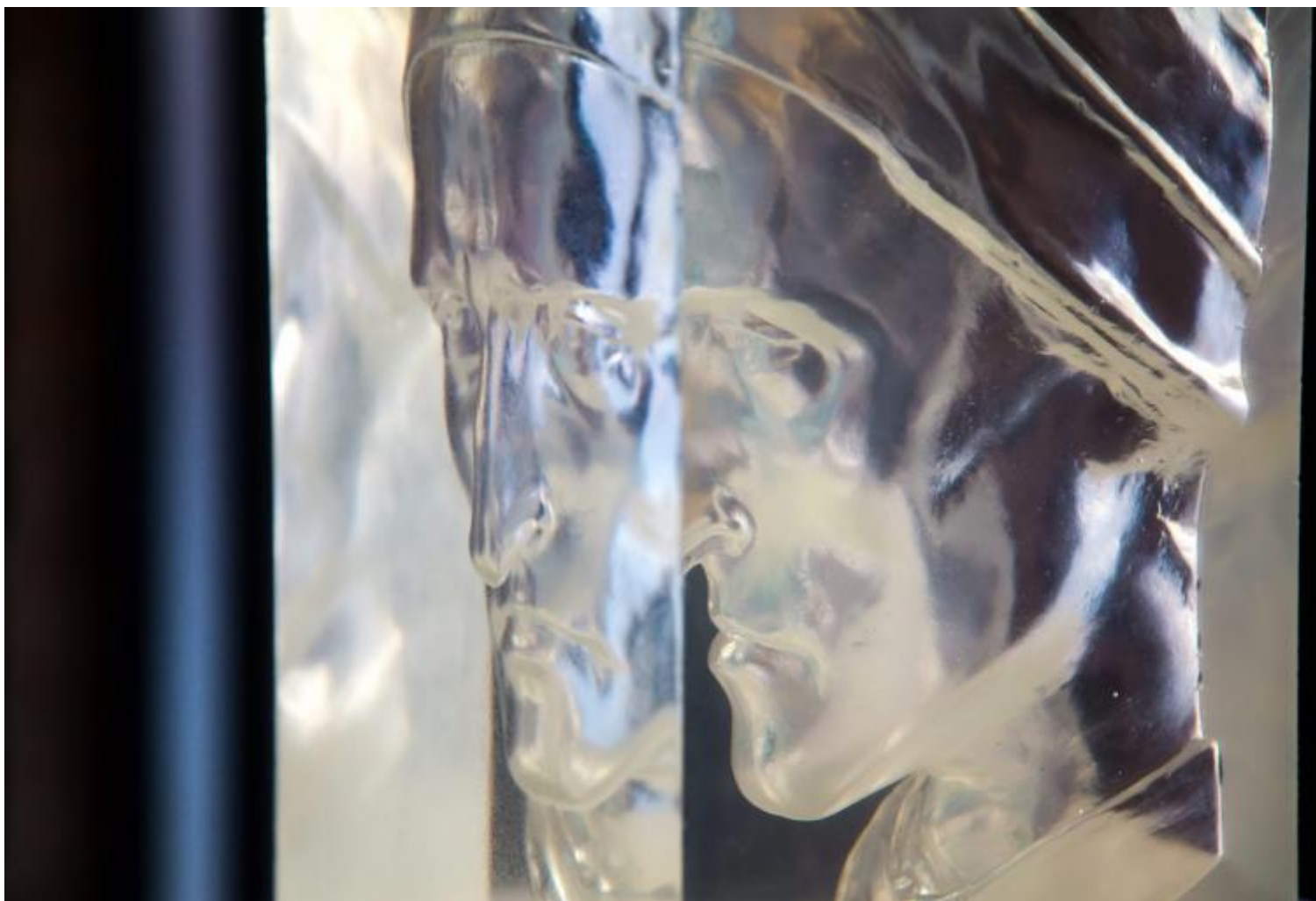
Kicco Cracking, “Cocito”, 2016, 22,8x17,5x37,5 cm, tecnogel.

Ancor più stupefacente, dunque, il permanere nella memoria collettiva della traccia più volatile di tutte, l'aspetto fisico. Tanto più che neppure il celeberrimo ritratto che ne fa Boccaccio nel suo Trattatello in laude è frutto di un'osservazione diretta (sebbene per tracciarlo si fosse basato su testimonianze di persone che avevano conosciuto Dante di persona): «Fu adunque questo nostro poeta di mediocre statura [...]. Il suo volto fu lungo, e il naso aquilino, e gli occhi anzi grossi che piccioli, le mascelle grandi, e dal labbro di sotto era quel di sopra avanzato; e il colore era bruno, e i capelli e la barba spessi, neri e crespi, e sempre nella faccia malinconico e pensoso». È curioso come il dettaglio del colorito bruno e della barba crespa (che le donne del popolo attribuivano appunto al suo andirivieni dagli abissi infernali) sia stato prontamente omesso dalle raffigurazioni – diciamo così – ufficiali: un Dante con il volto mal rasato? Via, non scherziamo. Non sono mancati, anche in passato, coloro che hanno cercato di discostarsi dall'oleografia. Penso a Mario Tobino, il quale, leggendo il Purgatorio sui banchi di scuola, immaginava che Dante si fosse autoritratto nel personaggio di Manfredi: «biondo era e bello e di gentile aspetto». Per quanto improbabile, è sicuramente un'ipotesi suggestiva.