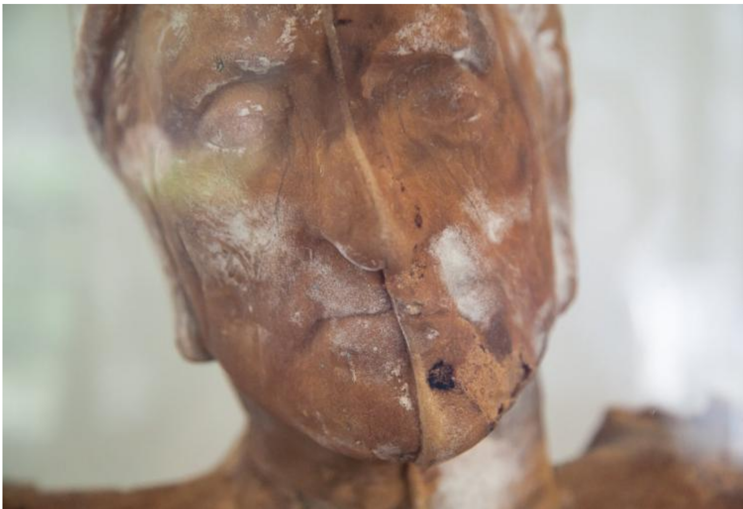
Matteo Lucca, "Dante Bread", 2016, 14x10x18 cm, pane (dettaglio).

Altri artisti hanno deciso invece di muoversi in direzione contraria, sforzandosi di operare una sorta di “trasfigurazione materica” della figura del poeta, dare all'icona corpo e volume. È la strada che trovo più stimolante, anche quando il risultato finale non mi convince del tutto. Mosaico, metacrilato, PVC, legno, nastro adesivo e persino pane: il volto di Dante rivive così, non più immagine idealizzata nelle pagine (chiuse) di un qualche vecchio libro, ma corpo calato nello spazio con tutto il suo peso. Al Dante appiattito su una qualche tradizione preferisco decisamente un Dante presente e pesante .