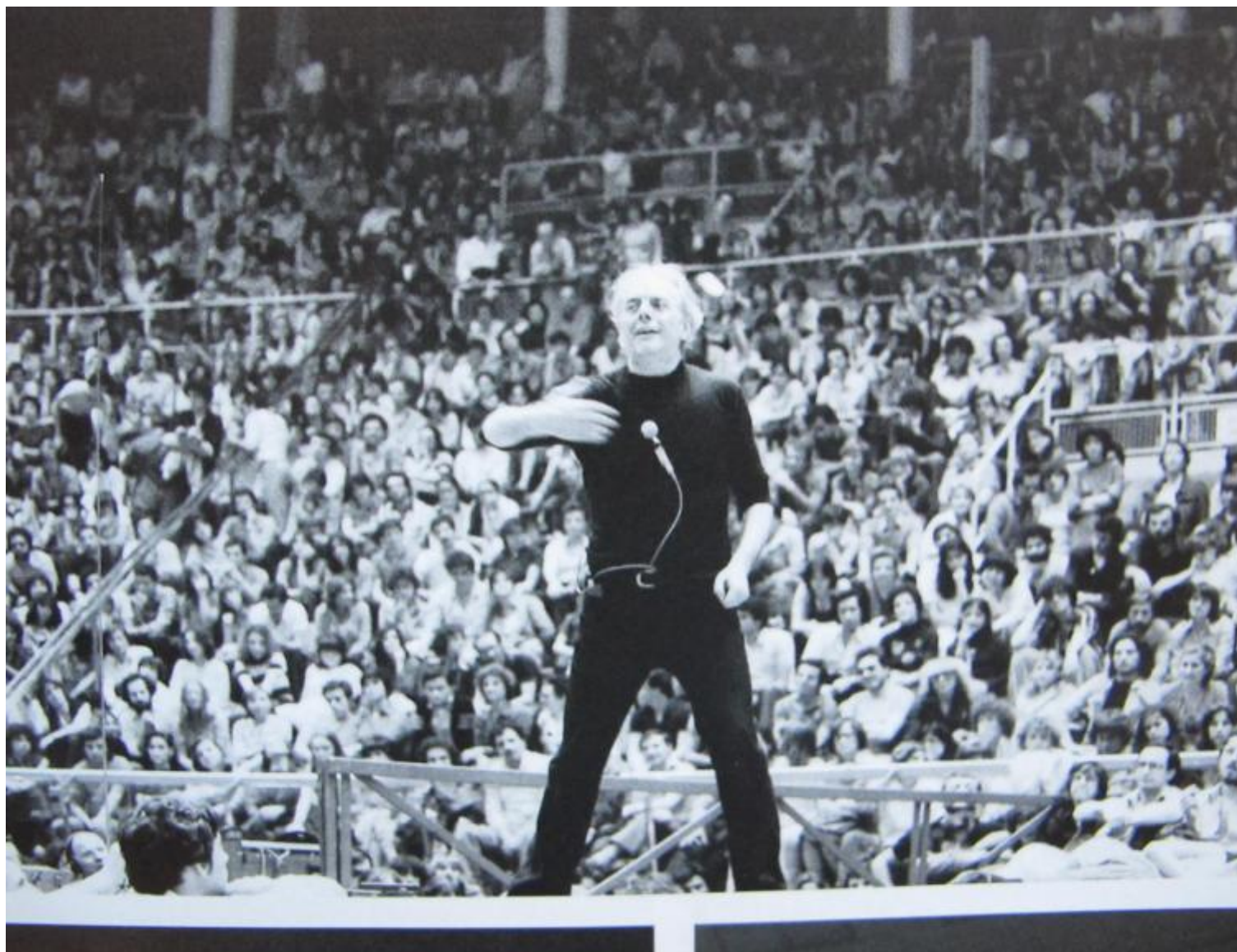
Mistero Buffo (Bologna, 1977)