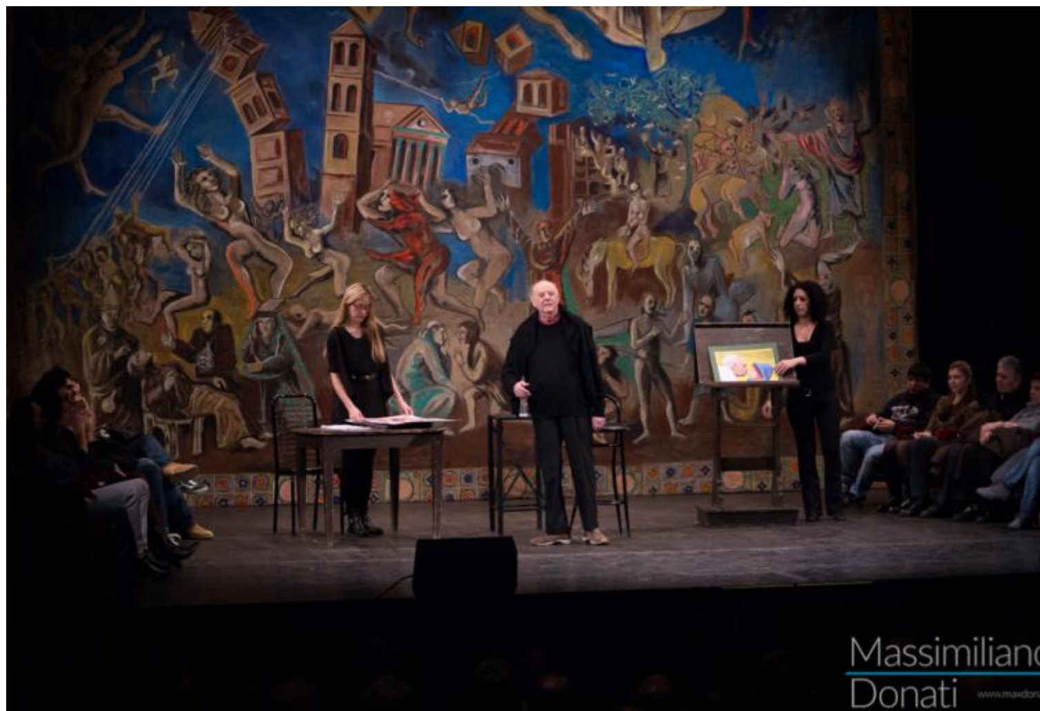
Santo Jullare (Teatro Duse)

Se n’è andato lottando, lavorando fino all’ultimo minuto, guardando, dai suoi 90 anni, avanti.