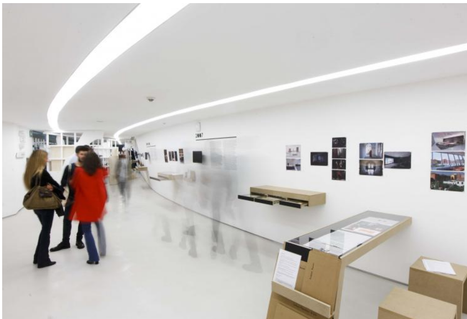
Premio MAXXI | Reading Room