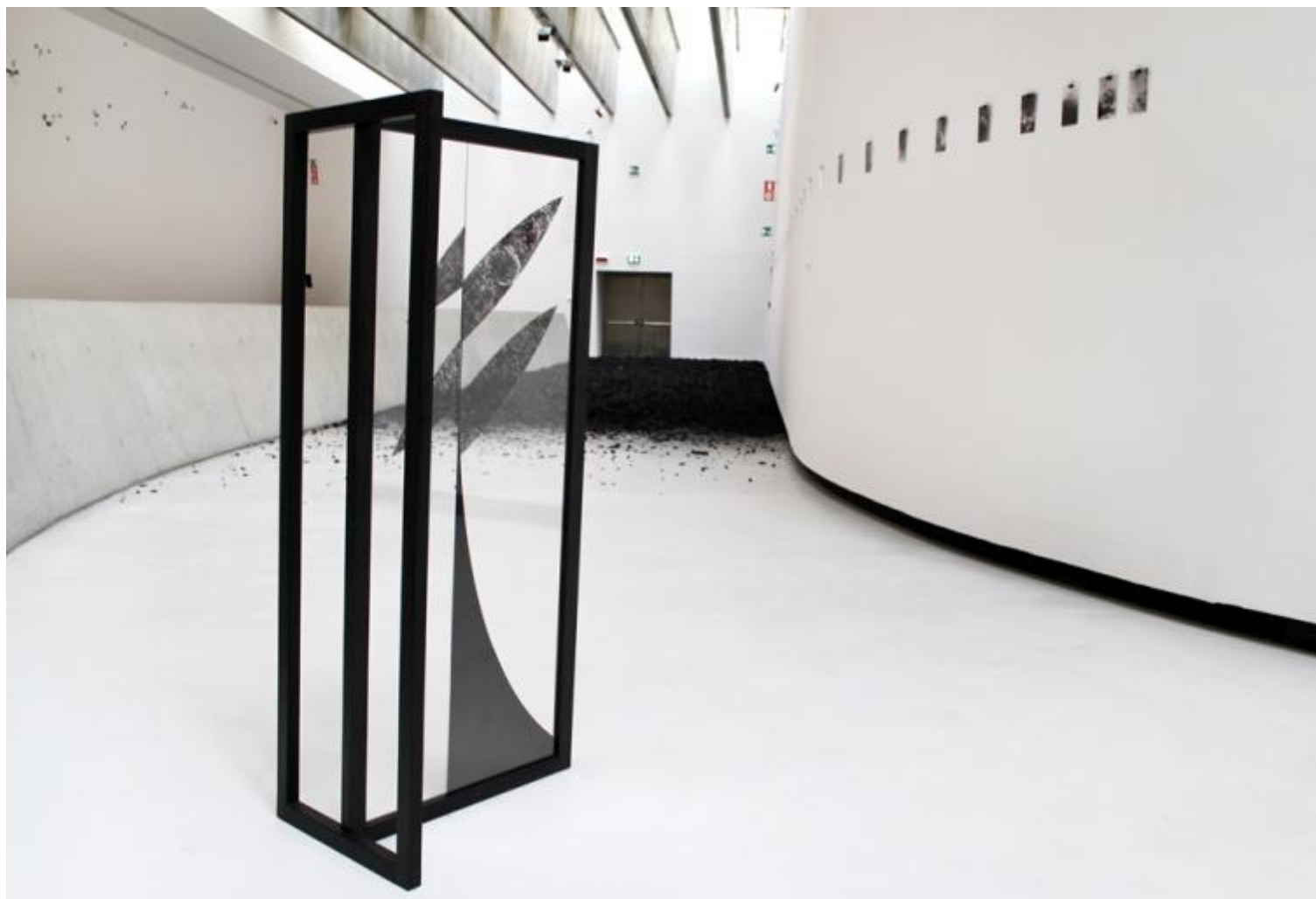
Riccardo Arena Orient 1 - Everlasting Sea 2016

In Orient 1 – Everlasting Sea ripercorri parte della tua esperienza in Russia alla ricerca di una verità cosmica. Ne distribuisce le tracce e le suggestioni lungo tutto lo spazio dal pavimento all’altezza massima della parete, rendendo inaccessibili molte delle loro parti. Si può parlare del tuo lavoro come di uno strumento cognitivo? Come di una ricerca al tempo stesso personale e spirituale?