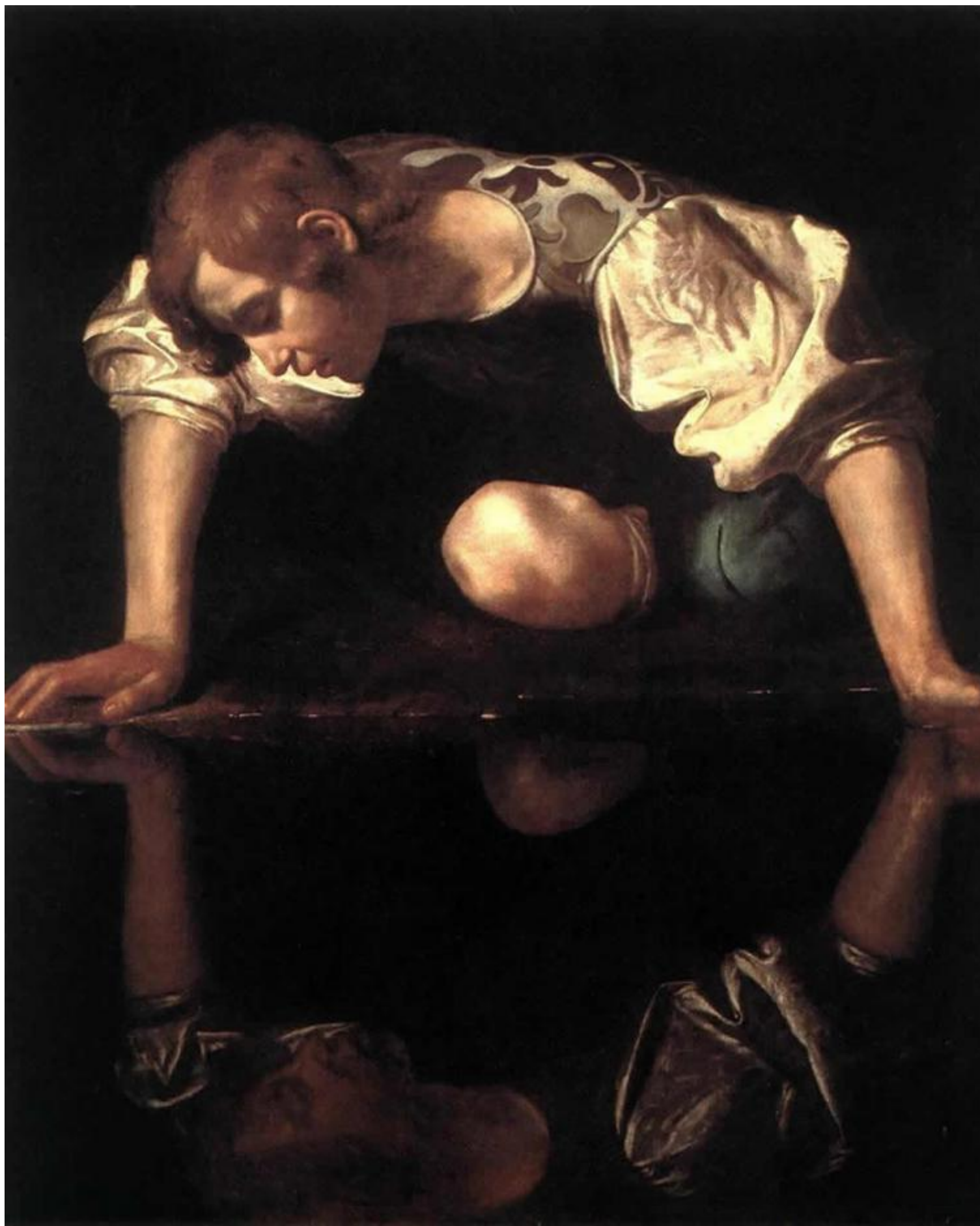
Michelangelo Merisi da Caravaggio, Narciso.