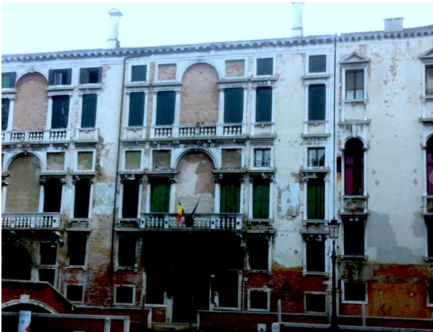
Ipotesi sul palazzo di Juliette.

Aspern è un poeta degli inizi dell'800 (le introduzioni raccontano che James si ispirò a una storia raccontata su carteggi di Shelley e Byron). Gli specialisti della sua opera sanno che esiste una corrispondenza con una donna, che poi si è trasferita in Italia, che vive, ancora, forse centenaria, rinchiusa da anni in un palazzo di Venezia. Il narratore – il protagonista, di cui sappiamo solo che è uno studioso e appassionato di Aspern – la ritrova e prende alloggio da lei, accettando di pagarle una pigione esagerata. Il suo scopo è capire se il carteggio è stato bruciato o se esiste ancora, per impadronirsene. Per farlo deve dissimulare il proprio interesse perché ad altri, che cercavano di penetrare il segreto, la vecchia si è rivolta violentemente, troncando ogni rapporto e chiudendo ogni possibilità di accesso al presunto tesoro.