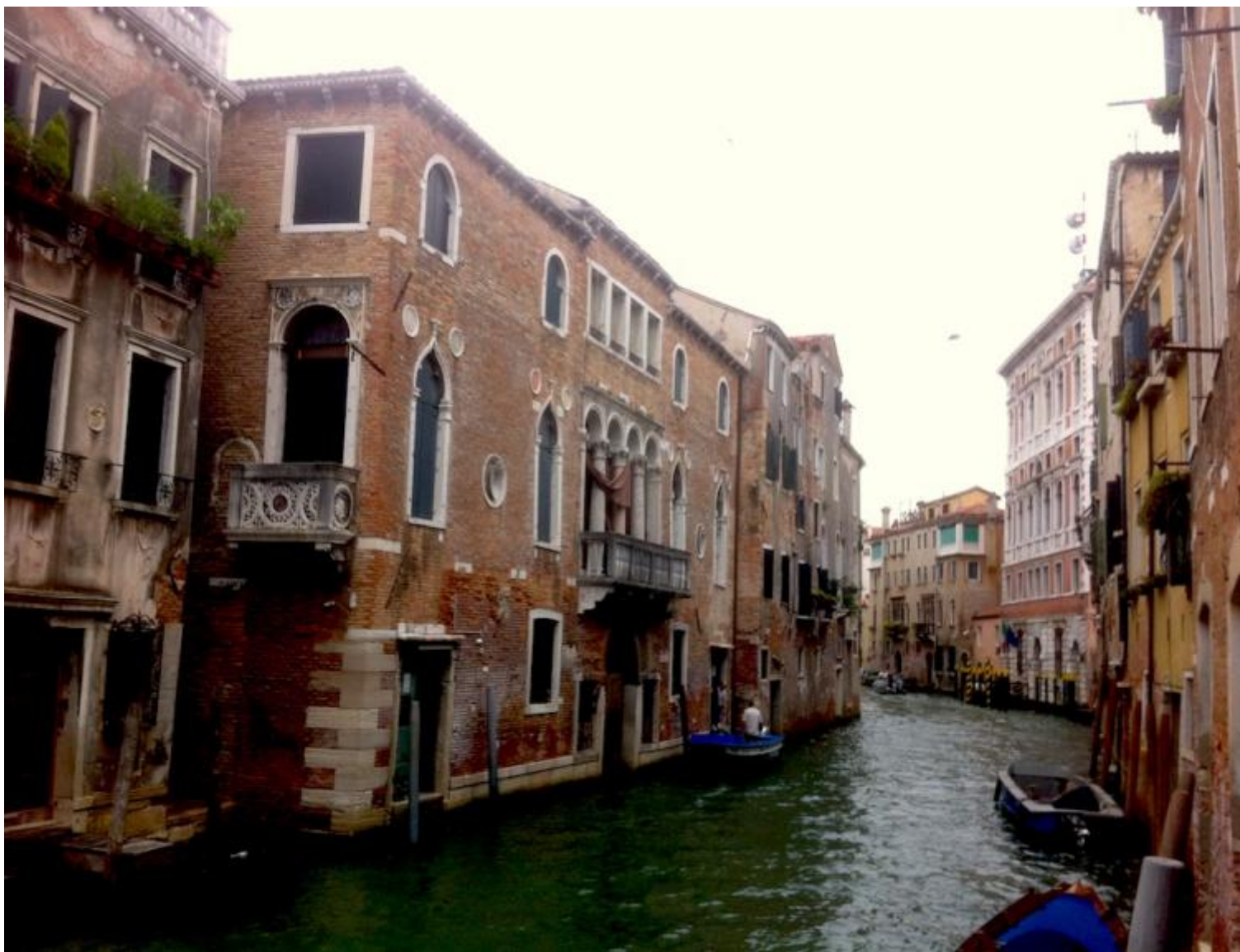
Ipotesi sul palazzo di Juliette.

Siamo in un'altra Venezia rispetto a quella di Herling, uscita da un'altra guerra, da varie guerre, non più la Dominante, non più la Serenissima: la decaduta, la decadente, la rovinosa, la putrescente... Siamo intorno al 1880: è la città stremata dall'eroica resistenza del 49, "il morbo infuria / il pan ci manca / sul ponte sventola bandiera bianca", quella della Sacca della Misericordia percorsa dall'ansia della contessa Serpieri in cerca del tenente Mahler, mentre scoppia il conflitto del 1866, che ridarà la decaduta, la vendita di Campoformio, l'esaurita, all'Italia, mentre Visconti racconta un amour fou , tradimento e vendetta, tra patrie dell'anima, tra sentimenti, tra popoli mescolati. Senso , che inizia con la più risorgimentale, patriottica delle opere di Verdi, apparentemente la meno politica, in realtà quella con il più alto tasso di insofferenza insurrezionale e di senso della sconfitta post-49: "Di quella pira l'orrendo foco/ Tutte le fibre m'arse, avvampò!... / Empi, spegnetela, o ch'io tra poco / Col sangue vostro la spegnerò... / Madre infelice corro a salvarvi / O teco almeno corro a morir..." (canta Manrico prima di finire sconfitto in un'oscura cella).