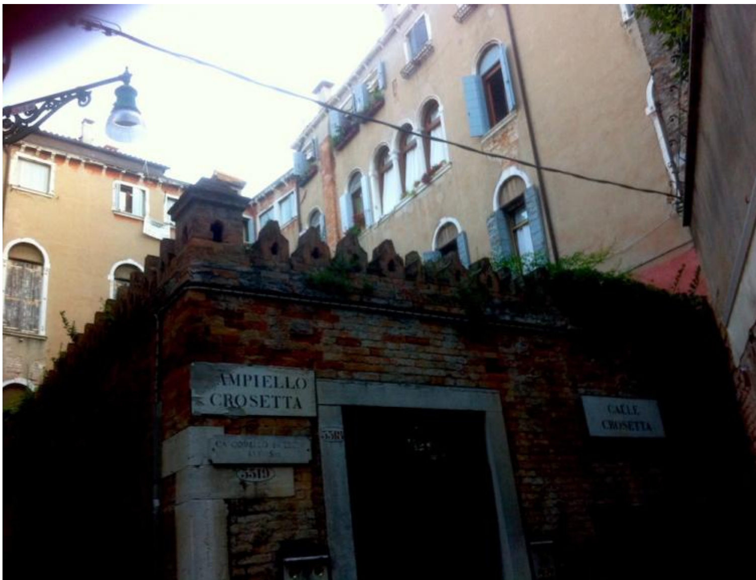
Ipotesi sul palazzo dove si svolge Il carteggio Aspern.

Lo cerchi. Lo trovi nell'edizione dei classici appartati, veloci, folgoranti della collana Centopagine di Einaudi, una delle felici invenzioni editoriali di Italo Calvino (poi guarderai anche l'introduzione di Franco Cordelli nei Grandi libri Garzanti). Inizi, quasi sicuro che farà la fine degli altri (che non hai neppure cominciato a sfogliare). E sei rapito.