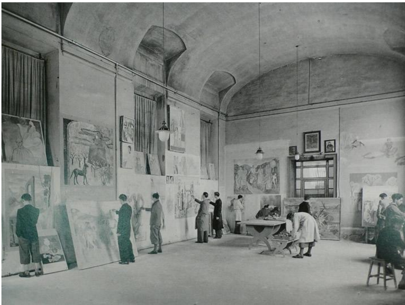
ISIA Monza, Aula di pittura murale. Foto storica © Musei Civici di Monza.

Star molto discussa della I Biennale di Arte Decorativa è stato Fortunato Depero (1892-1960) che con la sua “Sala futurista” e con quella per la sezione del Trentino, riuscì a catalizzare, in positivo e in negativo, l’attenzione del pubblico e della critica. Sebbene l’avventura futurista si fosse conclusa, annientata dalla Prima guerra mondiale, alla quale i suoi membri avevano pure inneggiato, gli epigoni deperiani del Secondo Futurismo costituiscono un interessante ibrido fra l’invito alla modernità di Marinetti e gli influssi dell’Art Déco, di cui l’artista di Rovereto finì per essere un originalissimo rappresentante. Depero allestì a Monza una sorta di wunderkammer ludica, scanzonata e persino irriverente che costituisce la premessa di quella che sarà poi “La Casa del Mago” di Rovereto, ovvero la sua casa-museo , da lui personalmente creata nel 1957, al rientro dal suo lungo soggiorno americano, e recentemente restaurata dal MART in occasione del centesimo anniversario del Futurismo.