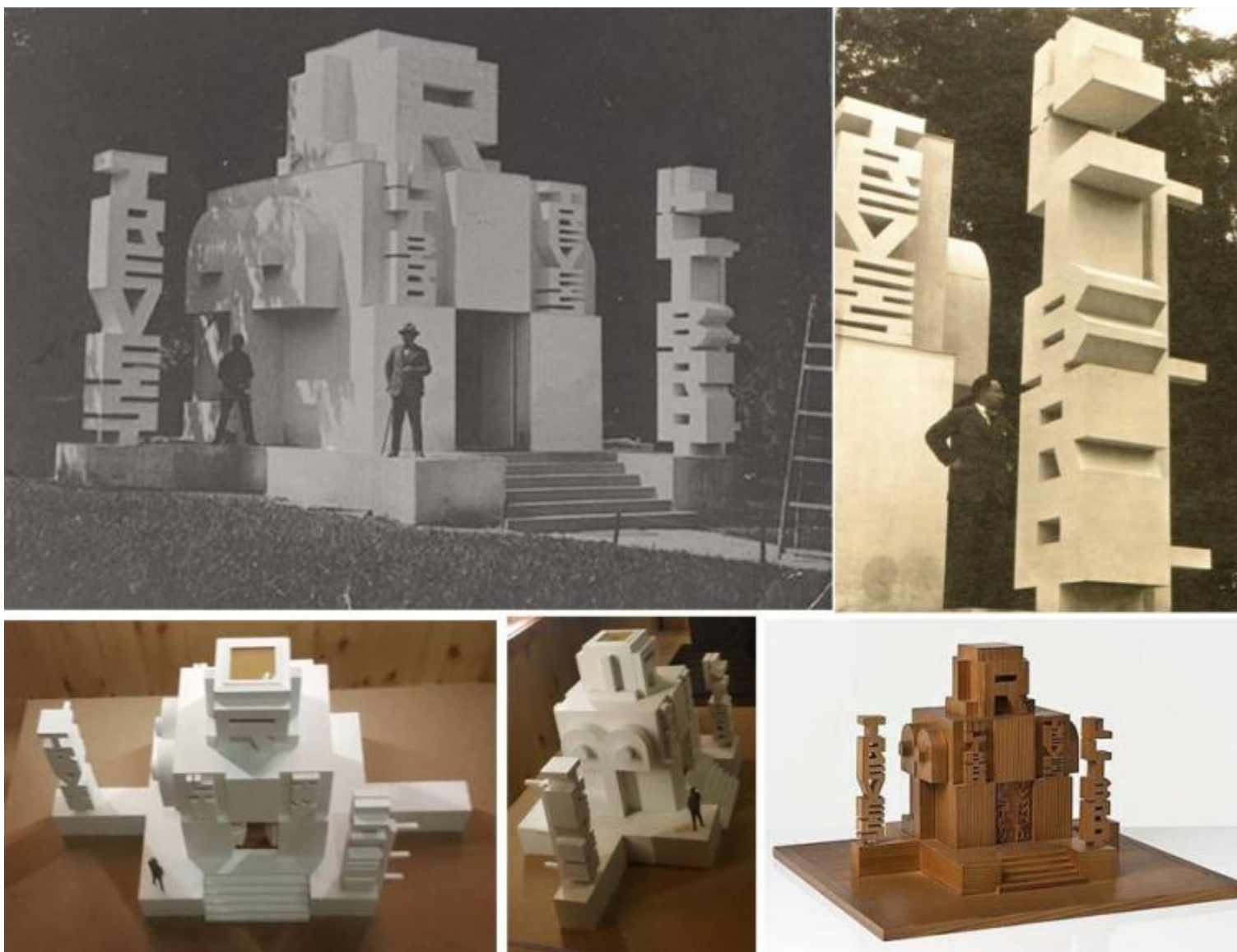
In alto: Terza Biennale Internazionale delle Arti Decorative di Monza, 1927: Fortunato Depero, Architettura tipografica, il padiglione del Libro per la Casa Editrice Bestetti-Tumminelli-Treves; l'artista accanto a uno dei suoi totem. In basso: due viste della maquette del padiglione di Depero alla Terza Biennale di Monza; maquette dello stesso padiglione realizzata in legno di cedro da Pierluigi Ghianda nel 1978.

Depero tornerà a Monza nel 1927 in occasione della III Biennale di Arte decorativa, dove allestirà il Padiglione del Libro per gli editori Bestetti-Tumminelli e Treves, un'architettura da lui stesso definita "tipografica" la cui forma era imitativa degli oggetti che ospitava al proprio interno. Ed ecco allora grandi lettere tridimensionali sovrapporsi in forma di totem come pile di libri e altrove comporsi generando spazi, in un lettering tridimensionale evocativo dei caratteri mobili dei tipografi. Questo suo sarà l'unico approccio all'architettura, mentre Gio Ponti vi si dedicherà con sempre maggiore successo, soprattutto a partire dal 1933, quando le Biennali, divenute già Triennali, si trasferiranno a Milano: della V sarà lui l'assoluto protagonista.