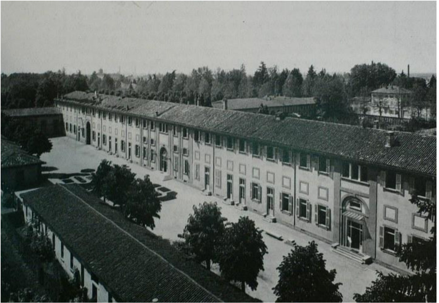
Veduta aerea dell'ala sud della Villa Reale di Monza, dove era ospitata l'Università delle Arti Decorative.

l'anno precedente, insieme ad Augusto Osimo e a Eugenio Quadri, accanto alle mostre Biennali, il nostro aveva già promosso l'Università delle Arti Decorative, divenuta in seguito Istituto Superiore per le Industrie Artistiche (ISIA), una scuola-laboratorio inaugurata il 12 novembre nell'ala meridionale della villa Reale del Piermarini e aperta a studenti di provenienza europea (vi erano annessi anche un Convitto e un Pensionato).