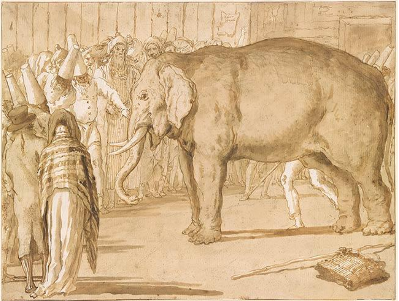
Giandomenico Tiepolo, Pulcinella con un elefante, 1797-1804, penna e inchiostro marrone su carta, The Morgan Library & Museum, New York.

Ma di quale catastrofe si tratta? Qui la riflessione entra in un campo storico e politico. L'impresa artistica delle "pulcinellerie" avviene quando Giandomenico Tiepolo ha settant'anni e si è ritirato nella villa ereditata dal padre Giambattista, dopo che, nel 1797, la Repubblica di Venezia era crollata nelle mani napoleoniche, perdendo una millenaria autonomia. Era la fine di un mondo e "nell'economia di questa fine dei tempi, tutte le cose si ricapitolano in Pulcinella". Questo personaggio filosofico con il quale il pittore si accompagna era già stato il muto testimone, in un grande affresco del 1791, del tramonto di un'epoca e dell'annuncio di una nuova era, il Mondo novo .