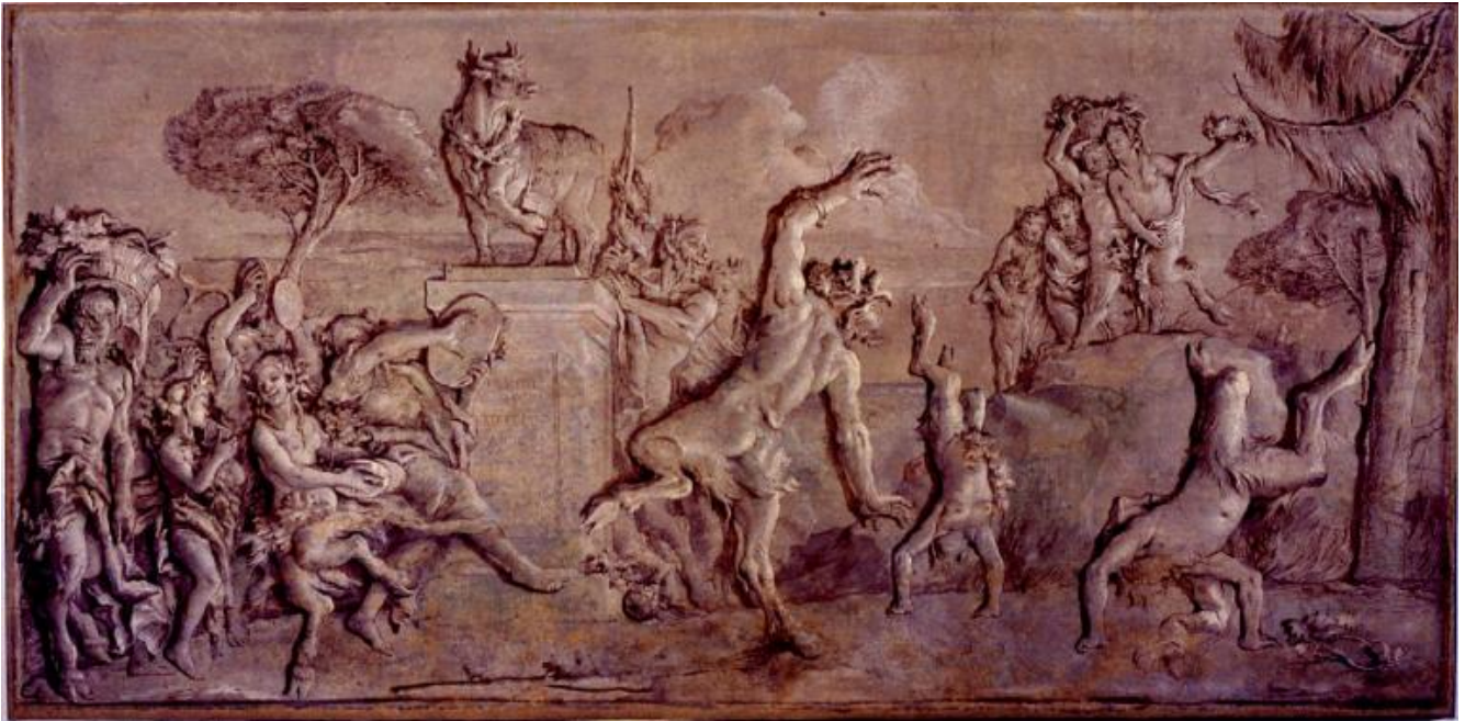
Giandomenico Tiepolo, Baccanale con satiri e satiresse, 1771, affresco. Ca' Rezzonico, Venezia

Negli affreschi della villa di Ziniago, Giandomenico Tiepolo aveva, anni prima, dipinto scene satiresche e vi sono molte corrispondenze di gesti, pose, situazioni fra i dipinti con protagonisti dei satiri e quelli con i pulcinella.