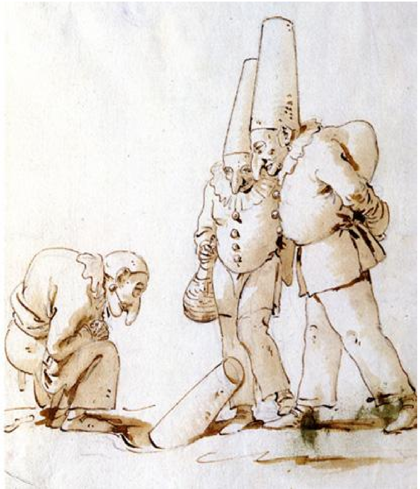
Giambattista Tiepolo, Due Pulcinella e i postumi della Festa degli Gnocchi, 1725-'50, penna, inchiostro, acquerello, Fondazione Giorgio Cini - Gabinetto Disegni e Stampe, Venezia

È in fondo questo che ci consegnano le molteplici immagini di Pulcinella: un io sfuggente e plurale, un'esistenza larvale che accompagna quella degli uomini