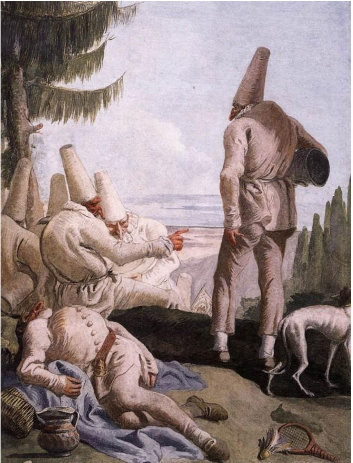
Giandomenico Tiepolo, La partenza di Pulcinella , 1797, affresco. Ca' Rezzonico, Venezia