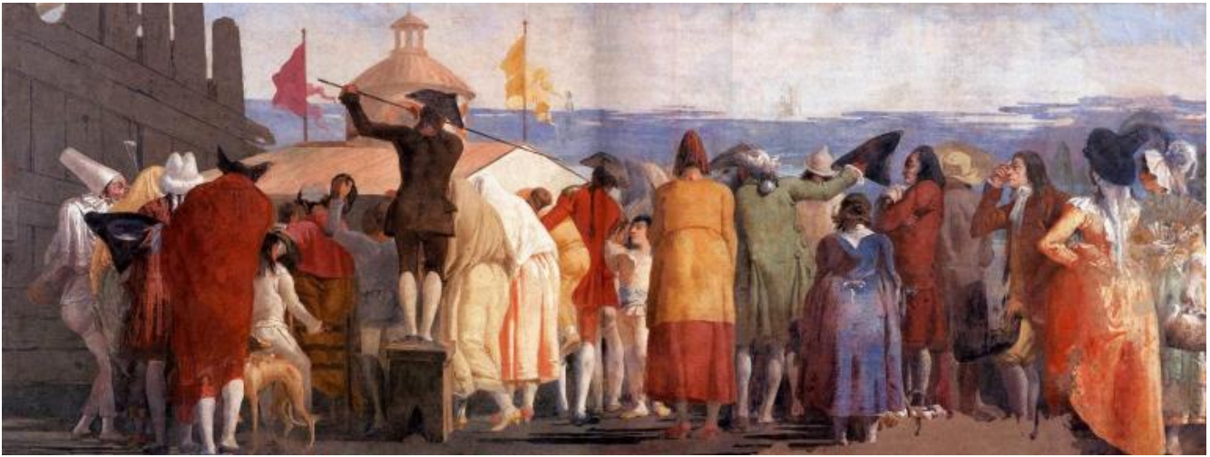
Giandomenico Tiepolo, Il Mondo novo, 1791, affresco. Ca' Rezzonico, Venezia

Una folla di spalle osserva curiosa dentro una finestrella di un casotto dove si mostrano le attrazioni che verranno, i nuovi spettacoli tecnologici della modernità; tutti attendono di guardare dentro un cosmorama, uno dei dispositivi ottici pre-cinema, che permetteva di vedere con grande realismo panorami di luoghi lontani. In un lato ci sono due persone di profilo, il pittore e suo padre Giambattista, al centro, unico che guarda verso l'osservatore, un bambino (il protagonista del mondo che viene), al lato opposto vediamo invece un Pulcinella con il cappello a tubo, un personaggio che "annuncia il regno - o il sogno - intemporale che coincide con la fine di quello storico". Agamben non si sofferma però su un particolare significativo: è questa l'unica immagine in cui Pulcinella appare senza maschera, ma con il solo volto grifagno, in cui sorriso e pianto sembrano coincidere; nei disegni e negli affreschi successivi di questo infinito divertimento avrà sempre invece la sua classica maschera nera, senza poterla più togliere. Ma nello straordinario gioco di sguardi dell'affresco, vediamo il suo volto così uguale alla maschera, il suo sguardo da un altro mondo che attraversa con disincanto gli sguardi negati della folla di spalle, gli sguardi seri, attenti, curiosi della donna di profilo che chiude il gruppo e dei due pittori che osservano con distacco lo spettacolo.