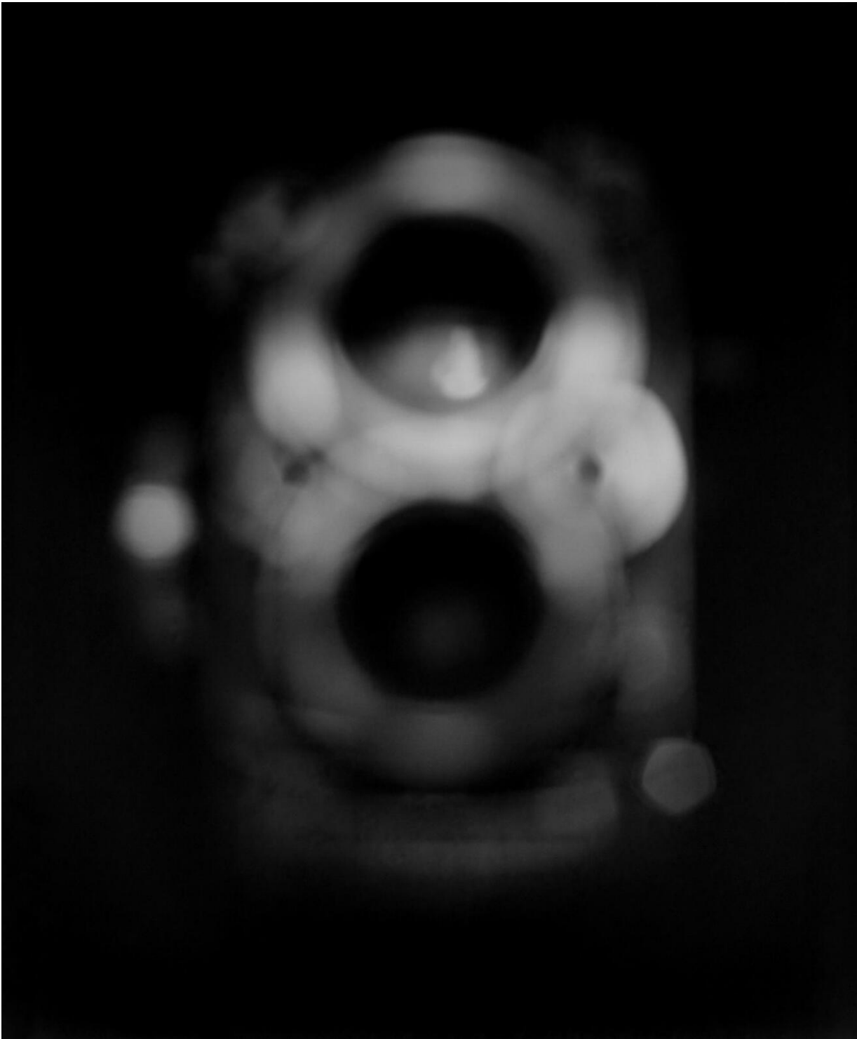
Untitled (Rollei), 1996

E mentre Warhol diceva: "I'll be your mirror", sarò il tuo specchio, Vimercati ha detto: "Io sono la lastra", frase che si può intendere in vari modi, tutti legati tra di loro, a me pare.