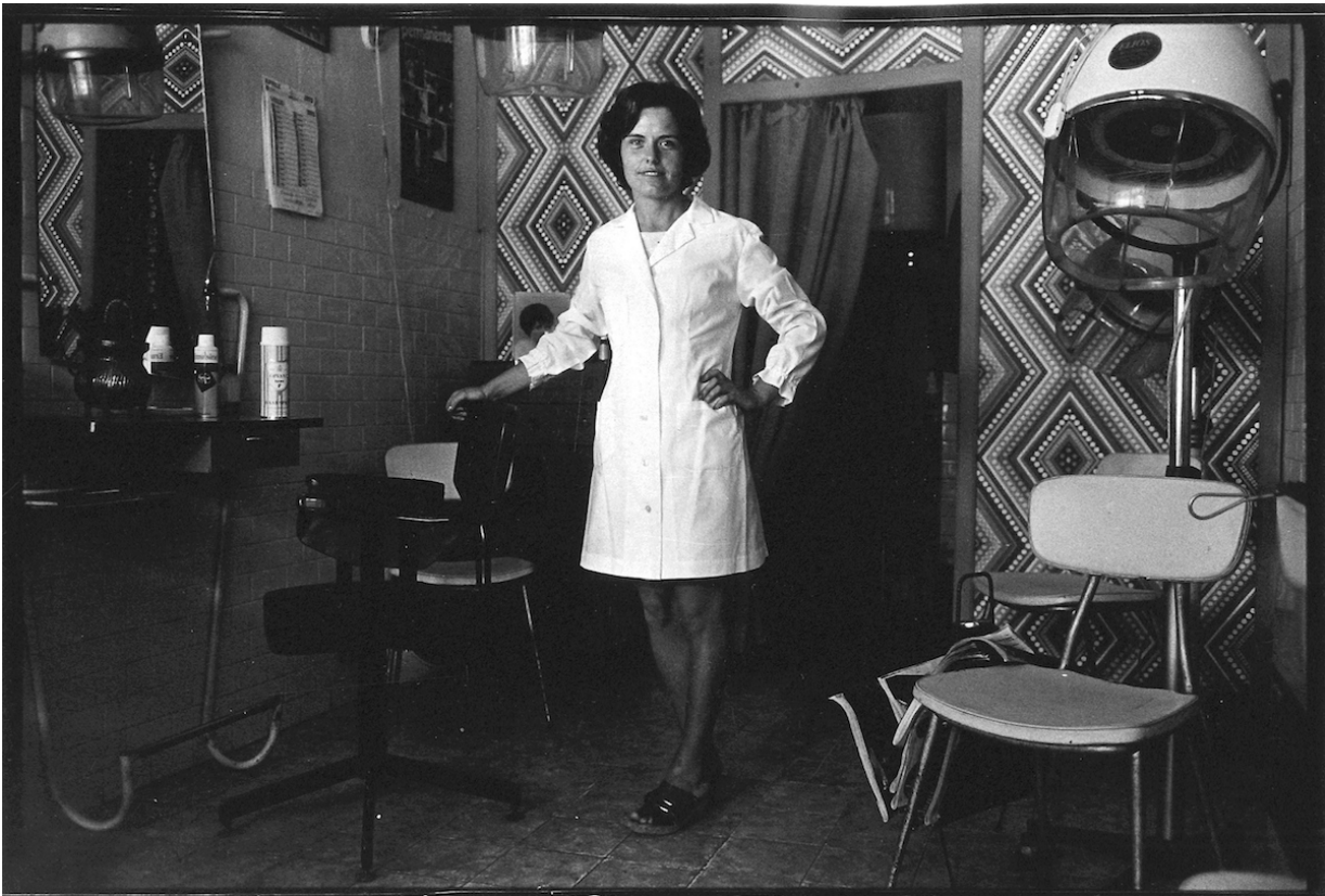
Monforte d'Alba, Pettinatrice, 1973, Courtesy Galleria Raffaella Cortese, Milano (C) Eredi Franco Vimercati

Eravamo nel 1995 - oggi quella galleria celebra i suoi vent'anni di attività, per la verità ventuno, con un'ampia personale dedicata allo stesso artista. Non sono un tipo che va a conoscere gli artisti se non trovo un motivo concreto, specie allora, per cui passarono di fatto altri cinque anni prima di avere l'occasione di conoscerlo di persona. Nei primi mesi del 2000 decisi di dedicargli la copertina di una rivista che dirigevo, che si chiamava "Ipso Facto". Finalmente dunque lo cercai e gli parlai del progetto. Ne fu molto contento, volle curare la copertina di persona - era un ottimo grafico di professione - e, a dispetto degli artisti che vogliono un'immagine il più grande e d'effetto possibile, mise due zuppiere, una in prima e una in quarta di copertina, centrate e allineate con il nome della rivista e varie altre immagini molto piccole sparse sul resto delle superfici. Ne mise tre anche in seconda e tre in terza di copertina. Scelse naturalmente anche il colore di fondo e tutto il resto.