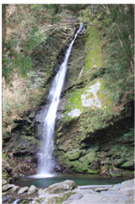
Una cascata a Iya.

Oggi Kerr non vive più a Chiiori, che è diventata anch'essa una struttura alberghiera. Si può prenotarla e dormire lì. Così abbiamo fatto anche noi. Verso la fine di marzo abbiamo soggiornato a Chiiori una notte. Ed è stata un'esperienza memorabile. È forse la minka meglio ristrutturata che io abbia mai visto. Ha un grande spazio vuoto, bellissimo. L'amico architetto, entrandoci dentro, ha esclamato "il trionfo dello spazio vuoto!". Chiiori ha mantenuto molto bene la sua fisionomia originale fatta di legno massello con travi e pilastri molto grossi, muri di terra e vegetali e tetto di paglia mirabilmente restaurato, ma è dotata di tutte le innovazioni tecnologiche che rendono possibile viverci anche in pieno inverno, tutte abilmente nascoste, a cominciare dal riscaldamento sotto il pavimento. All'interno delle minka di una volta, d'inverno, faceva molto freddo e a marzo a Iya la temperatura è ancora molto bassa.