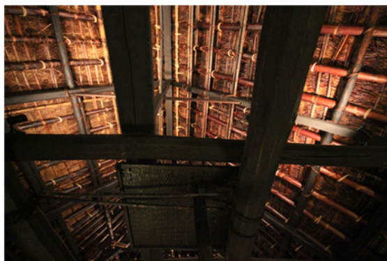
Il soffitto di Chiiori.