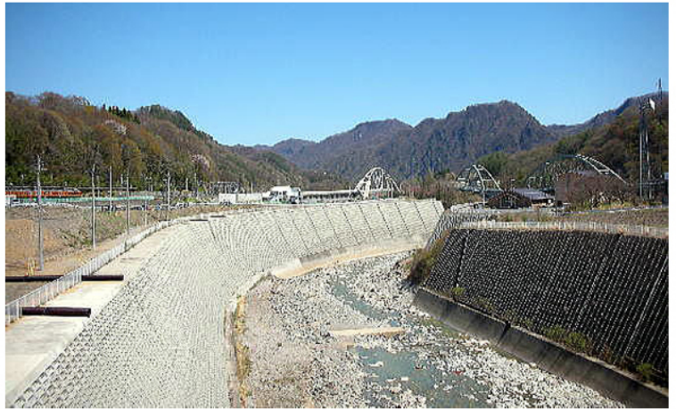
Le rive cementificate di un fiume .

Qui bisogna leggere bene il significato di queste cifre. Purtroppo la maggior parte di questi lavori sono stati inventati per spendere soldi, non perché fossero davvero necessari. E come una macchina infernale, una volta avviati non c'è modo di fermare questi progetti, molto spesso devastanti per l'ambiente. Solo che in Giappone il Ministero dell'Ambiente esiste solo per dare consensi formali e non ha alcuna normativa efficace né alcun effettivo potere per esaminare questi progetti edilizi inutili e dannosi e fermarli. Tutto questo perché nel dopoguerra lo Stato ha deciso di privilegiare l'economia a discapito di tutto il resto.