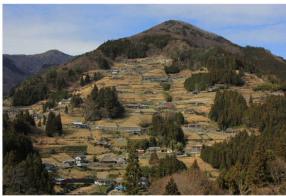
Il villaggio di Ochiai nella Valle di Iya.