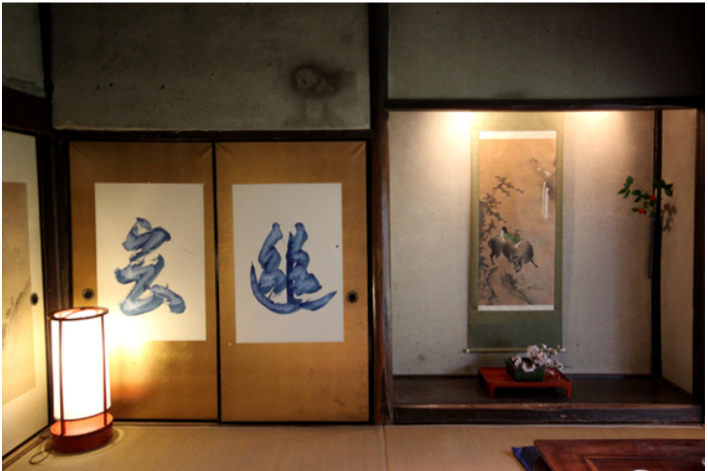
Il soggiorno con oggetti da collezione e la calligrafia in cui si legge “Yû-gen”