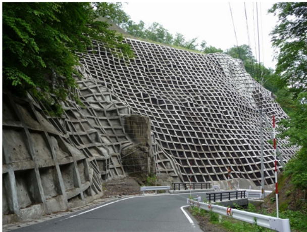
Tipica "protesi" applicata al versante di una montagna.

Nel 1998, i lavoratori del settore rappresentavano il 10.1 % di tutti i lavoratori giapponesi, il doppio rispetto all'UE. I soldi spesi per l'edilizia in Giappone superano di gran lunga quelli spesi negli USA per gli armamenti. Nel 2001 l'edilizia rappresentava il 13% del PIL giapponese, mentre nello stesso periodo in America lo stesso settore registrava solo il 5% del PIL. Il Giappone ha speso per i lavori pubblici realizzati nei 13 anni tra il 1995 e il 2007 circa 650mila miliardi di yen, quasi 4 volte più di quanto spendeva l'America nello stesso periodo, nonostante il Giappone abbia una superficie (di cui tra l'altro il 70% è zona montana, quindi non idonea all'edificazione) pari a un venticinquesimo del suolo americano. Kerr continua a snocciolare dati. Abbiamo 2800 dighe sul nostro territorio (che è poco più grande di quello italiano) e in programma (nel momento della pubblicazione del libro) altre 500 da costruire (!!!). Tutte queste cifre sull'edilizia sono impressionanti e i promotori principali sono i due ministeri, il Ministero del Territorio e dei Trasporti e il Ministero dell'Agricoltura, delle Foreste e della Pesca.