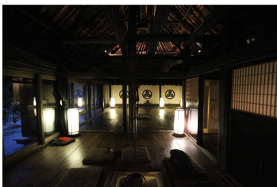
L'interno di Chiiori: trionfo dello spazio vuoto intorno al fuoco.

Qualcuno potrebbe rimanere molto stupito nel sapere che questo spazio così raffinato e ricco di qualità era una volta una casa di contadini. Tutta questa bellezza, oggi ulteriormente sottolineata da piccoli tocchi squisiti del proprietario come Ikebana o meravigliose calligrafie sulle Shôji (le porte scorrevoli con la struttura di legno ricoperta di carta giapponese), era a portata del popolo. La qualità e la bellezza non erano concetti necessariamente legati al lusso, che Bruno Munari considerava stupido. La minka è il risultato di una progettazione coerente con l'ambiente, con la tecnica e i materiali disponibili sul territorio. È una specie di corpo semi-vivente che sembra cresciuto dalla terra stessa e respira e invecchia col tempo. Non si oppone né ignora l'entropia come l'architettura moderna. Per questo vi regna un'estetica realmente organica che l'uomo da solo difficilmente riuscirebbe a realizzare. Eravamo letteralmente ammirati da quella casa, e profondamente riconoscenti del pensiero e dell'azione di Alex Kerr, proprio perché in questo viaggio, più entravamo a conoscenza del vecchio Giappone, più ci rendevamo conto di cosa e quanto abbiamo perso nel corso della costruzione del nuovo Giappone: conoscenza del territorio, rapporto sostenibile con esso, con il tempo, qualità altissima della progettazione, bellezza... sotto tutto questo scorreva la vita.