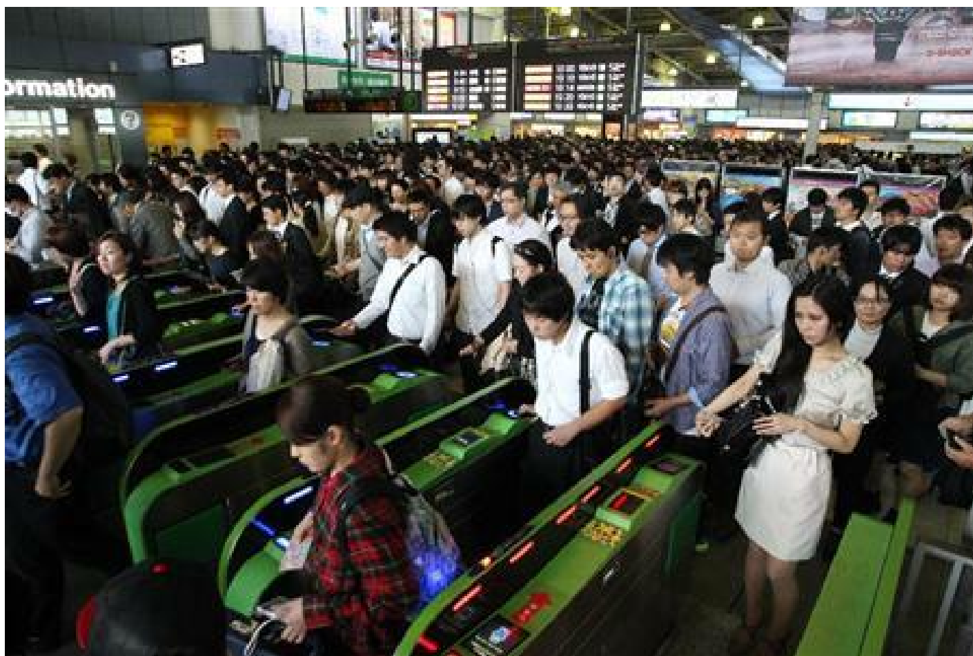
Il flusso continuo di una grande quantità di passeggeri.

Non crediate che i giapponesi siano chiamati a fare un addestramento specifico per passare velocemente l'ingresso della stazione (anche se ne sarebbero capaci), è l'intera educazione scolastica che mira a impartirci questo senso di disciplina e prontezza. Sembrano piccoli dettagli, ma quando tutta la popolazione delle zone urbane si comporta in un dato modo e ripete diligentemente gli stessi gesti, fa un certo effetto. Voi direte che è un segno di civiltà. In parte è vero, ma bisogna leggere lo scopo finale di tutto questo.