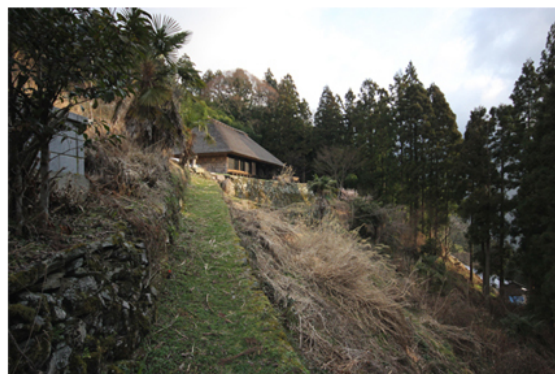
Chiiori nell'ambiente circostante.