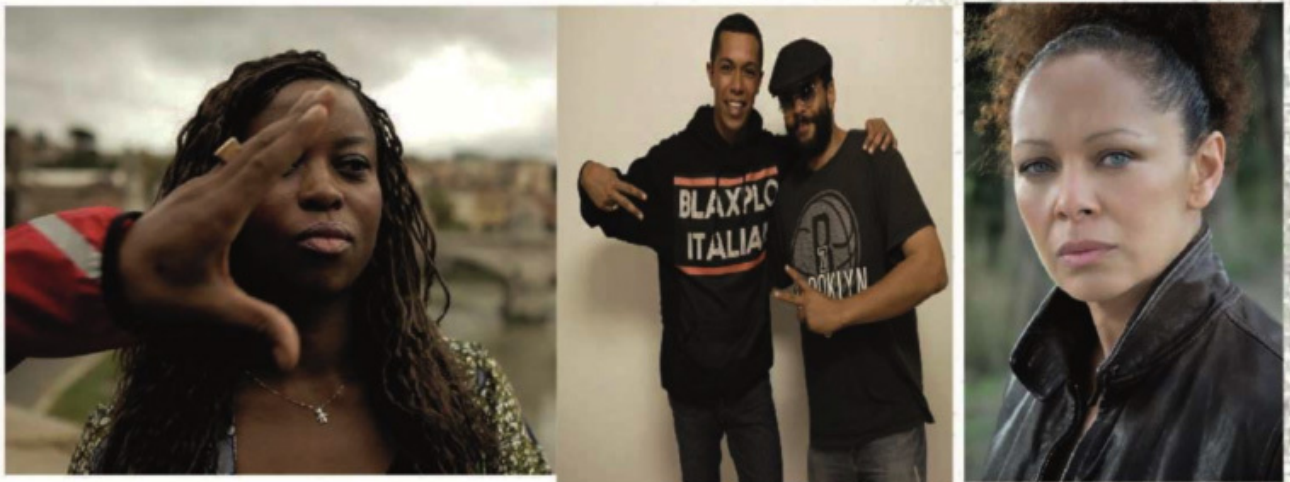
Blaxploitalian film poster.